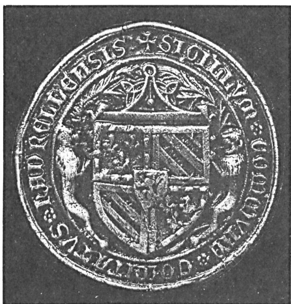
Fig. 1. Sceau de la cour du comté de Charolais

Un passage du chroniqueur Monstrelet est particulièrement explicite à l'égard d'un autre emblème — le niveau de maçon — distribué le premier de l'an 1409: Et lendemain qui fut le jour de ladicte Circuncision, du