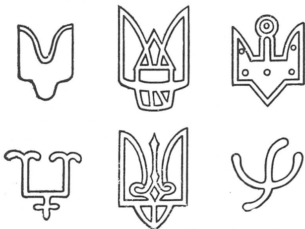
Fig. 1. Quelques «armoiries» rurikides.

Totalement différente de l'héraldique de l'Occident médiéval apparaît dans la Russie du X e siècle une emblématique princière, généralement dénommée rurikide , constituée de signes plus ou moins complexes (fig. 1).