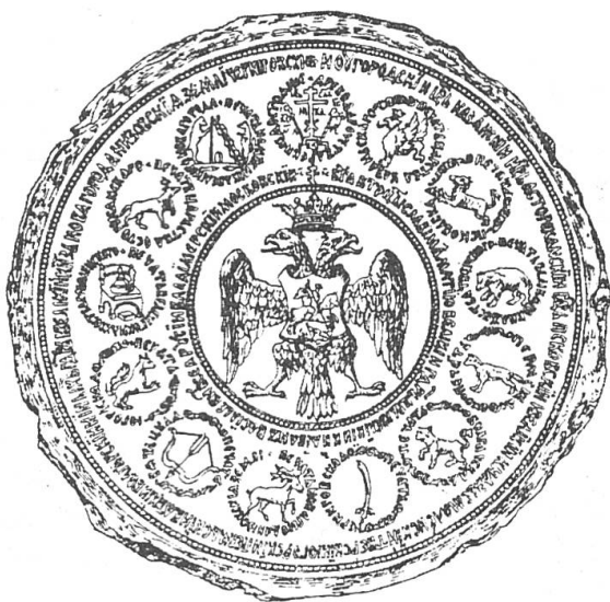
Fig. 4. Sceau d'Ivan IV le Terrible (1533-1584).