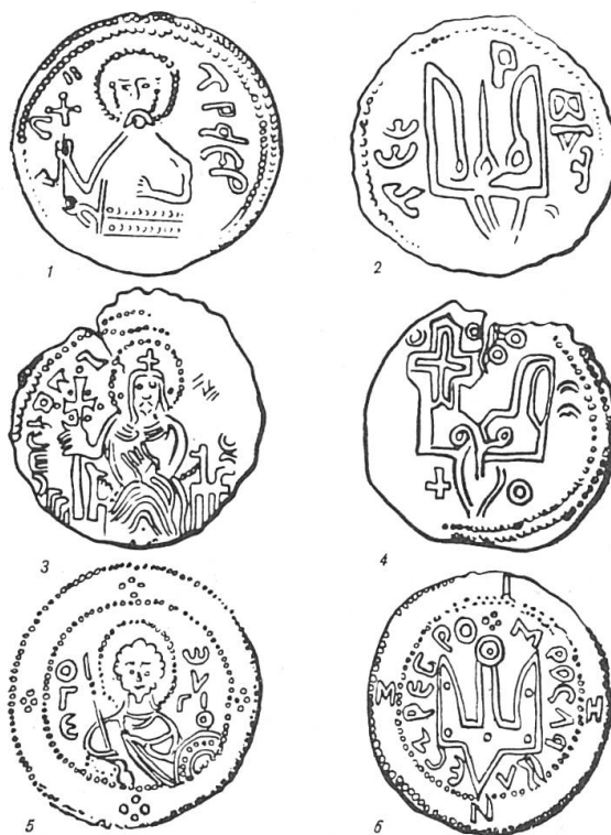
Fig. 2. Monnaies princières armoriées: 1-2: Vladimir Sviatoslav (c. 970), 3-4: Sviatopolk (c. 1000), 5-6: Iaroslav le Sage (c. 1030).

Il est prouvé que ces «armoiries» sont personnelles et qu'en passant du père au fils elles sont brisées soit par addition soit par simplification. La notion d'armes pleines est inconnue: la brisure demeure après la mort du père, la confusion entre deux générations ne doit pas être possible.