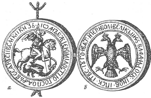
Fig. 3. Sceau d'Ivan III (1462-1505).