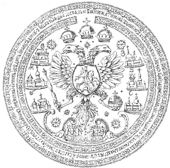
Fig. 5. Sceau d'Alexis Mikhaïlovitch (c. 1620).