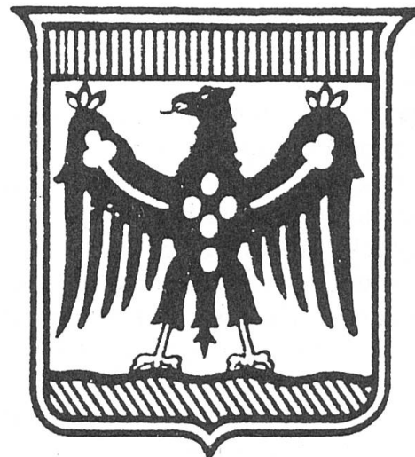
Fig. 3. Wappen der Provinz Trient 1927.