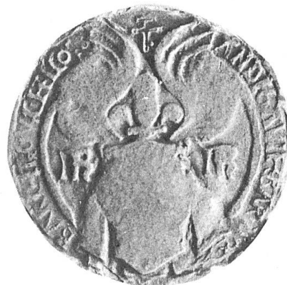
Fig. 3. Contre-sceau de René d'Anjou après 1466.

Il est cependant d'autres objets où se voient les éléments parahéraldiques de la description