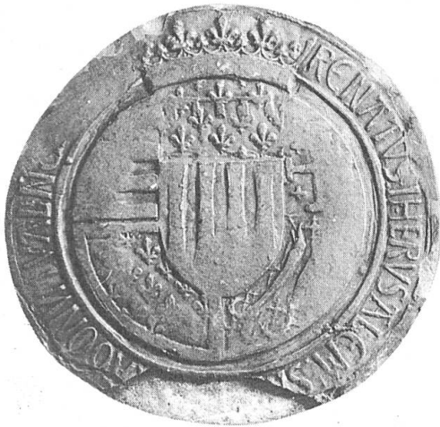
Fig. 1. Sceau de René d'Anjou appendu à un acte de 1480 et portant les armoiries arborées de 1466 à 1480.