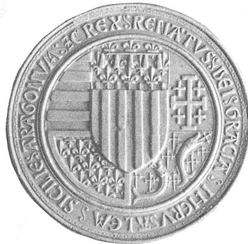
Fig. 2. Empreinte d'une notice de sceau aux armes de René d'Anjou après 1466. Cette forgerie présente l'avantage de constituer une figure plus nette que le sceau utilisé de 1466 à 1480 dont les épreuves sont de qualité médiocre.

mise en forme des matériaux rassemblés il y a plus de dix ans. Cet article n'a donc d'autre but que de compléter la documentation qui doit être publiée au cours des prochaines années dans un ouvrage sur René par M. de Merindol et dont la parution est vivement souhaitée.