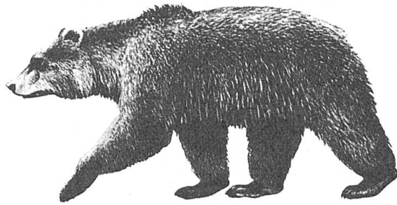
Abb. 3. So sieht ein Braunbär aus; er ist ohne menschliches Zutun schön. Aus: Van den Brink: Die Säugetiere Europas.

Der Braunbär gehört in die Familie der bärenartigen Raubtiere (Ursidae), die sich wissenschaftlich u.a. durch das Allesfressergebiss charakterisieren lassen. Er lebt mehr oder weniger vegetarisch, hat deswegen einen verhältnismässig langen Darm und dies ist der Grund, weshalb sein Bauch nicht eingezogen sein kann. Mit einer Kopf-Rumpflänge von 170-230 cm und einer Schulterhöhe von 90-110 cm ist er eher kurzbeinig. Die geringe Höhe hängt auch mit dem Umstand zusammen, dass der Bär Sohlengänger ist, also