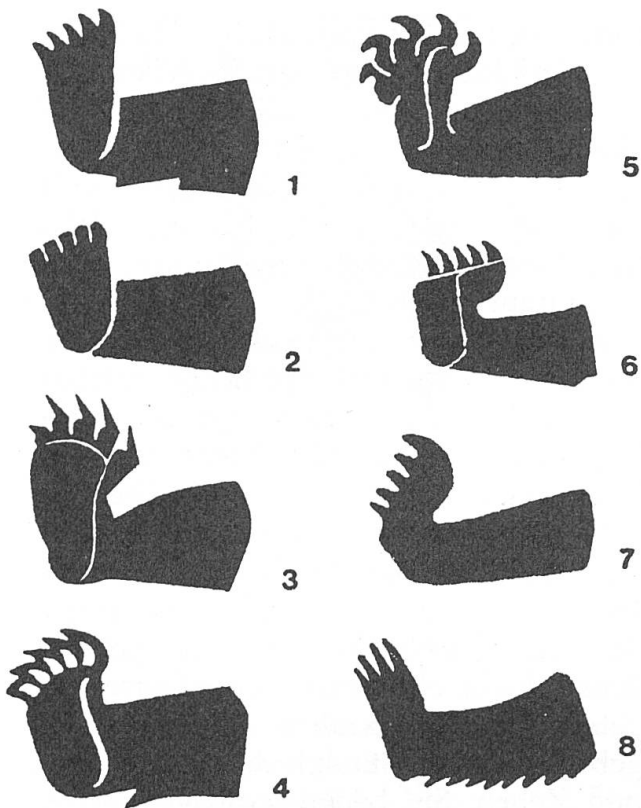
Abb. 6 Tatzformen. 1: Schwimmflossentatze. 2: Stumpfzehen- tatze. 3: Stilettkrallentatze. 4: Sägetatze. 5: Fräsen- segmenttatze. 6: Steigeisentatze. 7: Tricounitatze. 8: Fran- senfusstatze.

Bergschuhbären haben mit gekonnter Stilisierung wirklich nichts zu tun, auch nichts mit der ihren Schöpfern übrigens kaum bekannten Tatsache, dass es sich beim Berner Wappentier um einen Alpenbären handelt. Es sind fast durchwegs moderne Wappenbären, die an der Fräsen- oder der Bergschuhkrankheit leiden. Daneben sieht man auf modernen Bernerfahnen Bären, die an Tatzendegeneration leiden. Sie besitzen entweder kurze, stumpfe und krallenlose Zehen oder aber zugespitzte, gänzlich undifferenzierte Zehen, die sich wie müde Fransen ausnehmen.