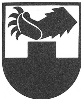
Fig. 5. Iffwil.