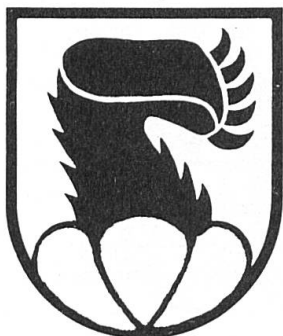
Fig. 4. Reichenbach (vallée de la Kander).