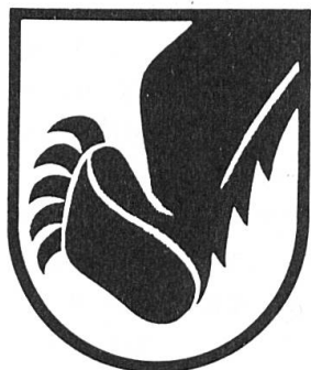
Fig. 3. Aeschi près de Spiez.