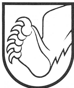
Fig. 1. Büren et Nidau.

Le premier sceau officiel de Berne, datant de 1224, montre un ours posé en bande. Ce blason parlant au plantigrade populaire et redouté a été porté dès lors par la République et la Ville de Berne ( de gueules à la bande d'or chargée d'un ours de sable langué, armé et vilené de gueules ). La patte droite de l'ours a été concédée à trois bailliages après leur conquête par les troupes bernoises ou leur occupation: Büren en 1388, Nidau en 1393 et Erlach en 1476. Armoiries de Büren: de gueules à la patte d'ours d'argent mouvant du flanc senestre (Fig. 1); de Nidau: d'argent à la patte d'ours de gueules mouvant du flanc senestre (Fig. 1); d'Erlach (Cerlier): de gueules à la patte d'ours de sable mouvant du flanc senestre tenant un aune (en allemand: Erle) de sinople au tronc d'or (Fig. 2). Ces bailliages sont aujourd'hui districts du même nom.