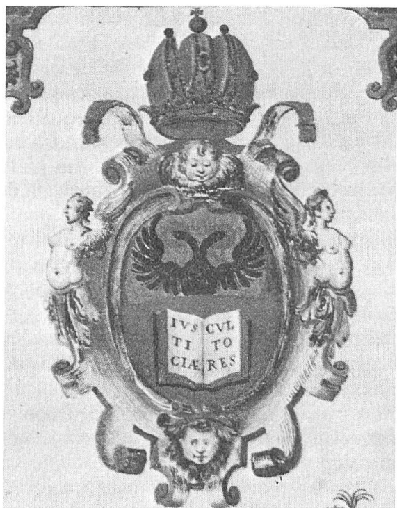
Fig. 1. Armes de la Natio Germanica: de gueules au livre ouvert d'argent, à la tranche d'or, portant en lettres de sable l'inscription IVS/TI/CLAE/CVI/TO/RES; au chef d'or à l'aigle bicéphale issante de sable nimbée de gueules et becquée du champ.