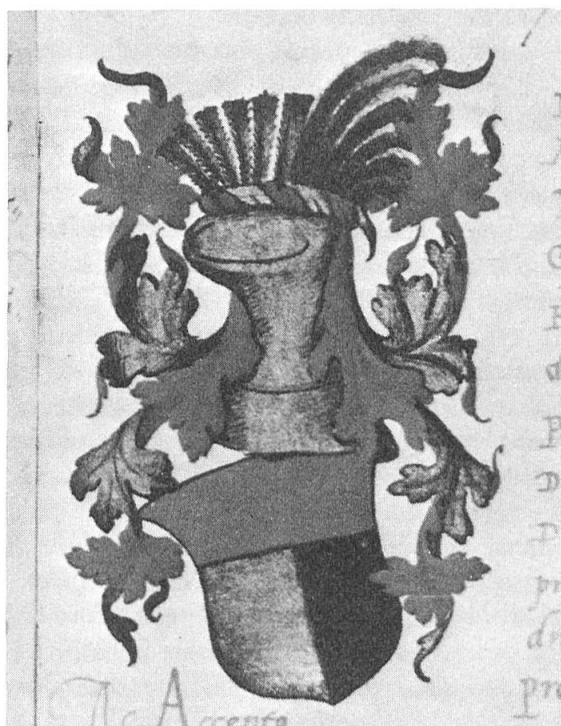
Fig. 3. Gersdorff, Melchiar de, Saxe, 1515: coupé de gueules et parti d'argent et de sable.

Le professeur Plessi publie dans son ouvrage 200 excellentes reproductions en couleurs des armoiries présentes dans le fonds de la Nation germanique, à savoir: 32 peintes dans les Annales et datant de 1393 à 1543; 2 sur la page de titre de la Matricule de 1579, et 166 figurant dans les deux Libri armorum . Chaque armoirie est blasonnée et datée. Celles qui ont été dessinées de 1599 à 1660 sont d'un type très semblable évoquant l'usage d'un chablon pour l'écu, le casque et les lambrequins. Nous en reproduisons trois illustrant le