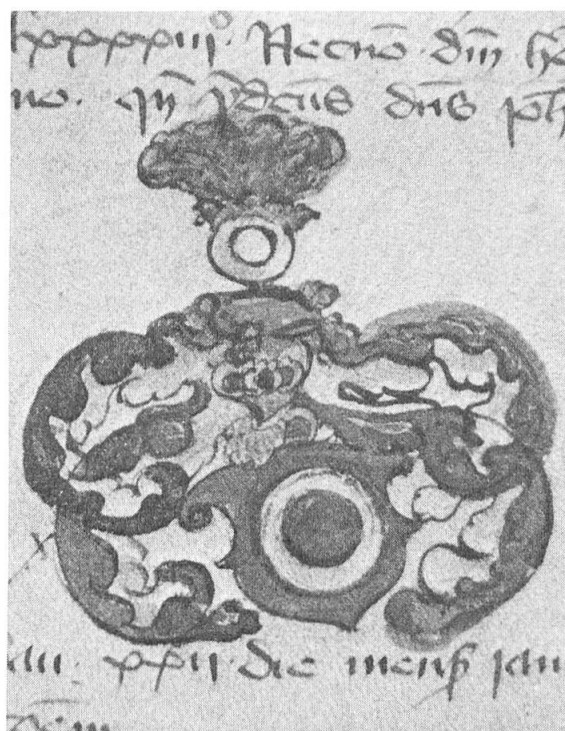
Fig. 2. Knoeringen, Eglolff de, Souabe, chanoine d'Augsbourg, 1393: de sable à l'anneau d'argent.

(1292-1750), possédant des archives contenant annales, matricules, privilèges, armoriaux et actes divers, cette association a été supprimée par Bonaparte en 1796. Au cours de plus d'un siècle, ses archives dispersées ont été partiellement recueillies et rassemblées par la famille Malvezzi; celle-ci a fait don de ce fonds à l'Université de Bologne en 1957.