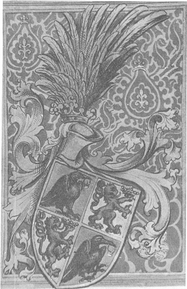
Abb. 1. Das im Jahre 1453 erweiterte Wappen von János Hunyadi im Wappenbrief von König Ladislaus V. – Dl. 24 762.

Weiss (Silber) einen roten Löwen in der linken Vorderpranke eine Krone haltend (Abb. 1). Nach der ausführlichen Erklärung des lateinisch abgefassten Wappenbriefes symbolisiert der sich aufbäumende Löwe, dass János Hunyadi als Reichsverweser in den verworrenen Zeiten alles für die Verteidigung der Rechte des Landes und des Königs tat: Für die Anerkennung