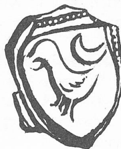
Abb. 3. Siegelfragment von János Hunyadi aus 1456 mit dem alten Rabenwappen – ohne Löwe (Dl. 15 046).

Auf der Mehrzahl der Wappenbriefe dieser Zeit sind die Helme silbern, König Ladislaus verlieh aber Hunyadi ein Wappen mit goldenem Helm. Die ältere Fachliteratur kam aufgrund der Untersuchung einiger weiterer Wappen mit goldenen Helmen zum Schluss, dass diese im Falle Ungarns keineswegs als eine hochadeligen