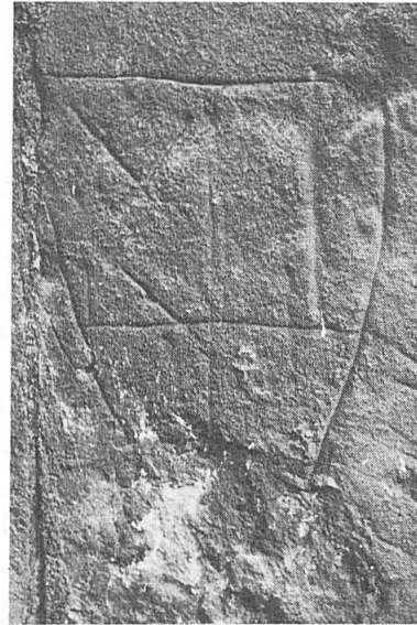
Abb. 1. Wappenritzung in Rufach.

Valangin, de gueules au pal d'or chargé de trois chevrons de sable. Sur l'autre face, qui est en mauvais état, se voient les armes de l'évêché de Bâle, d'argent à la crosse de gueules tournée à senestre et de son prince, l'évêque Philippe de Gundelsheim, de gueules au pal d'argent. La borne est du même type que celle des Reprises que nous avons publiée dans l'Annuaire des AHS 1974 ( Bornes armoriées du pays de Neuchâtel , p. 45, fig. 4); elle figure sous chiffre 3 sur le plan de la mairie de La Chaux-de-Fonds de 1659 ( ibid. , p. 46). Ce précieux témoin historique a trouvé un abri sûr au Musée paysan de La Chaux-de-Fonds où il a rejoint la borne des Reprises.