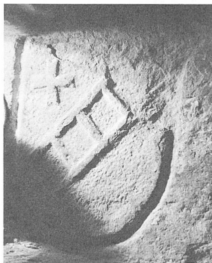
Abb. 1. Komtur Johann Leiterlin, 1478.

In dem zwischen Kirche und Turm gelegenen und mit letzterem scheinbar gleichalterigen sog. «Moserhaus» verbunden, fand man in der Nordwand des 1. Stockes eine als Fenstergesimse dienende, wappengeschmückte Sandsteinplatte, ca. 65:65 cm gross, eingemauert. Diese, später hier verwendete Gesimsplatte weist einen französischen Dreieckschild aus dem 15. Jahrhundert, 35:47,5 cm gross auf, dessen linkes Obereck abgeschlagen wurde. Der Schild-