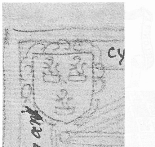
Fig. 3. Détail du dessin de la tombe d'Autun.

Les angles de la dalle étaient ornés d'écussons :