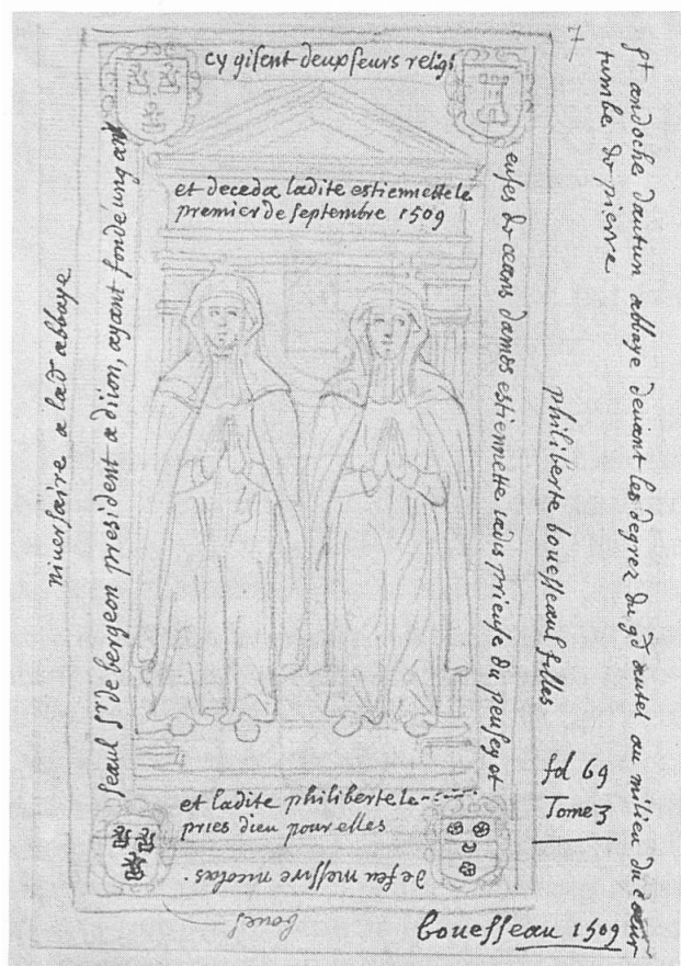
Fig. 2. Dessin de la tombe d'Etienne et Philiberte Bouesseau.