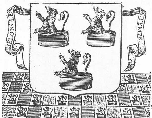
Fig. 4. Armoiries des Bouesseau gravées par Palliot dans le Parlement de Bourgogne (cl. J.B.V.).

de «M e Thomas Bouesseau secretaire et audienchier de Phle duc de Bourgogne» 20 : de sable à trois demi-lions d'argent issants de trois boisseaux d'or (fig. 5).