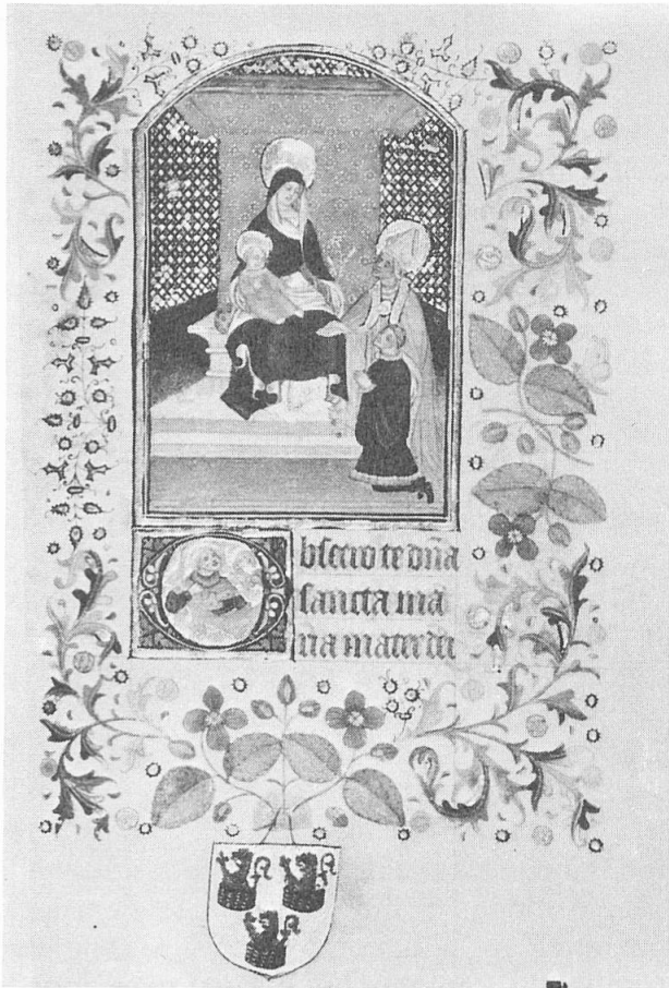
Fig. 1. Le folio 234 Ms. W. 219 de Baltimore.

heures du duc de Berry paraissant lui être dues 6 .