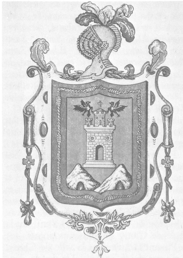
Abb. 1. Das Wappen der Stadt San Francisco de Quito. Aus Libro de Homenaje a la muy ilustre Municipalidad del Cantón , Quito 1914, por Pedro P. Traversari (Ms. Archivo Histórico Municipal).

Die europäische Heraldik gelangte zu einem Zeitpunkt in die Neue Welt, als sie unter Kaiser Karl V. in Spanien einen letzten Höhepunkt erreichte. Es ist ein Glücksfall der Überlieferung, dass so viele archäologische Zeugnisse im Mutterland erhalten sind. Der Adler der Casa de Austria, also der Reichsadler, fand weite Verbreitung im spanischen Amerika und drückt in einer Reihe von Städten der ehemaligen Vizekönigreiche die königliche Oberhoheit aus; im Gegensatz zur angelsächsischen Besiedlung des nördlichen Doppelkontinents vollzog sich die politische Erschließung der südlichen, spanischen und portugiesischen Hemisphäre im Namen und im Auftrage der Krone 1 . Der Niederschlag dieser Tatsache findet sich in der Heraldik auf lateinamerikanischem Boden, indem neben dem Reichsadler besonders das Wappenbild Kastiliens (Burg, Castellum) verwendet wird. In auffälliger Häufung begegnet auch der Brauch des Schildbords, der die Funktion der näheren Identifizierung leistet. So zeigt das Wappen der Stadt San Francisco de Quito im Bord die Kordel aus dem Habit des hl. Franciscus von Assisi, der Namensgeber der Stadt ist, während die