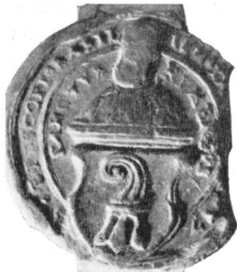
Fig. 1. Sceau de la seigneurie d'Arguel, 1556.