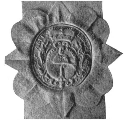
Fig. 2. Sceau du baillage d'Erguel, 1733.