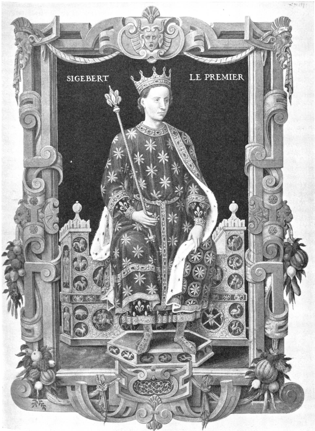
Le roi Sigisbert I er († 575) dans le Recueil