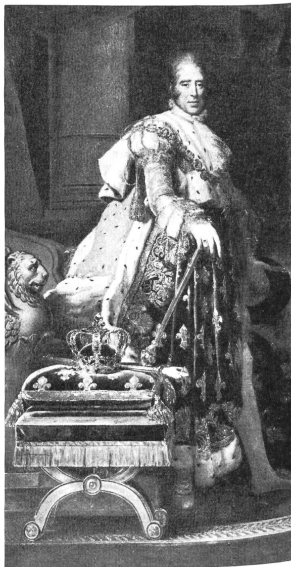
Fig. 10. Charles X, par Gérard.