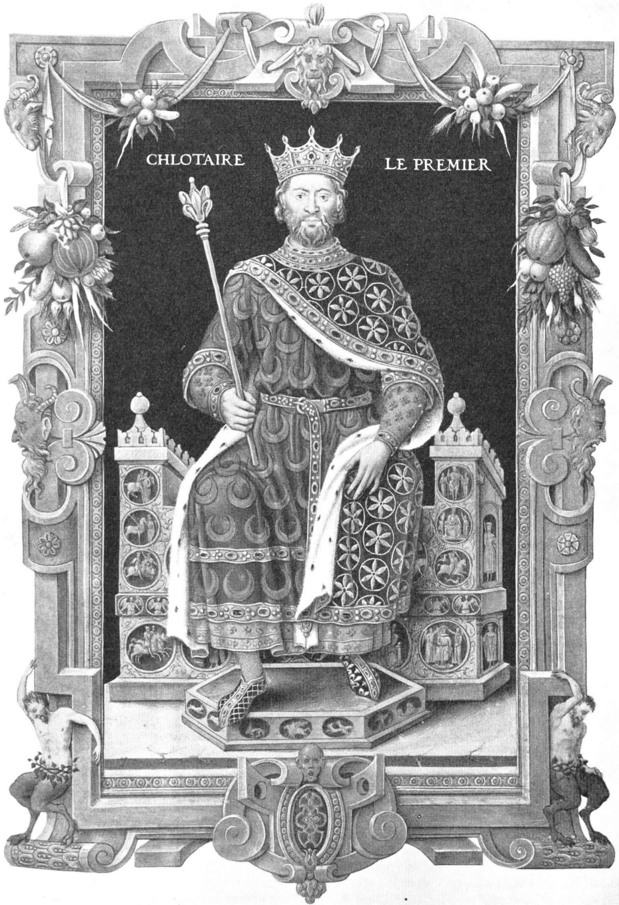
Le roi Clotaire I er († 561) dans le Recueil