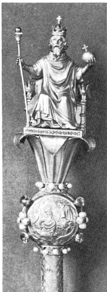
Fig. 9. Haut du sceptre « de Charlemagne » qui est de Charles V.

sceptre (première mention dans l'inventaire de ce roi, † 1380; cf. Pierre Verlet, La galerie d'Apollon et ses trésors , Paris, 1947, p. 19) et qui y mit son saint patron (quoique en réalité Charlemagne ne soit pas saint pour Rome; il fut fait tel par l'antipape Pascal III). Cependant le trône avec ses 2 aigles et ses 2 lions semble inspiré d'une composition faite par Jean II son père (cf. infra). Les rois auront ce sceptre sur les tableaux d'apparat (Louis XIV, XV) mais on trouvera aussi un petit sceptre doré terminé par une double fleur de lis en carré (cf. Félibien qui en donne plusieurs) qu'ils tiendront renversé, lis en bas, comme un vulgaire bâton de commandement, au mépris de la symbolique. Charles X fera de même sur un tableau de Gérard à Versailles (fig. 10), mais reprendra le sceptre de Charlemagne sur le tableau où il est couronné (par Ingres, musée de Bayonne). Il semble que ce soit Henri IV qui ait été responsable de ce petit sceptre, lors de sa commande des regalia pour le sacre de Chartres, les emblèmes normaux étant détenus à Paris par la Ligue.