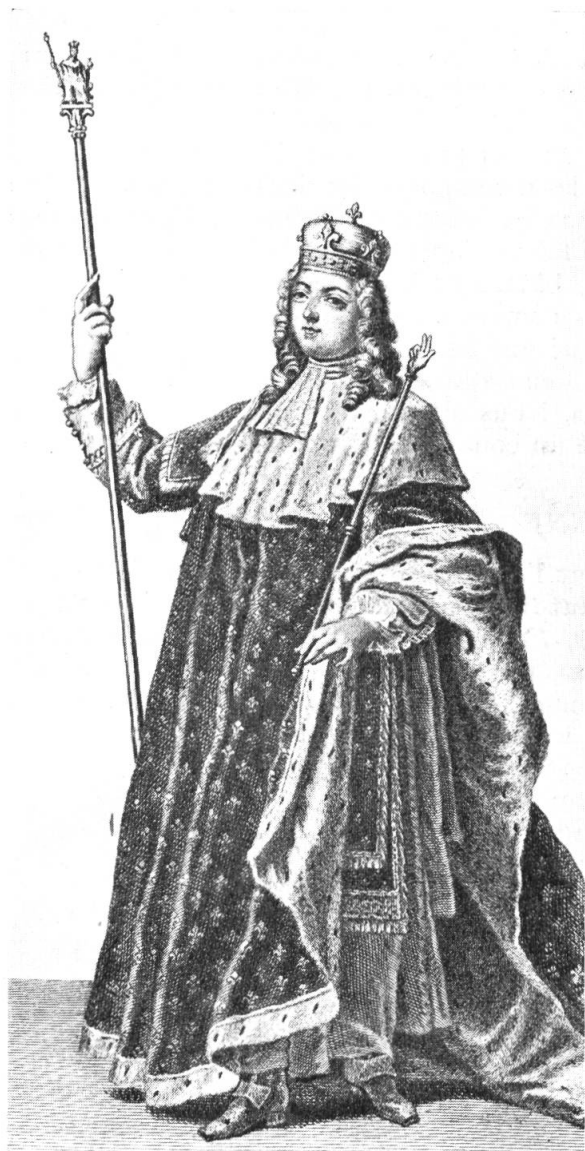
Fig. 8. Louis XV (1722) avec la couronne « de Charlemagne ».