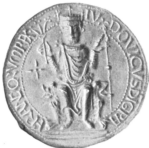
Fig. 3. Sceau de Louis VI, ayant servi de modèle pour le portrait du Recueil .