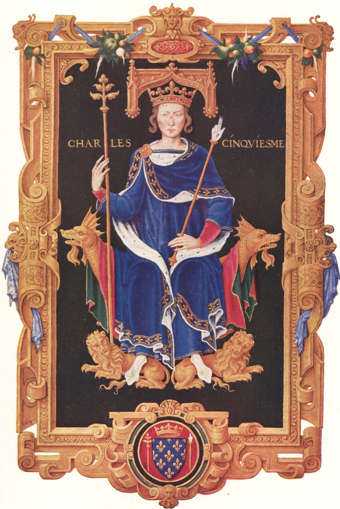
Le roi Charles V († 1380)

dans le Recueil .