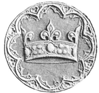
Fig. 6. Couronne sur le sceau des régents, Louis IX étant outre-mer (1270).