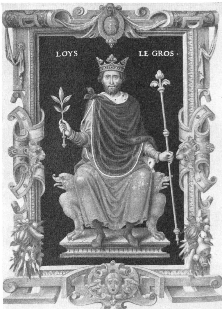
Fig. 4. Le roi Louis VI († 1137) dans le Recueil .

de fleurs de lis. CHARLES II (IM) roi de Jérusalem et de Sicile ; deux compositions : l'une où il est en majesté sur un trône de lions, sceptre et globe crucifère en mains, devant un rideau aux fleurs de lis ; sceau équestre qui est son contre-sceau. LOUIS IX (MS + IM) d'après son sceau de majesté ; le contre-sceau avec la fleur de lis d'or sur azur (premier modèle, celui d'avant 1250). PHILIPPE III (IM) selon le sceau de majesté, le trône fait de têtes de loups. CHARLES comte de Valois (IM) sceau équestre et contre-sceau aux armes. PHILIPPE IV (MS + IM) selon le sceau de majesté ; le contre-sceau est l'écu de France-ancien, sur un champ de gueules orné de lierre vert. LOUIS X (MS + IM) même source ; l'écu du contre-sceau étant posé sur un champ de gueules chargé de 8 escarboucles fermées et pommetées d'or (Navarre) ; la main de justice fait son apparition. PHILIPPE V (MS + IM) même source ; le roi devant une tenture fleurdelisée de France, doublée de violet clair ; contre-sceau analogue. CHARLES IV (MS + IM) même source, sans tenture, mais trône recouvert d'une étoffe fleurdelisée ;