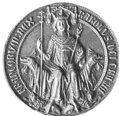
Fig. 5. Sceau de Charles V, ayant servi de modèle pour le portrait du Recueil .