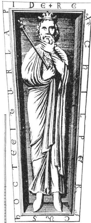
Fig. 1. Tombeaux de Chilperic I er et de Frédégonde, selon Montfaucon. Modèles des portraits du Recueil .

rideaux. CHARLES II (MS + IM) la couronne fermée comme elle était à Saint-Denis, contrairement à Montfaucon et Rabel qui la donnent ouverte (cf. J. Doublet, Histoire de l'abbaye de Saint Denys en France. , Paris, 1625); le globe est normal; son sceptre est comme celui des modèles byzantins inconnus; le fait qu'il fut empereur des Romains est rappelé aussi par des armoiries de sable sur or dans le losangé de la bordure de la dalmatique. L'artiste a donné bien des cheveux pour un chauve! LOUIS II (IM) cadre vide. LOUIS III & CARLOMAN II (IM) cadre vide. CHARLES (n'a pas de n° en France, seul son surnom de Gros) (IM) cadre vide. CHARLES III (MS + IM) d'après sa statue tombale à Saint-Fursy de Péronne; MS donne des rideaux semés de quartefeuilles compliquées alors que IM donne un semé de fleurs de lis pour tout le fond de la composition. RAOUL (MS + IM) d'après sa tombe à Sainte-Colombe de Sens. LOUIS IV (MS + IM) assis en majesté d'après une statue de Saint-Rémi de Reims où il est inhumé; sa dalmatique de clair carmin est semée de motifs d'or d'un genre végétal; le trône est posé sur deux lions. LOTHAIRE