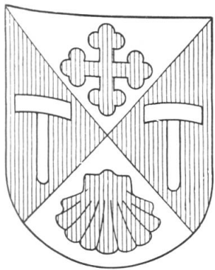
Fig. 4. Armoiries de la Commune de Dorénaz adoptées en 1934.