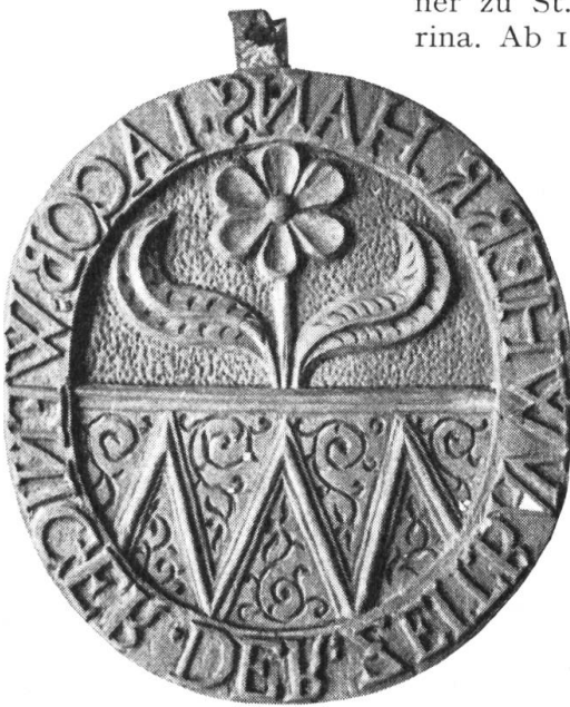
Fig. 23. Ovaler Holzmodel von 10,2 cm Höhe und 9,4 cm Breite. Dicke: 0,6 cm. Zwetschgenbaum. Besitzer: Histor. Museum St. Gallen. Inv. 1663.