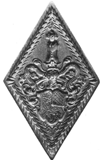
Fig. 24. Rautenförmiger Holzmodel von 20 und 12,5 cm Durchmesser. Revers mit Brandmarke (k). Besitzer: v. Zollikofersches Familienarchiv, Altenklingen.