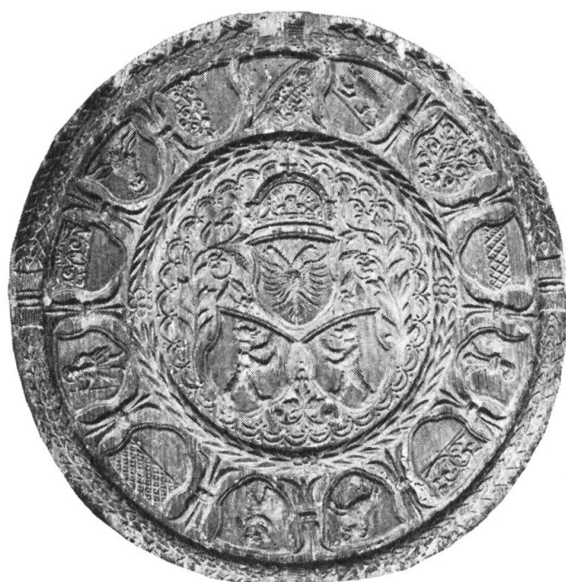
Fig. 1. Runder Holzmodel von 42,3 cm Durchmesser aus Holz, Eiche. Dicke 3,1 cm. Besitzer: Conditorei Pfund, St. Gallen. Brandstempel: (m)

Der Model ist scharf und exakt gestochen, die heraldische Darstellung verrät einen geübten Schnitzer, der dem Stil entsprechend ins 17. Jahrhundert zu datieren wäre.