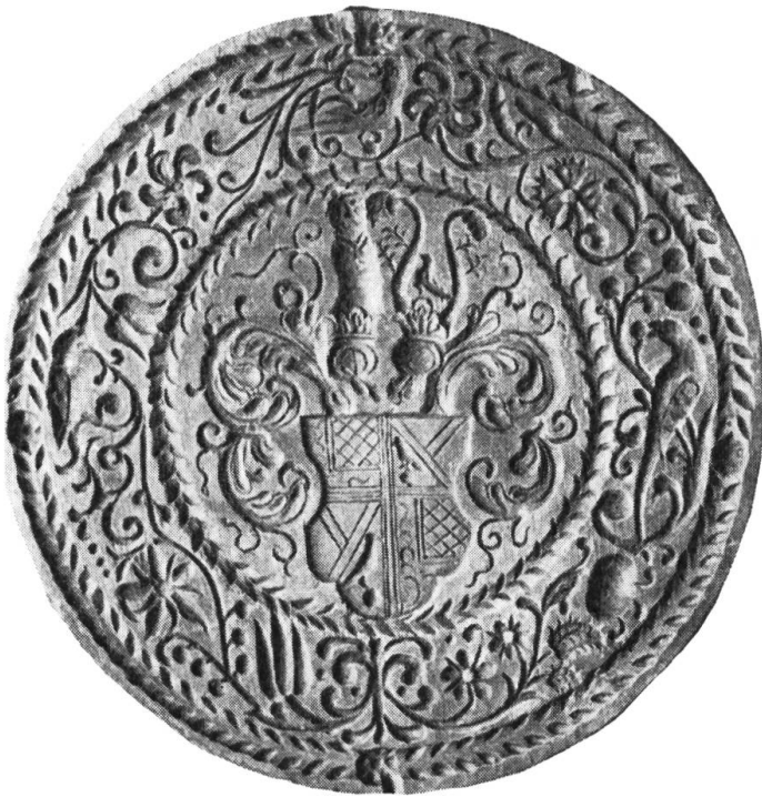
Fig. 25. Runder Holzmodel von 23,5 cm Durchmesser. Dicke: 2,5 cm. Nussbaum. Besitzer: Histor. Museum St. Gallen. Inv. 11 106.