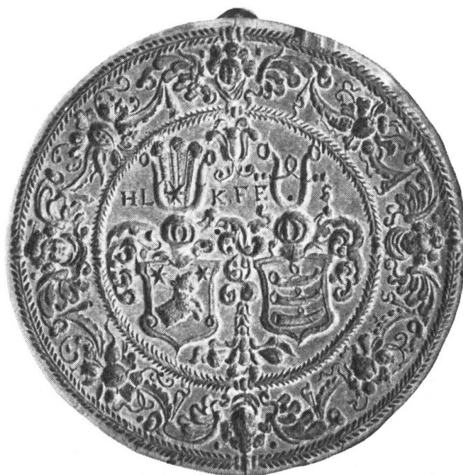
Fig. 14. Runder Holzmodel von 17,5 cm Durchmesser. Dicke: 2,2 cm. Auf dem Revers die Brandmarke (d). Besitzer: Histor. Museum St. Gallen, Inv. 11 103.

Rechts das Wappen der Müller von Zürich: in Gold ein schwarzes Mühlrad mit oben aufgesetztem Kreuz, links dasjenige der Zollikofer: in Gold ein blaues linkes oberes Freiviertel. Als Kleinod wird das der Müller