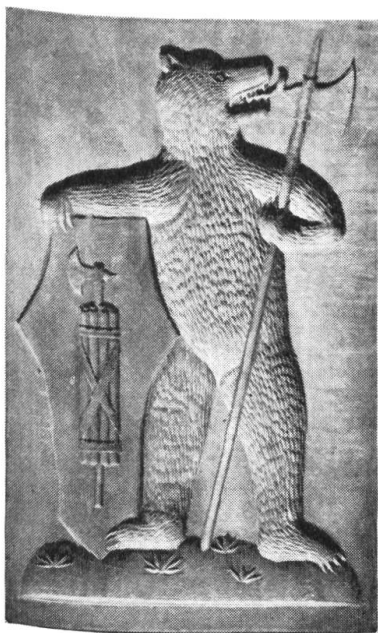
Fig. 6. Rechteckiger Holzmodel von 28,8 cm Höhe und 18,4 cm Breite. Dicke: 2,1 cm. Besitzer: Conditorei Burkart, St. Gallen.

zottiger Bär als Schildhalter und hält einen unförmigen Schild mit reichlich ungekonnt gebildetem Faszsbündel und Beil, das Wappen des Kantons darstellend. Der Model dürfte aus dem Ende des 19. Jahrhunderts stammen.