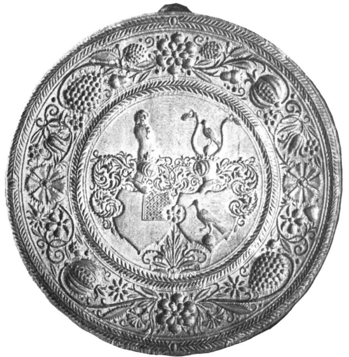
Fig. 26. Runder Holzmodel von 17 cm Durchmesser. Dicke: 2,1 cm. Birnbaum. Auf dem Revers die Brandmarke (l). Besitzer: Histor. Museum St. Gallen. Inv. 11 105.

Da der Model keine Brandstempel trägt, sind wir auf Mutmassungen angewiesen. Er muss nach 1623 entstanden sein, weil die Schobinger in diesem Jahr im Adelsbrief die Wappenvermehrung erhielten :