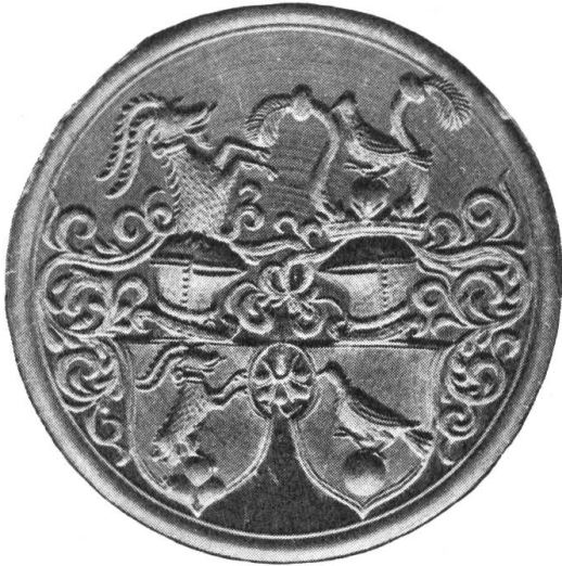
Fig. 8. Runder Holzmodel von 13 cm Durchmesser. Dicke: 2 cm. Revers: Brandmarke (b). Besitzer: v. Fels'sches Familienarchiv, St. Gallen.

Helmzieren. Rein ornamental sind die Decken aufgefasset; der Model ist ein Vertreter der Renaissance-schnitzerei und dürfte um 1596 entstanden sein.