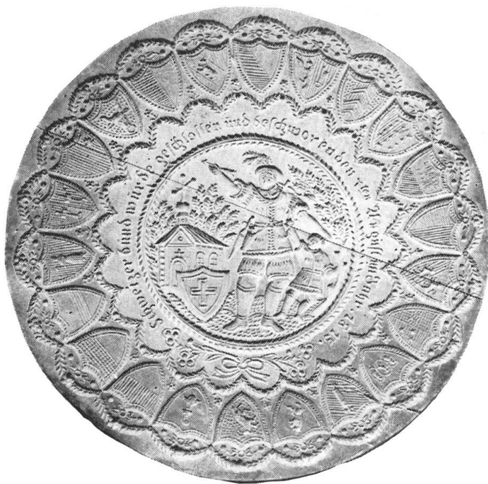
Fig. 5. Holzmodel von 41,5 cm Durchmesser. Dicke 3,8 cm. Besitzer: Conditorei Signer, St. Gallen.