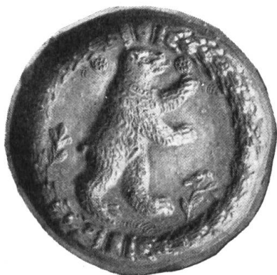
Fig. 2. Runder Tonmodel von 12,3 cm Durchmesser und 1,5 cm Dicke. Auf Revers Prägestempel (a). Besitzer: v. Fels'sches Familienarchiv.

Der kleine Tonmodel zeigt ein durch einen breiten Lorbeerkrantz eingerahmtes Rundfeld, in dem der steigende St. Gallerbär zwischen zwei Kräutlein, das eine von einem Vögelein besetzt, dargestellt ist. Zu Häupten des Bären befinden sich zwei kleine Rundmarken mit einem zentralen und sieben randständigen Punkten. Man ist fast versucht zu glauben, der Zottelbär übe sich im Ballwerfen und fange den einen — wohl aus süssem Gebäck bereitet — mit seinem Maul auf.