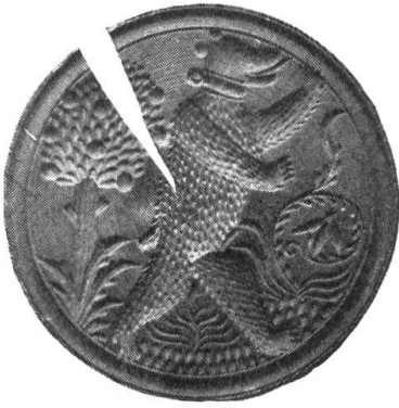
Fig. 3. Runder gesprungener Holzmodel. Besitzer: Tobler, St. Gallen.

Nach der Art der Ausführung dürfte der Model von einem guten Meister des 17. Jahrhunderts gebildet worden sein.