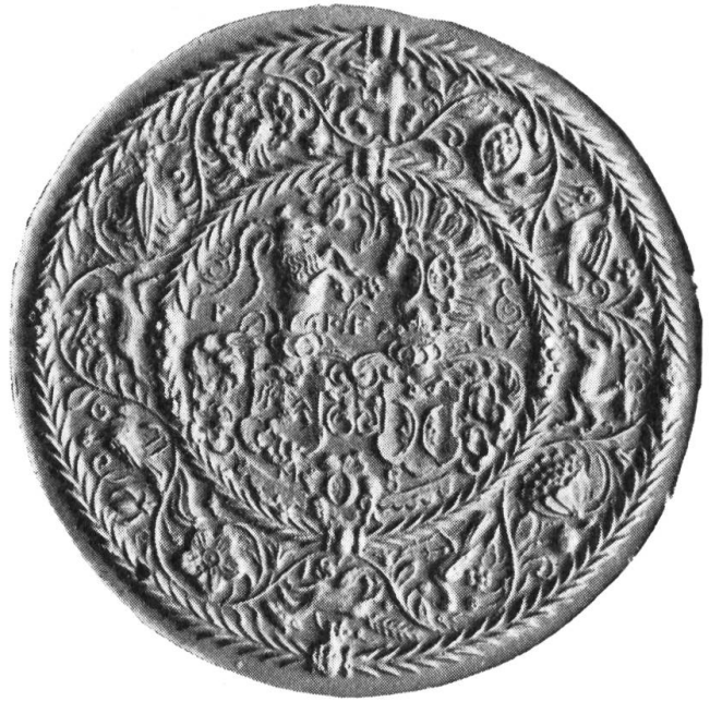
Fig. 10. Runder Model von 17,2 cm Durchmesser, Dicke 2,2 cm, Birnbaum. Besitzer: Gewerbemuseum Zürich, Inv. 830 (2216).

der letzten Jahrzehnte Anzeichen für ein Aufleben der Kabinettsscheiben-Kunst vorhanden zu sein scheinen, so veröffentlichen wir hier absichtlich einen modernen Bibermodel mit dem Allianzwappen des Verfassers und seiner Gemahlin. Das Frauenwappen zeigt: von Rot mit drei Fehpfählen und einem goldenen Schildhaupt mit schwarzem dreilappigem Turnierkragen unter