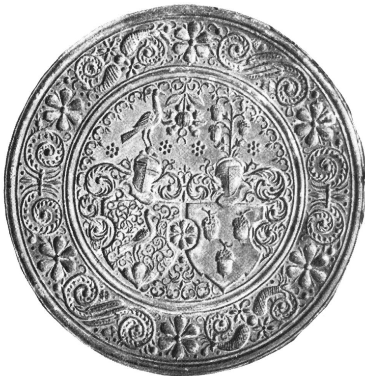
Fig. 17. Runder Holzmodel von 20,5 cm Durchmesser. Birnbaum. Dicke: 3,5 cm. Auf dem Revers eine Besitzermarke mit Tinte (f), daneben: SO klein Model. Besitzer: Histor. Museum St. Gallen, Inv. 11 108.

Sowohl die grobe Wappendarstellung, wie auch die Randverzierung deuten durch ihre Aermlichkeit auf einen nicht sehr talentierten Stecher.