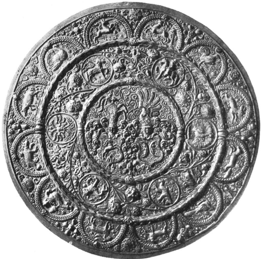
Fig. 9. Runder Model von 42 cm Durchmesser. Dicke: 3,9 cm. Besitzer: Schweizerisches Landesmuseum Inv. 218.

Das äussere Randfeld von 4,5 cm Breite ist durch eine schmale Leiste begrenzt und enthält zwölf Lorbeerhalbbogen mit figürlichen