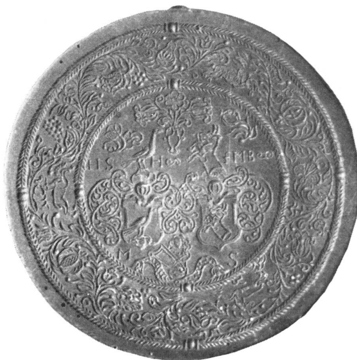
Fig. 13. Runder Holzmodel von 19 cm Durchmesser. Dicke: 3 cm. Birnbaum. Besitzer: Histor. Museum St. Gallen, Inv. II 104.

Der breite Rand enthält eine Blattgirlande, die in den Ausbuchtungen Tiere und Blumen einschliesst; oben