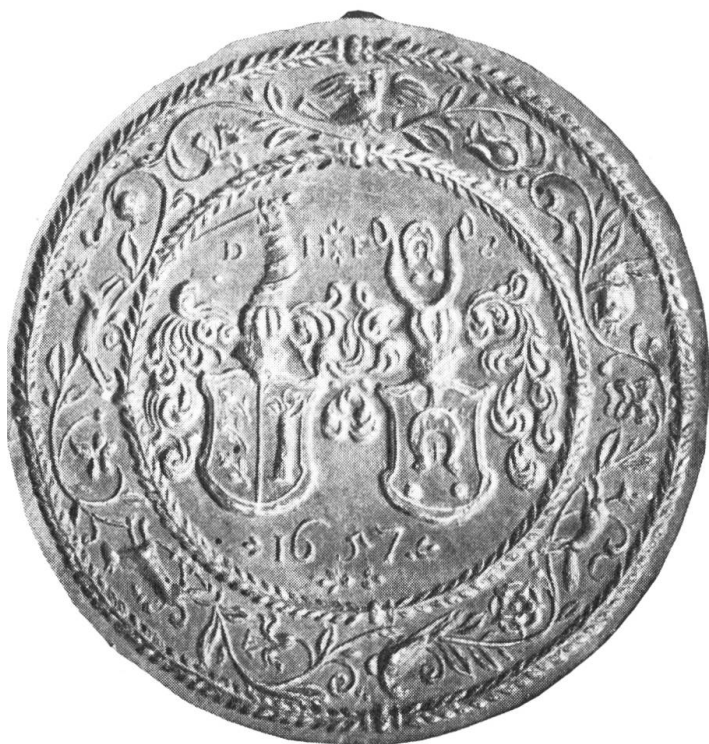
Fig. 12. Runder Holzmodel von 19.5 cm Durchmesser. Dicke: 2 cm. Birnbaum. Auf dem Revers die Brandmarke mit D und H als Besitzstempel des Dominicus Hochreutiner (c). Besitzer: Histor. Museum St. Gallen. Inv. II 101.

ein auffliegender Vogel, im Uhrzeigersinn folgen Tulpe, Hase, Stiefmütterchen, Fuchs, Rose, Vogel, Nelke, Hund, Blume, Hirsch, Granatapfel und Kornblume. Auf der Höhe der Helmzier stehen die Buchstaben DH ES, unter dem Wappen die Jahrzahl 1657.