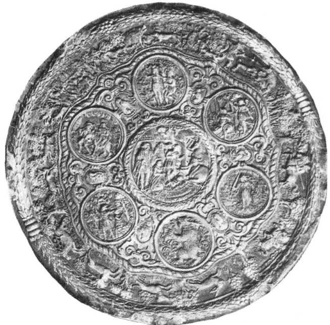
Fig. 4. Runder Holzmodel von 42,7 cm Durchmesser. Dicke 3,5 cm. Besitzer: Conditorei Pfund, St. Gallen.

In einem innern grössern Medaillon mit Lorbeerumrandung, das von sechs münzenförmigen kleineren Bildern umgeben ist, zeigt der Stecher das Christuskind vor dem Stall mit Ochs und Esel, vor ihm die knieende Maria und herbegeeilte Hirten. Die umgebenden Medaillons enthalten biblische Szenen wie Sündenfall, Flucht nach Aegypten, Verkündigung Mariae, Isaaks Opferung und Judith mit dem Haupte des Holofernes. Im untersten Medaillon steht der St. Gallerbär mit Halsband vor einem Weinstock, bereit, sich an den Trauben gütlich zu tun. Die Medaillons werden durch schöne barocke Kartuschen verbunden, die verschiedene Tiere einschliessen. Als erstes erscheint rechts vom Sündenfall eine Taube, die auf einer Kugel steht, was darauf hinweisen dürfte, dass der Model für einen Angehörigen der Familie v. Schobinger gestochen wurde. Im Gegenuhrzeigersinn folgen Eichhorn, Hahn, Affe oder Katze (?), Pelikan und Hase. Die Medaillons umfasst eine stilgerechte Kordel und lässt zwischen ihr und dem abschliessenden Lorbeerkranz einen Rand frei, der durch sich folgende, prachtvoll gestochene Jagdszenen ausgefüllt ist. Zu oberst sehen wir eine Sauhatz, dann folgt im Uhrzeigersinn die Bärenjagd am Waldrand, dem zwei berittene Jäger zueilen, darauf ein Hase, der wie die nachfolgenden beiden Hirsche von Hunden verfolgt wird.