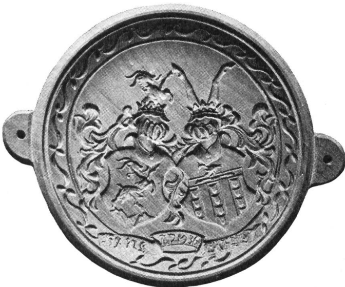
Fig. 11. Runder Holzmodel von 17,5 cm Durchmesser. Lindenholz. Dicke: 2,3 cm. Revers: steigender Steinbock auf zwei Felsen. Besitzer: der Autor.