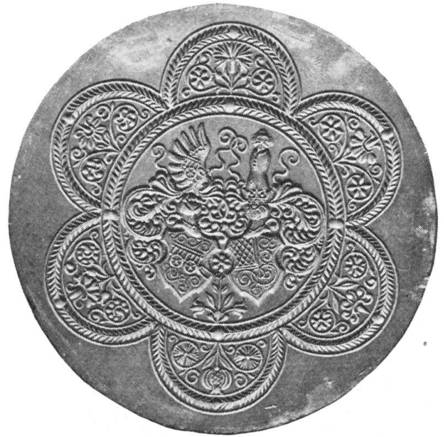
Fig. 22 Runder Holzmodel von 21,5 cm Durchmesser. Dicke: 2,7 cm. Besitzer: v. Zollikofersches Familienarchiv Altenklingen.