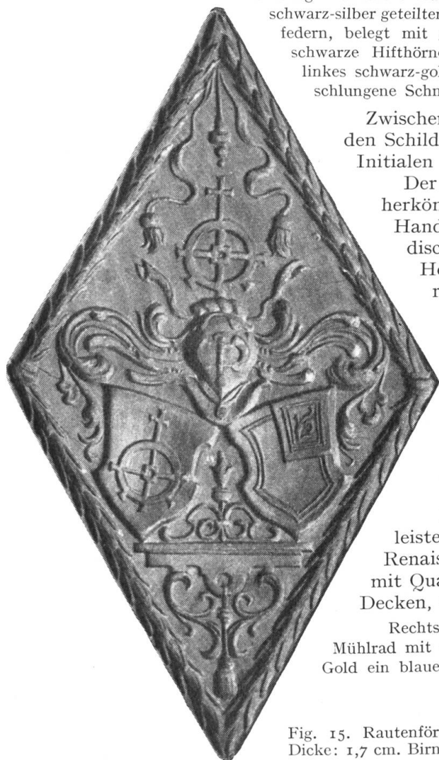
Fig. 15. Rautenförmiger Holzmodel von 17,5 und 10,2 cm Durchmesser. Dicke: 1,7 cm. Birnbaum. Besitzer: Histor. Museum St. Gallen, Inv. 11 110.