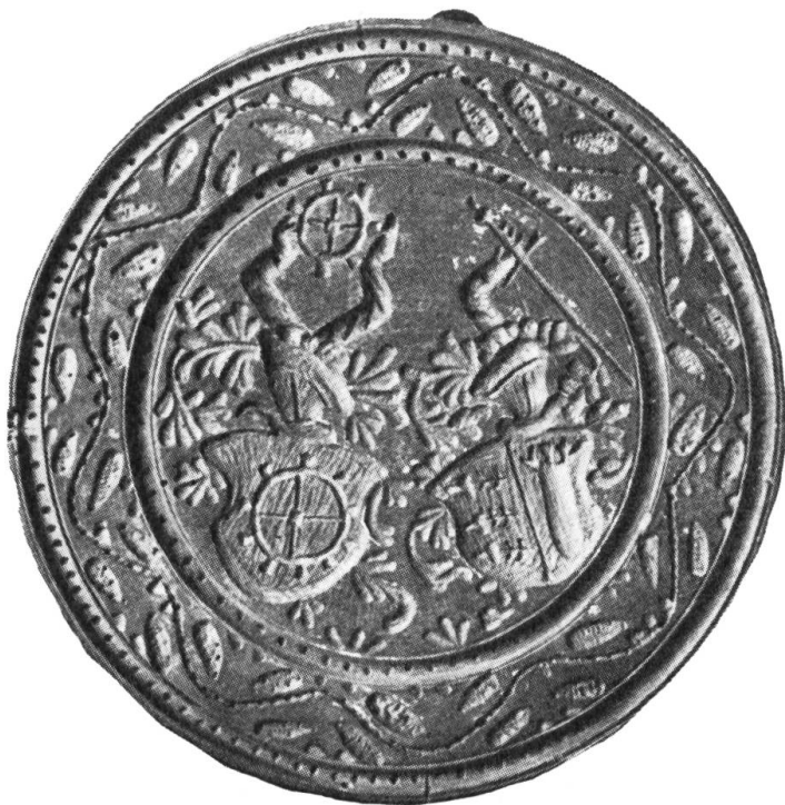
Fig. 16. Runder Holzmodel von 19,5 cm Durchmesser. Birnbaum. Dicke: 2,3 cm. Auf dem Revers die Brandmarke (e). Besitzer: Histor. Museum St. Gallen, Inv. 11 107.

Zudem lässt sich in der Stematologie keine Ehe Müller-Hochreutiner finden, dahingegen eine einzige Verbindung Hochreutiner-Müller. Wir sind geneigt anzunehmen, dass der Stecher die Wappen nicht in der richtigen Courtoisierstellung geschnitzt hat und dass es sich per exclusionem nur um das Ehepaar Ulrich Hochreutiner, 1596-1641, Martha Müller, 1608-1677, Tochter des Hans Ulrich Müller und der Esther Rothmund, handeln kann. Die Ehe wurde 1630 geschlossen.