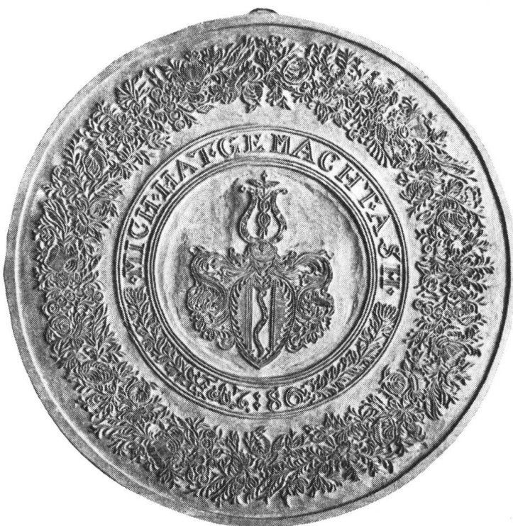
Fig. 18. Holzmodel von 22,5 cm Durchmesser. Dicke: 3,3 cm. Birnbaum. Besitzer: Histor. Museum St. Gallen. Inv. 1930.

Der Model, der offenbar für die Stoffdruckerei st. gallischer Industrie hergestellt wurde, gehört trotzdem in die Reihe der heraldischen Model und ist ein typisches Beispiel der Formschneidekunst hiesiger Indienne-Druckerei des 18. Jahrhunderts.