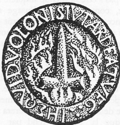
Fig. 1. Cachet agrandi de Guillaume Farel. Diamètre réel : 18 mm.

Dans A.H.S. de 1962 le dessin est différent. A l'intérieur d'un double cercle