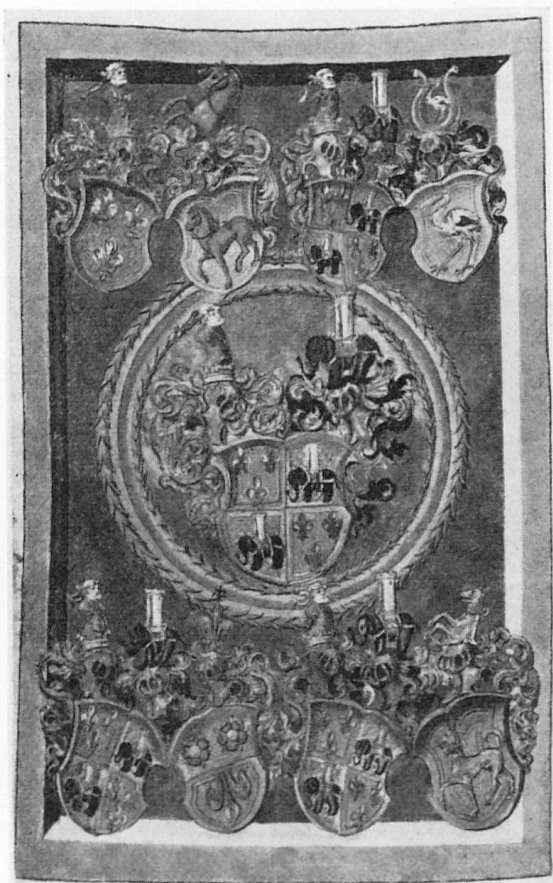
Abb. 2. Urbar von Hilfikon. Die direkten Aszendenten des Ludwig zur Gilgen.

Mitte: Das Vollwappen von Ludwig zur Gilgen, geviert mit Hilfikon, umgeben von einem grünen Kranzornament. W: wie Tafel I, auch mit w. Turm. Zur Gilgen