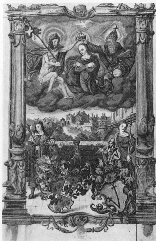
Abb. 4. Urbar von Hilfikon Alliance-Wappen zur Gilgen-Marti.