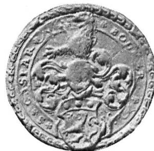
Fig. 25. Caspar Bodmer

10. CASPAR BODMER : cf. n o 7 ci-dessus. Diamètre 34 mm.