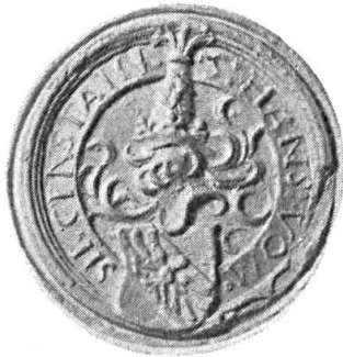
Fig. 1. Hans von Sirgenstein

pyramidal aux armes de l'écu, retroussé d'hermine, couronné d'or, sommé de trois plumes d'autruche, une de sable entre deux d'argent. Diamètre 30 mm.