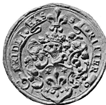
Fig. 20. Fridli Hässi

3. FRIDLI HÄSSI, RITTER 20 : d'azur à la fleur de lis d'or accompagnée de quatre étoiles du même . Casque couronné. Cimier : une fleur de lis d'or. Cire rouge, diamètre 40 mm.