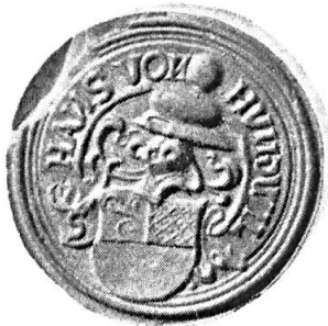
Fig. 9. Hans von Hundwil

10. HANS VON HUNDWIL 6 : coupé au 1 parti d'azur et d'argent, au 2 d'or . Cimier : un chapeau de tournoi d'azur, retroussé d'argent, supportant une boule de gueules. Diamètre 29 mm.