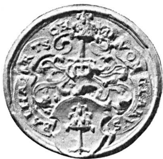
Fig. 21. Balthasar Tschudi

couronné. Cimier : le meuble de l'écu. Diamètre 32 mm.