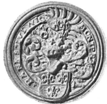
Fig. 6. Hans-Ludwig Montprat

6. HANNS-LUDWIG MONTPRAT: cf. sous n° 2. Diamètre 33 mm.