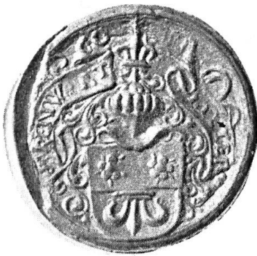
Fig. 8. Renwart Göldlin

8. RENWART GÖLDLI RITTER 5 : cf. sous n o 3. Diamètre 35 mm.