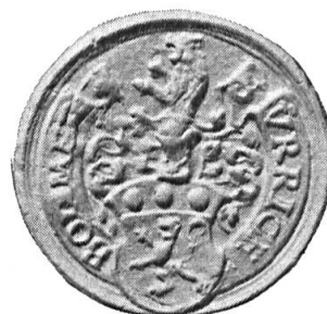
Fig. 24. Urrich Bodmer

9. URRICH BODMER : cf. n o 7 ci-dessus. Diamètre 30 mm.