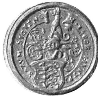
Fig. 5. Jacob Hundpis

5. JACOB HUNTPIS ZUM SIGKEN: de sable à trois lévriers courants d'argent . Casque couronné. Cimier: un lévrier assis d'argent. Diamètre 31 mm.