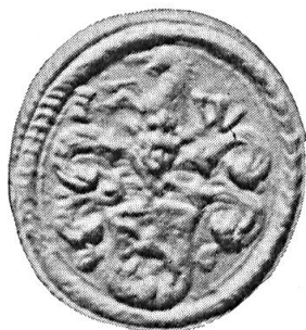
Fig. 27. Hans Waser

5. HANS WASER 24 . : de gueules à la licorne d'argent . Casque non couronné. Cimier : une licorne issante d'argent accompagnée des initiales I.W. Diamètre 15 mm.