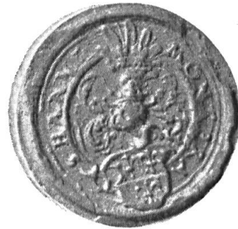
Fig. 15. Hans Montprat

6. HANNS MONTPRAT : cf. premier contrat n o 2. Diamètre 30 mm.