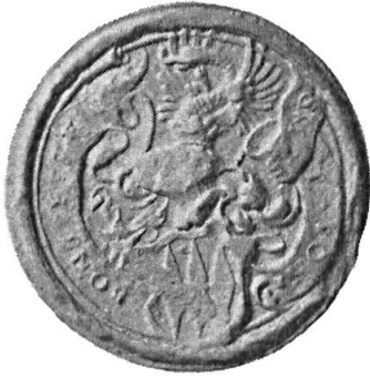
Fig. 11. Jost von Bonstetten