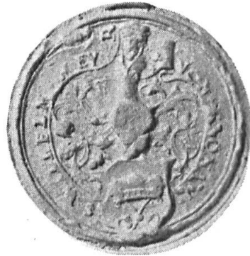
Fig. 14. Wilhelm Meyer von Knonau

5. WILHELM MEYER VON KNONAU 12 : de gueules à un bonnet de président d'argent, retroussé d'hermine, les cordons d'argent terminés en houpettes et passés en sautoir. Casque couronné. Cimier : un buste d'homme barbu, habillé de gueules, coiffé d'un mortier de gueules, retroussé d'hermine, les cordons d'argent, terminés en houpettes et passés en sautoir sur sa poitrine. Diamètre 34 mm.