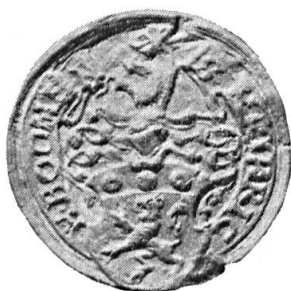
Fig. 22. Heinrich Bodmer

7. HEINRICH BODMER 22 : d'or au lion de gueules, au chef de sable chargé de trois besants d'argent . Casque non couronné. Cimier : un lion issant de gueules. Diamètre 35 mm.