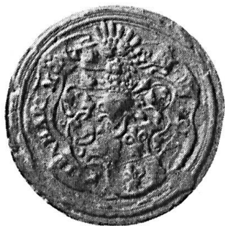
Fig. 17. Linhart Montprat

8. LINHART MONTPRAT 14 : cf. premier contrat n o 2. Diamètre 33 mm.