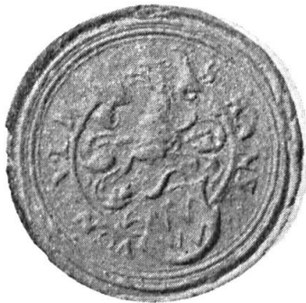
Fig. 12. Hans von Ulm

3. HANS VON ULM : coupé de gueules sur azur, à la fasce brochante vivrée d'argent. Cimier : une tête et col de griffon aux armes de l'écu. Diamètre 32 mm.