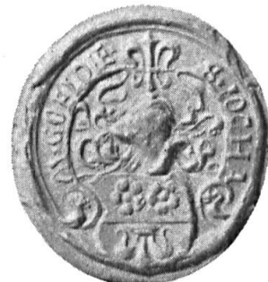
Fig. 16. Joachim Göldlin

7. JOACHIM GÖLDLE 13 : cf. premier contrat n o 3. Diamètre 31 mm.