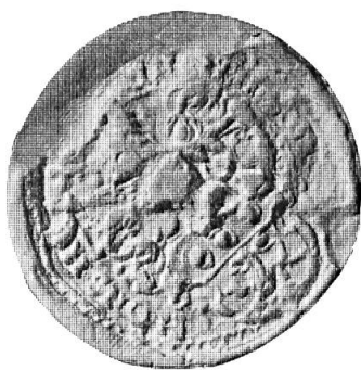
Fig. 26. Balthasar Bodmer

2. HEINRICH BODMER : cf. troisième contrat n° 7.