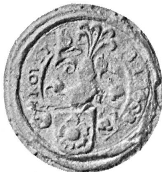
Fig. 13. Jacob Roust

4. JACOB ROUST 11 : d'azur à la rose d'argent. Casque non couronné. Cimier : cinq plumes d'autruche, deux d'argent entre trois d'azur. Diamètre 32 mm.