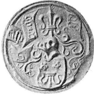
Fig. 7. Caspar Göldlin