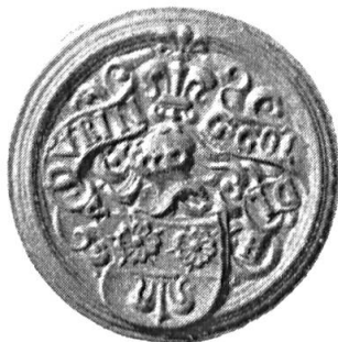
Fig. 3. Thuring Göldlin

3. DÜRING GÖLDLE: coupé d'argent à deux roses de gueules, et, de gueules à la fleur de lis au pied nourri renversée d'argent, mouvant du trait du coupé . Casque non couronné. Cimier: une fleur de lis d'argent, sommée d'une touffe de plumes de coq de sable. Diamètre 31 mm.