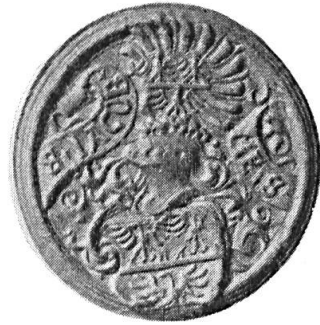
Fig. 10. Jacob Meis

8. RENWART GÖLDLI RITTER 5 : cf. sous n o 3. Diamètre 35 mm.