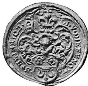
Fig. 19. Heinrich Göldlin von Tiefenau

2. HEINRICH GÖLDLI VON DIFFENOW 19 : cf. premier contrat n o 3. Diamètre 35 mm.