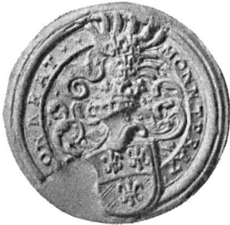
Fig. 2. Conrad Montprat

2. CONNRAT MONNTPRAT: coupé de sable et d'argent, à trois fleurs de lis de l'un à l'autre (2.1), casque couronné. Cimier: un demi-vol aux armes de l'écu. Diamètre 32 mm.