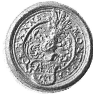
Fig. 4. Hans Montprat

4. HANNS MONTPRAT: cf. sous n° 2. Diamètre 30 mm.