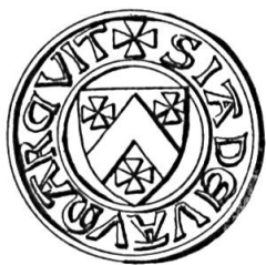
Fig. 14. Sceau de Jacques de Vaumarcus (1377.).

Le cas le plus caractéristique de ce type de changement d'armoiries est celui de Pierre de Vaumarcus : en 1309, à peu près ruiné, il vendit sa seigneurie au