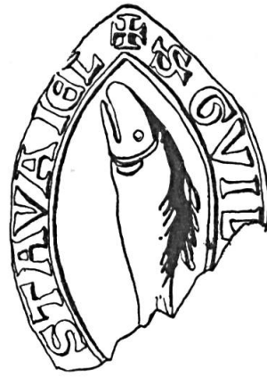
Fig. 2. Sceau de Guillaume II, s. d'Estavayer (1230).

A côté de ces rares sceaux équestres, les plus anciens sceaux des dynastes de Suisse romande portent des figures sans aucun écu. La plupart de ces figures sont un rappel du nom 8 ou de la situation 9 du fief principal. On trouve naturellement plusieurs lions 10 , symbole chrétien fréquent à l'époque 11 et deux aigles 12 qui paraissent rappeler une fonction ou tout au moins un lien impérial 13 . Enfin, les sires d'Aubonne ont utilisé un croissant avec deux étoiles 14 .