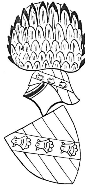
Fig. 7. Othon de Grandson (Arm. du héraut Gelre, vers 1380).

— Salenove et Viry (palé d'argent et d'azur, à la bande de gueules brochante) 37 .