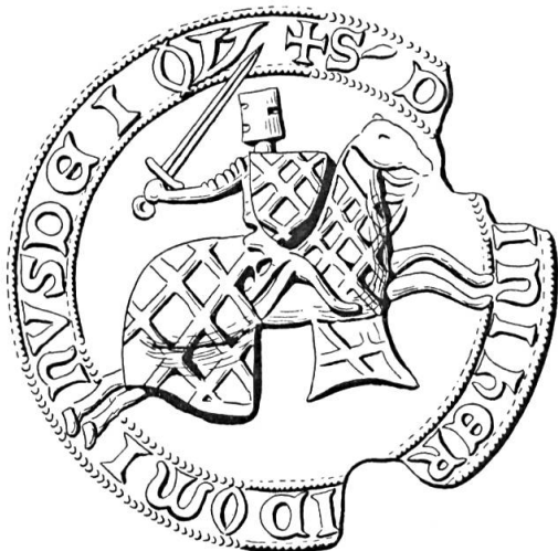
Fig. 12. Sceau d'Henri, s. de Joux, chev. (1265).

Ne se rattachent à aucun groupe que les comtes de Genève pour leur écu principal 75 , les sires de Joux 76 et ceux de Vuillens 77 , à peine un dixième des maisons de dynastes de Suisse romande : proportion vraiment très faible.