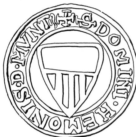
Fig. 5. Sceau d'Aymon, s. de Montagny (1239).

— Montagny (palé d'or et de gueules, au chef d'argent) 27 ,