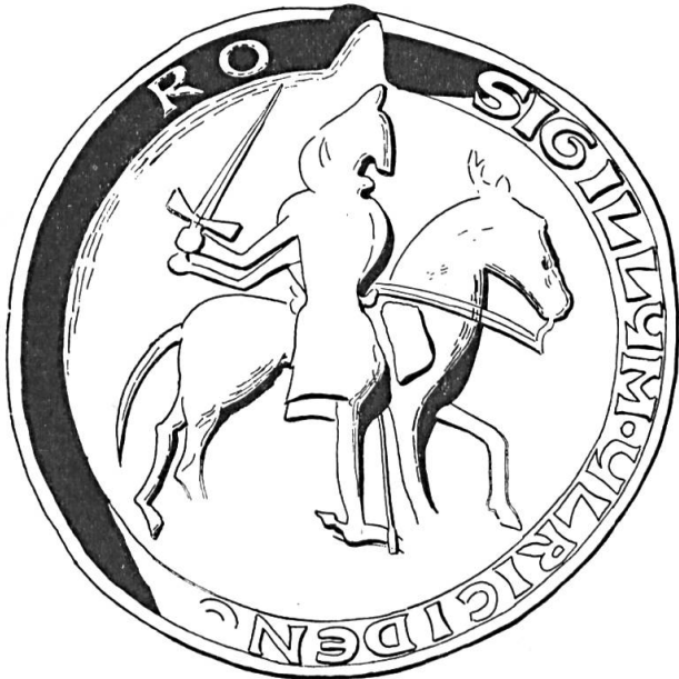
Fig. 1. Sceau d'Ulrich II, s. de Neuchâtel (1182-1191).

Souverains et dynastes ont utilisé des sceaux portraits qui, au cours du XI e siècle se sont cristallisés en deux types principaux, sceaux de majesté et sceaux équestres. Excepté les comtes de Savoie et ceux de Genevois, les dynastes de Suisse romande n'ayant ni grande puissance, ni gros moyens, n'utiliseront que peu de sceaux équestres. Ces sceaux équestres ne se trouvent qu'entre 1180 et 1250 (Neuchâtel 6 , Estavayer, Belmont, Prangins), entre 1270 et 1300 (Aubonne), puis au milieu du XIV e siècle (Neuchâtel, Arberg, Grandson 7 ).