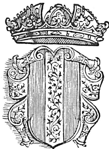
Fig. 13. Armes de Rodolphe, roi de Bourgogne ( Chronique de Stumpf , 1584).

Sans grand risque d'erreur, on peut penser que la plupart des écus du groupe à la croix dérivent de la bannière de Savoie 78bis et ceux du groupe à la bande de la bannière du comté de Bourgogne. Pour le groupe aux pals, on en arrive à se demander, puisqu'il est répandu sur-