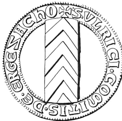
Fig. 4. Sceau d'Ulrich, s. d'Arberg (1256).

— Neuchâtel (d'or à 3 pals de gueules chevronsés d'argent puis un seul pal chargé de 3 chevrons), avec ses branches de Nidau, Arberg, Valangin (de gueules au pal d'or chargé de 3 chevrons de sable) et de Strasberg (pal d'argent) 25 ,