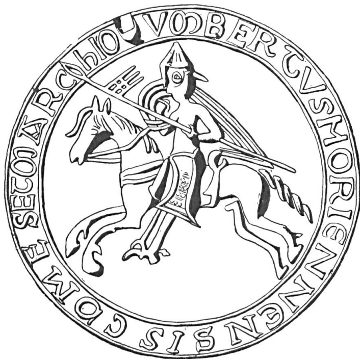
Fig. 10. Sceau d'Humbert III, c. de Savoie (1150).

— le groupe à la croix, bannière puis écu des comtes de Savoie 52 , dans lequel figurent les seigneurs de Mont 53 , d'Ar-