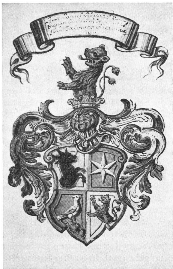
Abb. 6. Högger von Bignan, Barone von Coppet.