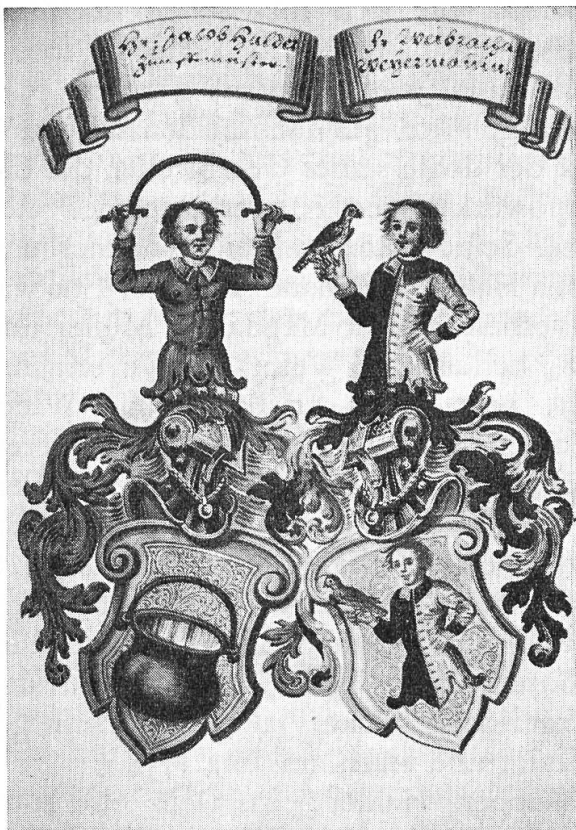
Abb. 2. Halder. Weyermann.

Mit diesem sorgfältig ausgeführten Blatt hat der fünfte Maler des Bandes sein Werk begonnen. Er pflegt sehr naturalistisch das Detail, z.B. beim Fell