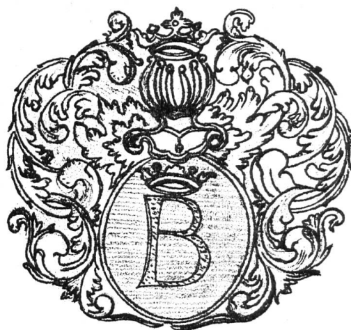
Fig. 3. Armoiries gravées, fin XVII e siècle.