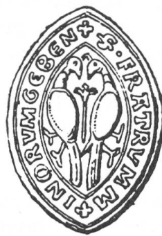
Fig. 1. Sceau du Couvent de Rive.

Utilisé de 1304 à 1525. Sceau en navette, env. 35 mm×25 mm. Deux oiseaux adossés, les têtes contournées, picorant une fleur qui les sépare. Légende en exergue, entre deux traits: ·S· FRATRVM M+INORVM GEBEN+ ( Sigillum fratrum minorum gebennensium. ) AEG, PH 147, 12 décembre 1304. Cire brune. AEG, PH 231, 11 avril 1342, cire verte foncée. AEG, Rive, grosse 16, f. 93, 3 juillet 1525. Plaqué, cire sous papier. Voir figure 1. (Dessin illustrant l'article de Choisy.)