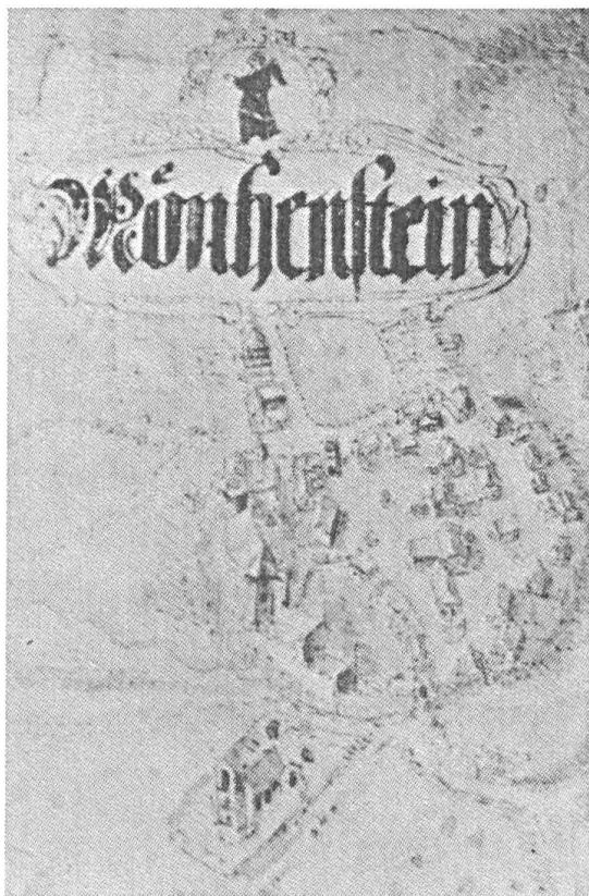
Abb. 4. Eine der bezaubernden Miniaturen aus einer Landkarte des Georg Friedrich Meyer. Ausschnitt Münchenstein.

humorvoll vorgetragene Anekdoten aus der Basler Landschaft. Dr. Clottu ehrt mit den zur Tradition gewordenen Versen unsere Damen. Fröhlich und müde zugleich freut man sich schliesslich auf die vier, vom Organisator der diesjährigen Tagung für den bevorstehenden Tag ausgewählten Sehenswürdigkeiten.