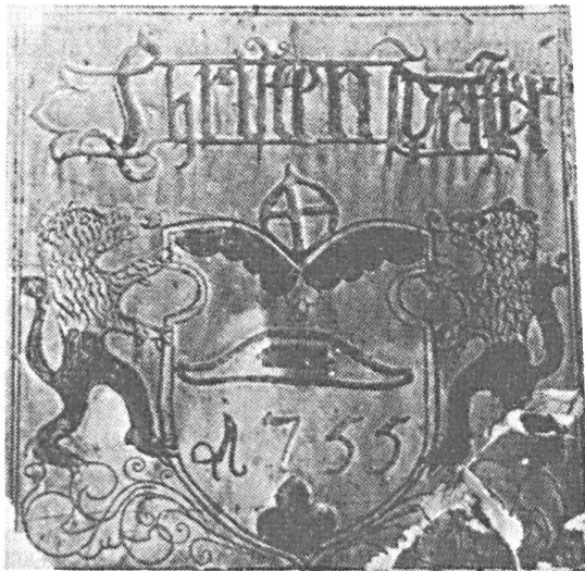
Abb. 6. Eine der heraldischen Ofenkacheln im Kantonsmuseum Liestal. Das Weberschiffchen ist eine relativ seltene Wappenfigur.