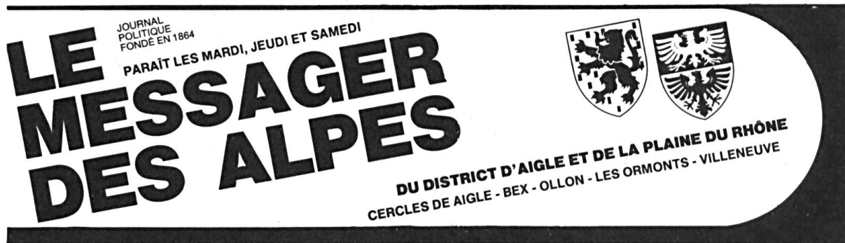
Fig. 4. Messenger des Alpes, 1982.

L'inclusion, dès août 1982, des armoiries du Chablais dans la bande-titre du journal local Le Messenger des Alpes , a été un moment important de la diffusion de ce blason (fig. 4).