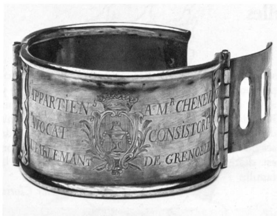
Fig. 1 Collier de chien aux armes Chenevaz.

En dépit de quelques inhabilités et d'une faute d'orthographe dans l'inscription, le dessin des armoiries est assez bien venu; le style en est typiquement Louis XVI, et connaissant la date approximative de la nomination de Charles-François CHENEVAZ au poste d'avocat consistorial, on peut dater ce collier du dernier quart du XVIII e siècle. La famille CHENEVAZ figure à l'Armorial des Généralités de 1696 (Dauphiné, p. 84 et 406): Isabeau CHENEVAZ veuve de J. B. LIOU avocat au Parlement de Dauphiné porte: «d'argent à un chêne arraché et couché sur une motte le tout de sinople, les racines à dextre et le feuillage à sénestre.» Armes parlantes, le chêne évoquant le nom du titulaire, mais esthétiquement et héraldiquement médiocres; peut-être composition fantaisiste des commis de d'HOZIER comme ils en produisirent tant (Fig. 2).