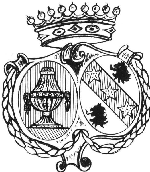
Fig. 3 Chenevaz-Broal.

Marié en 1770 avec sa cousine Benoite BROAL, il voisinait rue des Vieux-Jésuites avec son collègue au Parlement Chérubin BEYLE, père du futur écrivain STENDHAL. Sa notoriété lui valut vers 1780 d'être nommé «consistorial» ce qui correspondrait de nos jours à membre du Conseil de l'Ordre des Avocats.