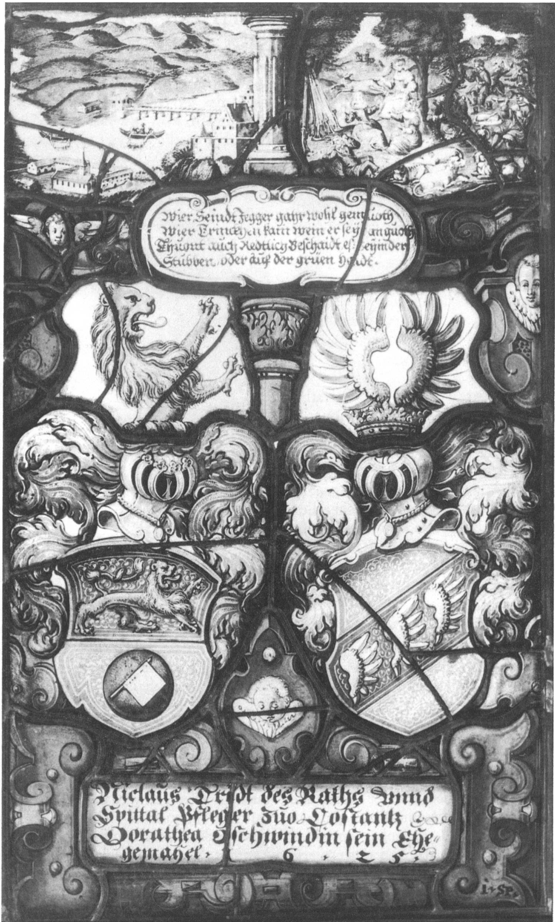
Abb. 2 Allianzscheibe des Niclaus Tridt (Tritt) und der Dorothea Gschwind von Konstanz 1625 mit dem Fuchsmotiv im Oberlicht (vgl. Lit. Nr. 1).