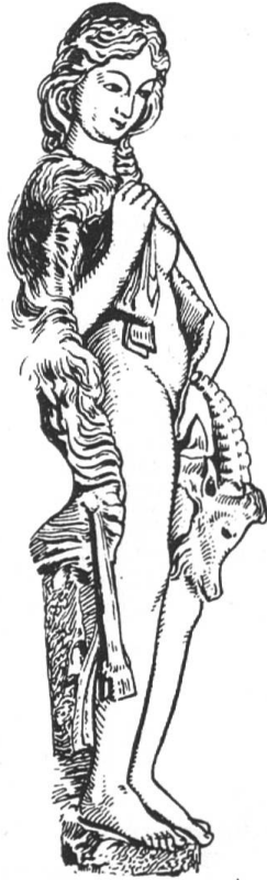
Abb. 5 Frauengestalt mit Widderfell, Münster Freiburg im Breisgau.

chen hat der Fuchs seinen Platz gewechselt, schmiegt sich nun an den Hals der Nackten, die wohl ermattet, nicht aber erschöpft, noch zweifelnd in einer zukünftig grosse Freude verheissenden Landschaft liegt. Landschaft und Himmel versprechen besseres als nur Defloration (pucelage = Virginität). Der Zufall, der uns das Bild von Gauguin zugetragen hat, scheint unsere These 1 zu bestätigen: Es handelt sich bei dem bisher nie untersuchten Motiv 5 um eine erotische Darstellung, die Eingang in die Heraldik gefunden hat, und nicht um irgendeine Darstellung eines Ritterspiels, wie Ignoranten voreilig vorwegnahmen 6,7 .