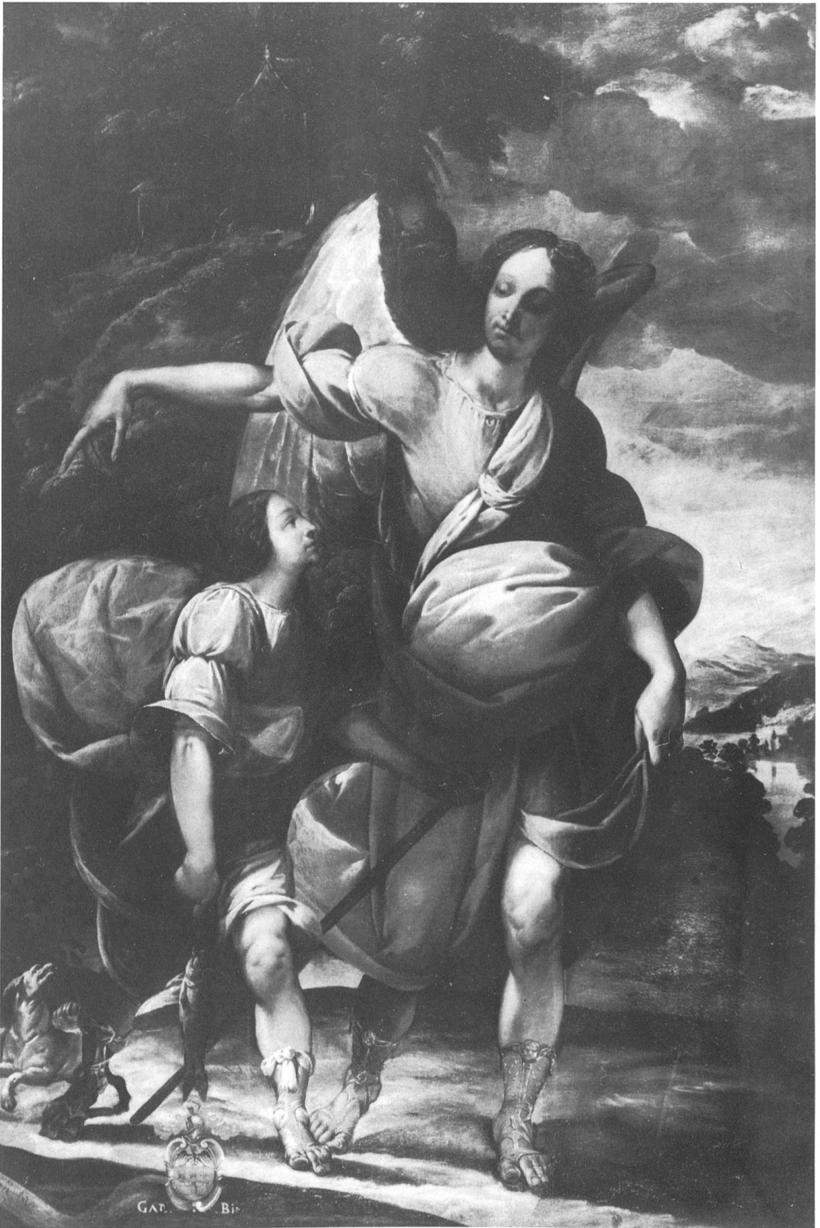
Fig. 2 Antonio Mottino. L'Arcangelo Raffaele con Tobolo . Primi decenni del Seicento. Dopo il restauro.