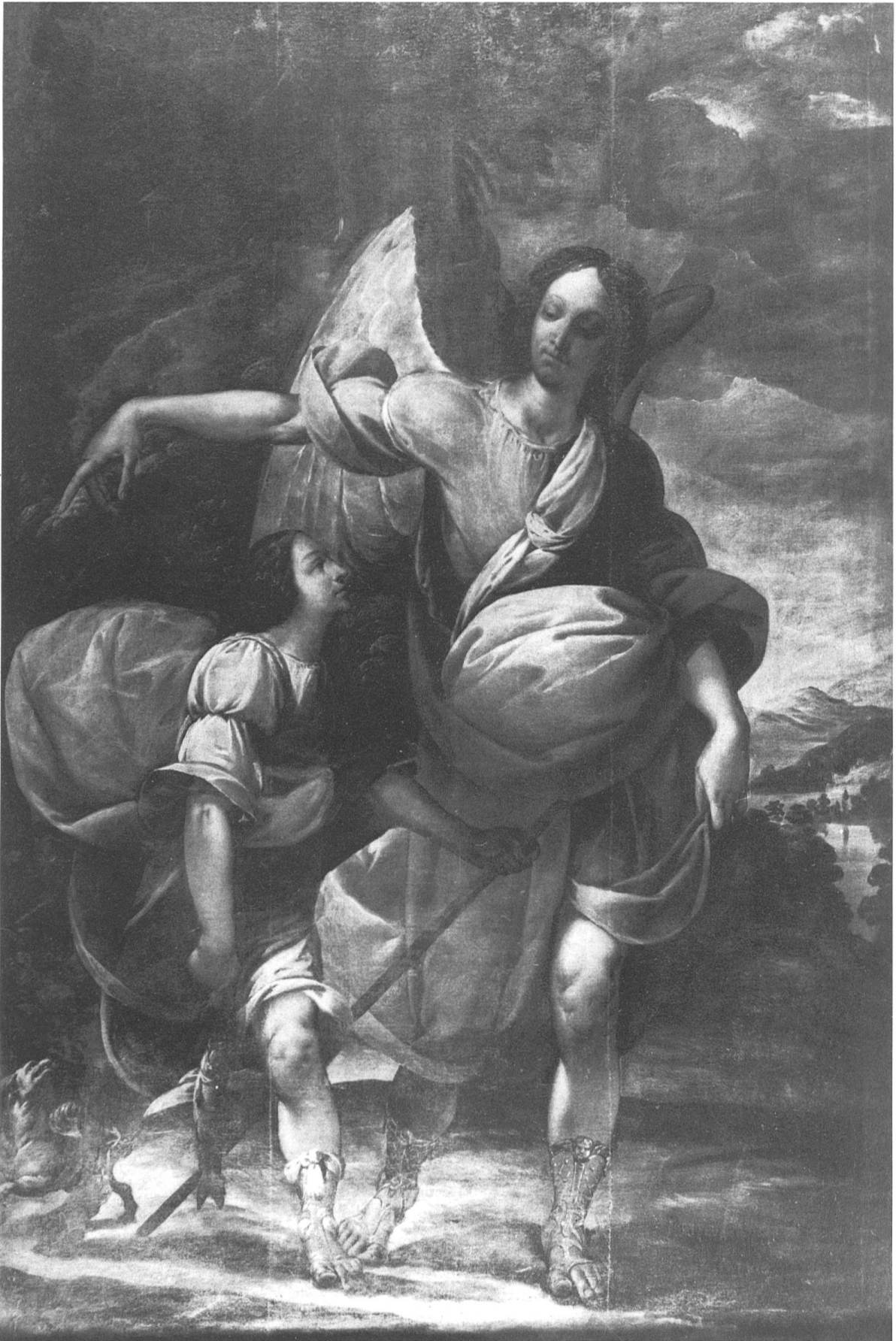
Fig. 1 Antonio Mottino. L'Arcangelo Raffaele con Tobolo . Primi decenni del Seicento. Prima del restauro.