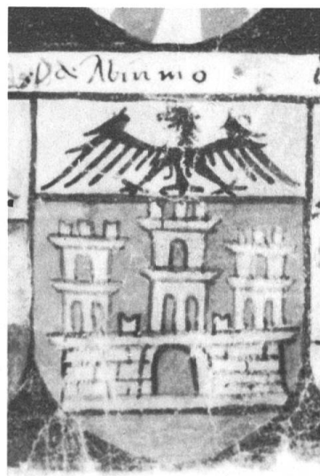
Fig. 4 Stemma della famiglia BIUMI di Varese: «Da Abiumo». Codice Carpani, sec. XV, Museo Civico Como. Cfr. nota 5.