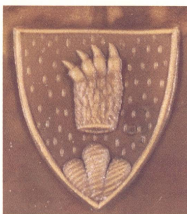
Abb. 9 Wappen 4 des Rudolf Franz Bruhin (1991).