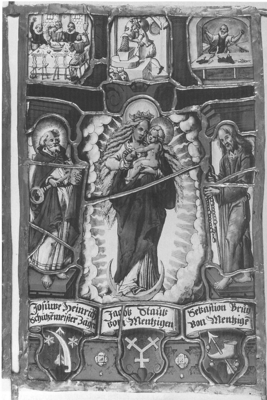
Abb. 5 Wappen 8 des Sebastian Bruy von Menzingen in einer Bildscheibe der Staatlichen Ermitage St. Petersburg.

Die Blasonierung des Wappens Bruys lautet (nach Bélinsky ): armes d'azur à la houssette d'or traversée par une flèche d'argent, posé sur un mont à trois copeaux de sinople; tous les écus damasquinés (auf Blau [damasziert] ein goldener, durch einen silbernen Pfeil durchbohrter Spo-