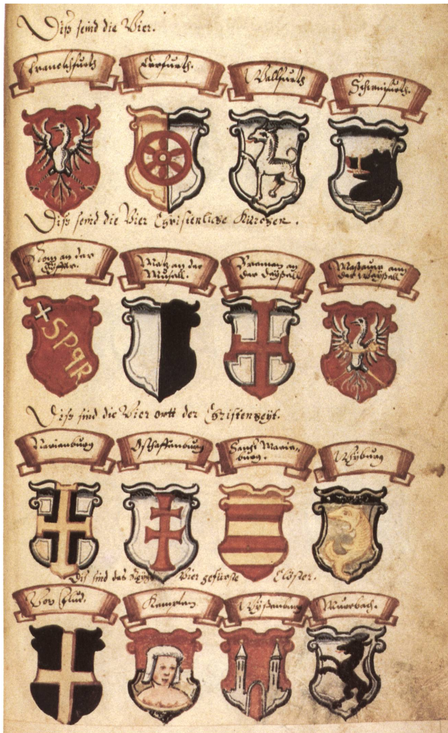
Abb. 2b Städte, Kirchen und Klöster werden anhand ihrer Wappen aufgezählt. Die Grösse des Reiches – von Rom bis nach Bremen – von der Weisser bis nach Murbach – wird sichtbar.