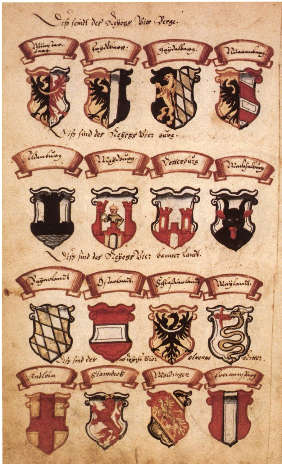
Abb. 2a Reichsämtler und -teile werden mittels Wappen dargestellt.