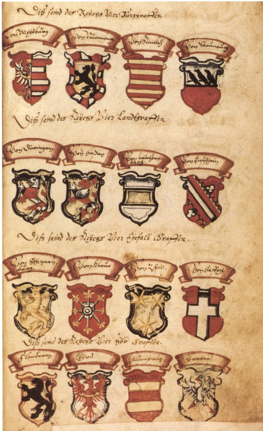
Abb. 1 Eine für das Spätmittelalter typische Darstellung hoher Reichsämtler anhand sogenannter Quaternionen (Fol. 32r).