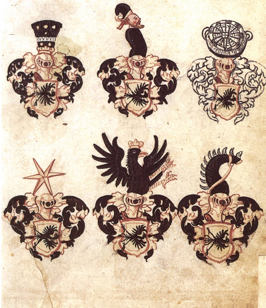
Abb. 3a/b Eptinger Wappen (Fol. 37r/37v).

Die zu Kreigere Von Eplingen hat der Stam Von Eplingen all getson fuesren. Vero sie noes außt Heüts disen tag. Vund datum Anno 7. zum dem Namen Gottes, elliche fuesren tsüent. aües so lang Gott der Allmechtig will der den abgangnen barmherzig sein wölle, vund disen auch damit Amer. so noes leben.