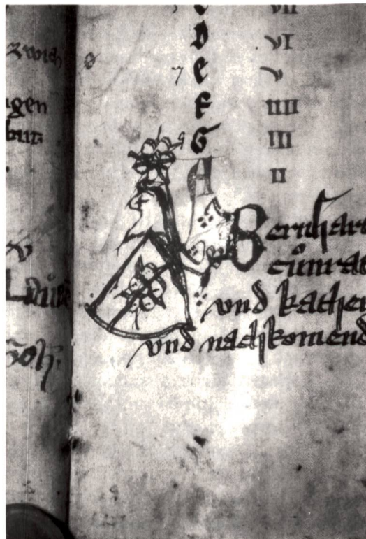
Wappen von Hagenau