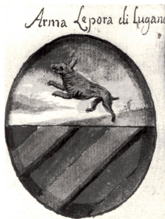
Fig. 4. Arma della famiglia LEPORI figurante nello stemmario Bosisio.

Stemmario Archinto, vol. I per «De Lepora»: campo di cielo, alla lepre con la testa rivoltata e corrente sopra un terreno erroso, il tutto al naturale, sormontata da un'aquila di nero, linguata di rosso, coronata d'oro.