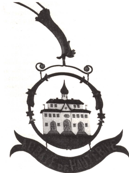
Fig. 7. L'originale insegna dell'albergo Hauterive a Romont (Glâne) del principio secolo con la sua dominante abbazia ci invita varcando la soglia, magari ostentando una guida gastronomica, a guardare quest'oscillante richiamo e il nostro pensiero, con un pò di fantasia, può mutare quelle mura di latta in maestose e possenti muraglie al cui battente del portone bussavano viadanti, pellegrini, armigeri in cerca di quelle mani caritatevoli pronte a dare un pasto, un giaciglio o una benda per lenire le ferite. È una delle tante pagine di piccola storia di ieri: è la nostra storia.