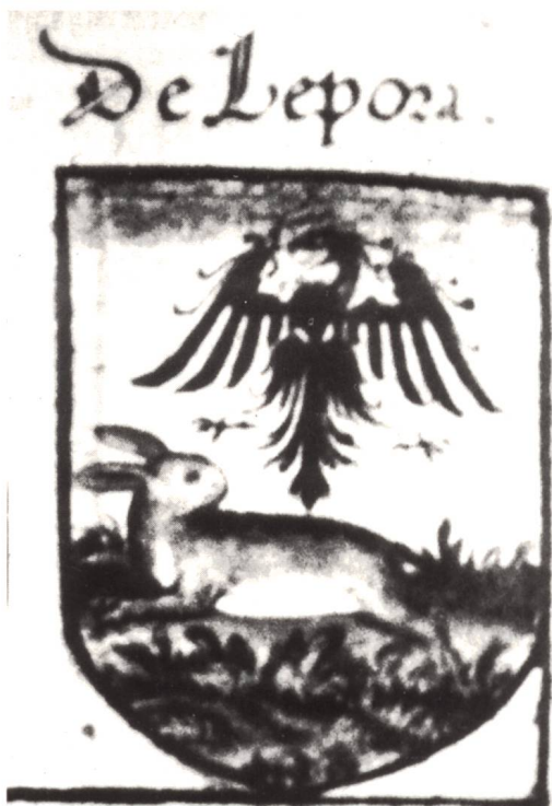
Fig. 5. Stemma gentilizio LEPORI in Archinto vol. I.

Il terzo quarto reca lo stemma dell'antica famiglia feudale DE GLÂNE dond'uscì Guglielmo fondatore dell'abbazia di Hauterive.