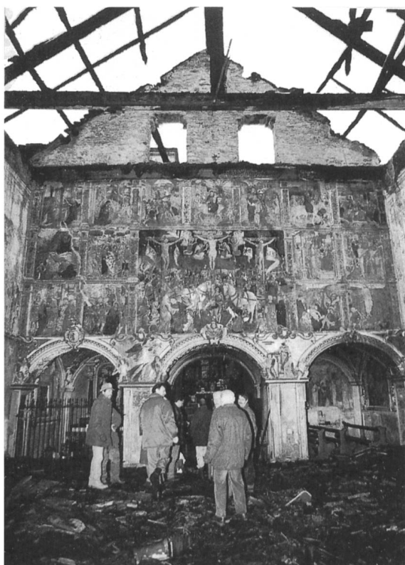
L'apocalittico interno della navata dopo l'incendio.

Il 31 dicembre 1996 rimarrà per la chiesa di S. Maria delle Grazie di Bellinzona una data infausta. Infatti un terribile incendio scaturito da un corto circuito generato dall'illuminazione del presepe natalizio si propagò in modo veemente avvolgendo l'intera struttura e le travature portanti un tetto di piode facendolo rovinare. Questa chiesa, molto cara ai bellinzonesi, venne costruita verso la fine del quattrocento (1481-1495) e solennemente consacrata il 5 ottobre 1505 da Monsignor Giulio Galardo coadiutore del vescovo di Novara. La tramezzatura della navata con il suo monumentale affresco rinascimentale della fine del sec. XV con al centro la Crocefissione attorniata da quindici riquadri con scene della vita e passione di Cristo e altri preziosissimi dipinti opere di illustri maestri hanno, malgrado il crollo del tetto, il fuoco, il fumo e l'enorme calore all'interno dell'edificio, superato miracolosamente la furia distruggitrice