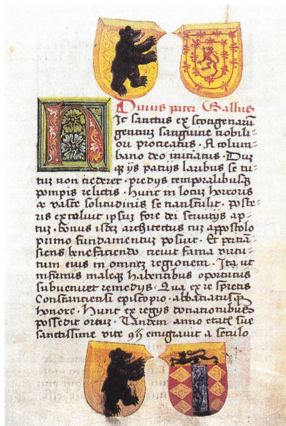
Abb. 1 Die Wappen der beiden Stiftspatrone (oben rechts und unten rechts) Stiftsbibliothek St. Gallen Cod. sang. 613 S. 7

Gallus' Wappen ist eine «Neuschöpfung mit Usurpation» eines vorhandenen historischen Wappens. Zwei Traditionstränge waren bei der Schaffung dieses Wappens massgebend. Ein älterer: der Name Scoti für die alten Bewohner Irlands 9 , welcher in St. Gallen seit alters bekannt war; ein neuerer: das seit der Mitte des 13. Jahrhunderts überlieferte schottische Königswappen, der aufgerichtete rote Löwe in Gold mit doppeltem roten Lilienbord 10 .