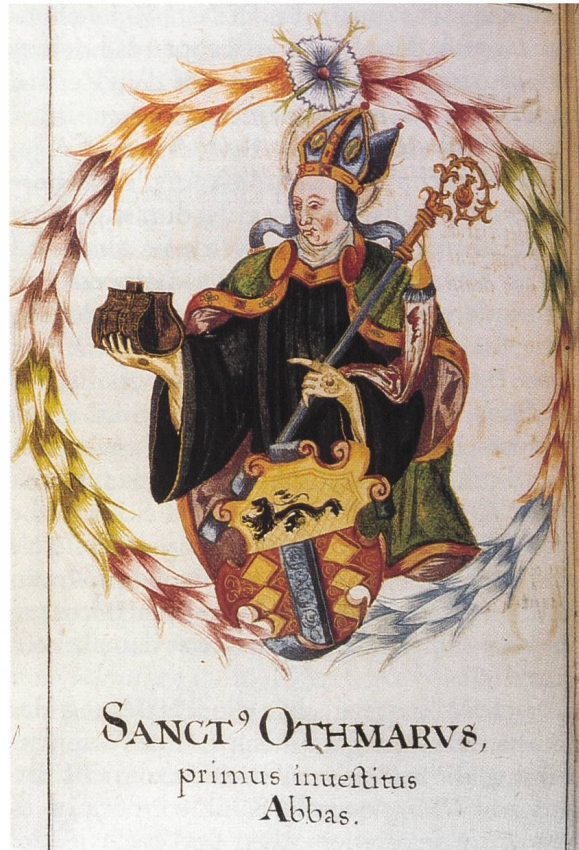
Abb. 3 Der heilige Otmar mit seinem Wappen(schild?) Stiftsarchiv St. Gallen Band 186 S. 204