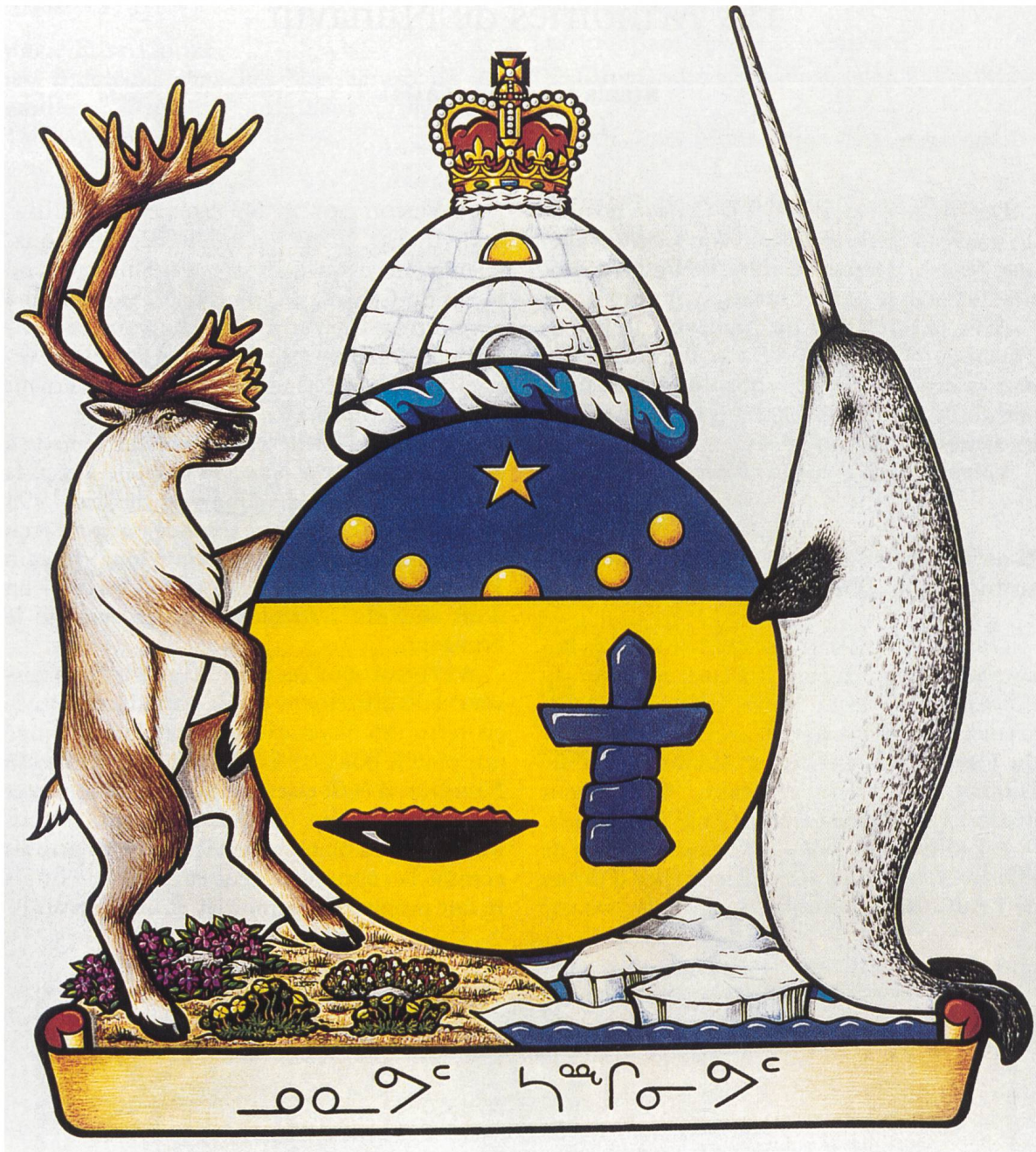
III. 2: Armoiries du Territoire

SACHE DONC qu'ayant considéré cette demande et qu'en vertu de l'autorité dont Sa Majesté m'a investi, par les présentes et pour le plus grand honneur et la plus grande distinction du territoire du Nunavut, je lui octroie et assigne les armes suivantes sur un écu circulaire: D'or, à dextre un qulliq de sable allumé de gueules, à senestre un inuksuk d'azur, au chef du même chargé de cinq besants d'or posés en arc renversé, mouvants du bas du chef et surmontés d'une étoile (niqirt-suituq) du même; L'écu sommé d'une torque d'argent et d'azur; Et pour cimier: Un iglou