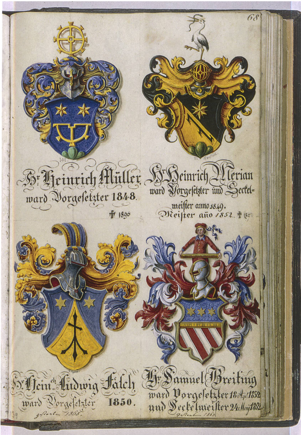
Abb. 5: Wappen des 19. Jahrhunderts, teilweise signiert; Hieronymus Hess, Johann Jakob Neustück, Konstantin Guise, Unbekannt, um 1850.