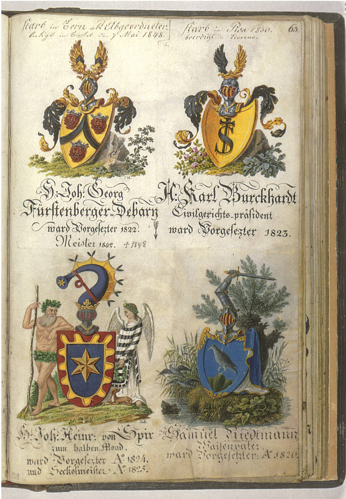
Abb. 7: Wappen von unbekannter Hand aus der Zeit der Romantik.