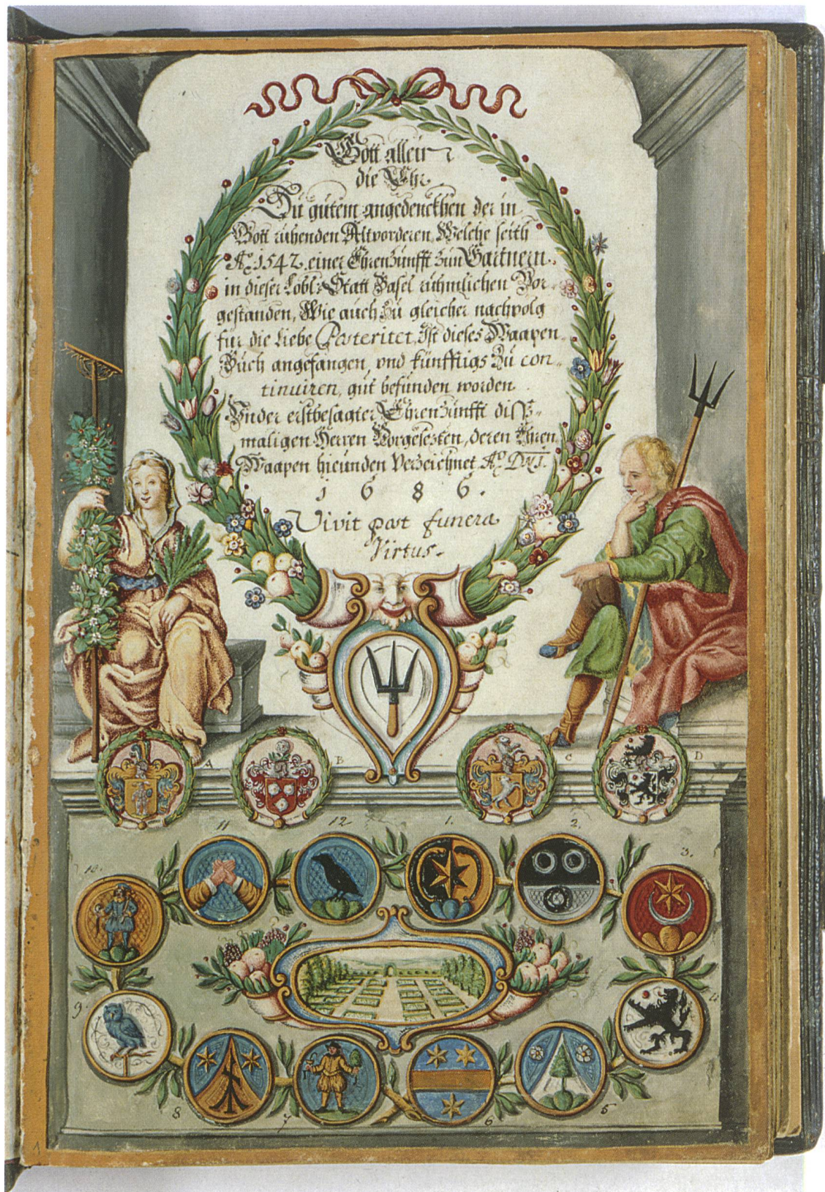
Abb. 2: Titelblatt von Johann Jakob Ringle d. J., 1686.