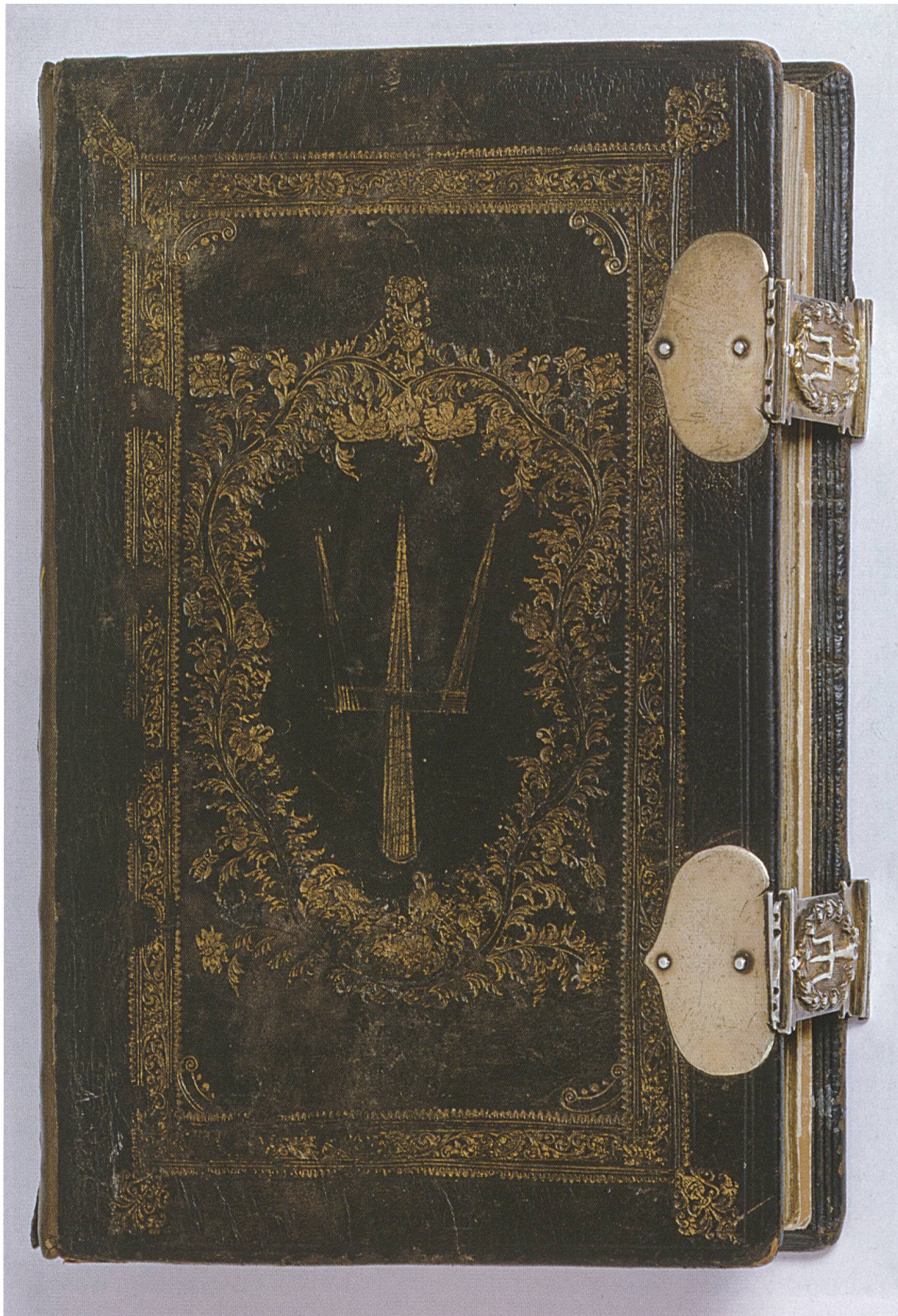
Abb. 1: Wappenbuch der Zunft zu Gartnern in Basel. Ledereinband von Lukas Iselin, Buchschliessen von Sebastian Fechter d. J., 1686.