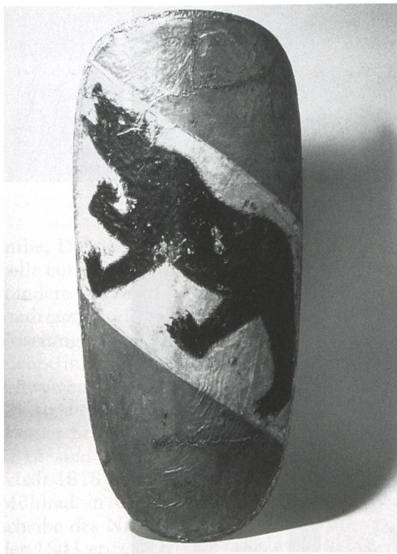
Ill. 3: Berner Setzschild aus dem späten 14. Jahrhundert (Inv. 269c, Bernisches Historisches Museum).

Pavois bernois de la fin du 14e siècle (Inv. 269c, Musée d'histoire de Berne).