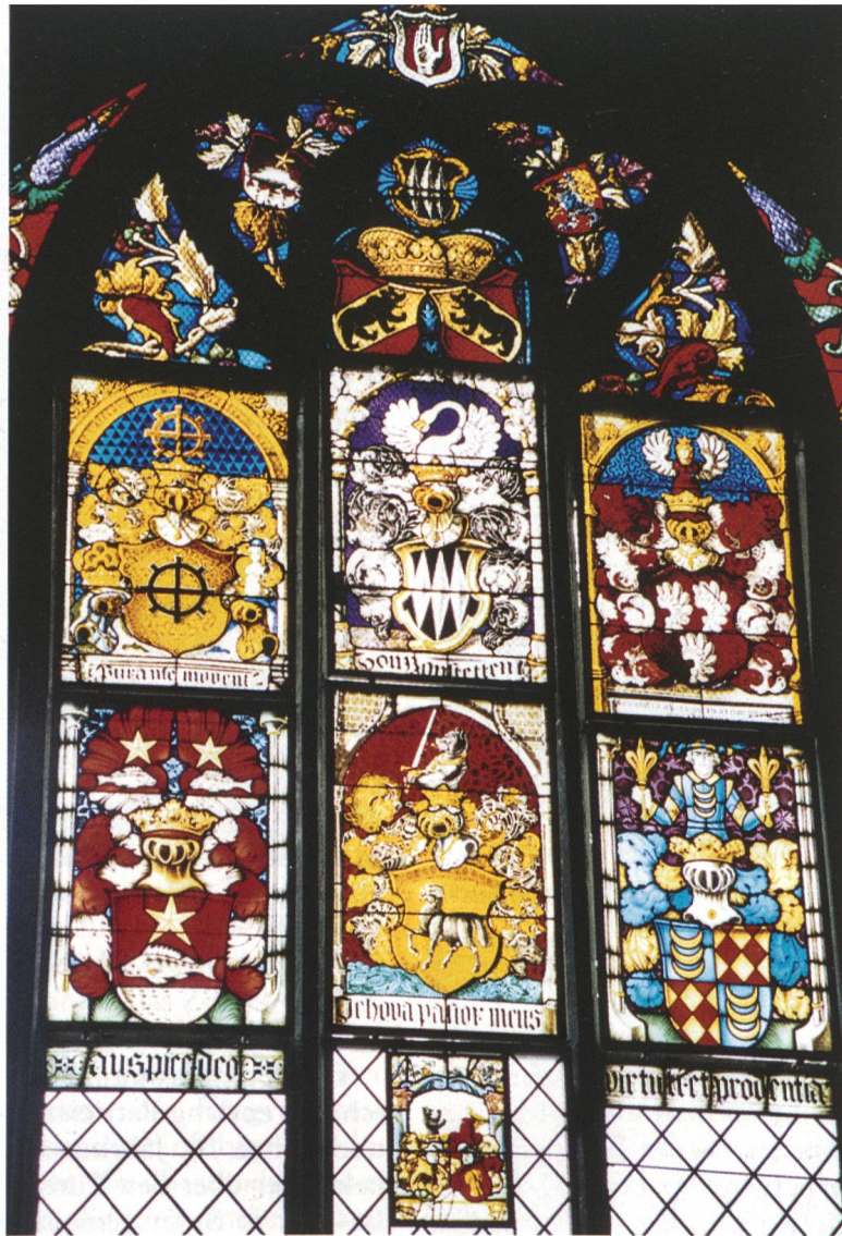
Ill. 5: Wappenscheiben in der Ringoltingen-Kapelle (Berner Münster).

Vitraux armoriés dans la chapelle de Ringoltingen (Collégiale de Berne).