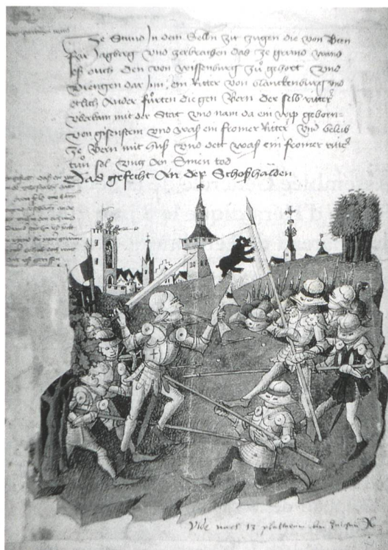
Ill. 2: Beim Gefecht an der Schosshalde 1289 retten die Berner mit Mühe und Not ihr zerrissenes Banner (aus der 1470 entstandenen Berner Chronik des Bendicht Tschachtlan).

Während bei Justinger Bilder fehlen, malt uns die spätere Chronik von Tschachtlan (wie übrigens auch diejenige von Schilling, 1485) diese möglicherweise erste Fahne Berns. Die Chronik berichtet, dass beim Gefecht in der Schosshalde gegen Rudolf von Habsburg im Jahre 1289 die Berner Fahne nur knapp gerettet werden konnte und dabei zerrissen worden sei. Diese Szene wird auch bildlich wiedergegeben. Nach dieser Niederlage hätten die Berner beschlossen, die Fahne zu ändern, nämlich in die heute bekannte Form. Es fehlen historische Beweise für diesen Fahnenwechsel, er ist aber nicht völlig aus der Luft gegriffen. Wir wissen, dass Bern zuerst ein Siegel hatte, danach entstand die Fahne und zuletzt erst legte sich der Stadtstaat Bern ein dem Fahnenbild entsprechendes Wappen zu. Eine solche Entwicklung können wir ja vielerorts in der europäischen Frühheraldik und Vexillologie beobachten.