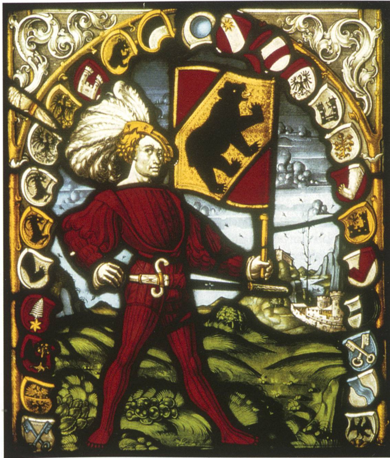
Ill. 9: Berner Bannerträgerscheibe, spätestens um 1514 (Inv. 26156, Bernisches Historisches Museum).

Vitrail du banneret de Berne, au plus tard vers 1514 (Inv. 26156, Musée d'Histoire de Berne).