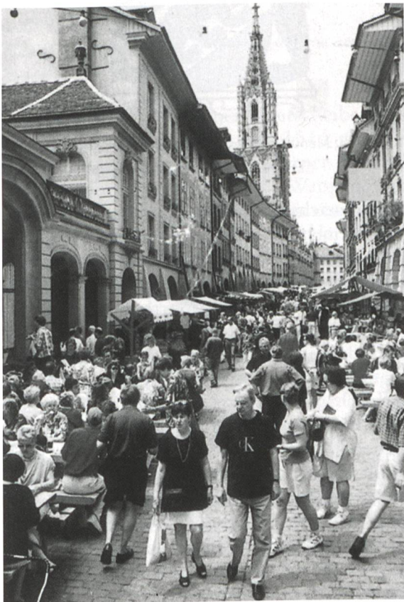
Ill. 7: Quartierfest beim Erlacherhof, Bern. Fête de quartier devant l'Hôtel d'Erlach, à Berne.

milie. Die übrigen Glasmalereien dieser Kapelle entstanden im frühen 19. und 20. Jahrhundert. 1826 entstanden die Scheibe des Stadtratspräsidenten Gabriel Friedrich von Frisching, der als Vertreter der adeligen Hauptlinie der Familie Frisching einen schwarzen Widder in Gold (ohne Dreiberg) führte, die des Niklaus Friedrich von Mülinen (Berner Schultheiss von 1803 bis 1806 und 1814 und Landammann der Eidgenossenschaft 1818 und 1824), welche ein schwarzes Mühlrad in Gold zeigt, und die Wappenscheibe des Niklaus Rudolf von Wattenwyl, der 1803 erster Berner Schultheiss nach der Helvetik wurde, erneut 1812 Schultheiss wurde und in den Jahren 1804 und 1810 Landammann der Schweiz war. Sein Wappen zeigt die bekannten drei silbernen Flügel in