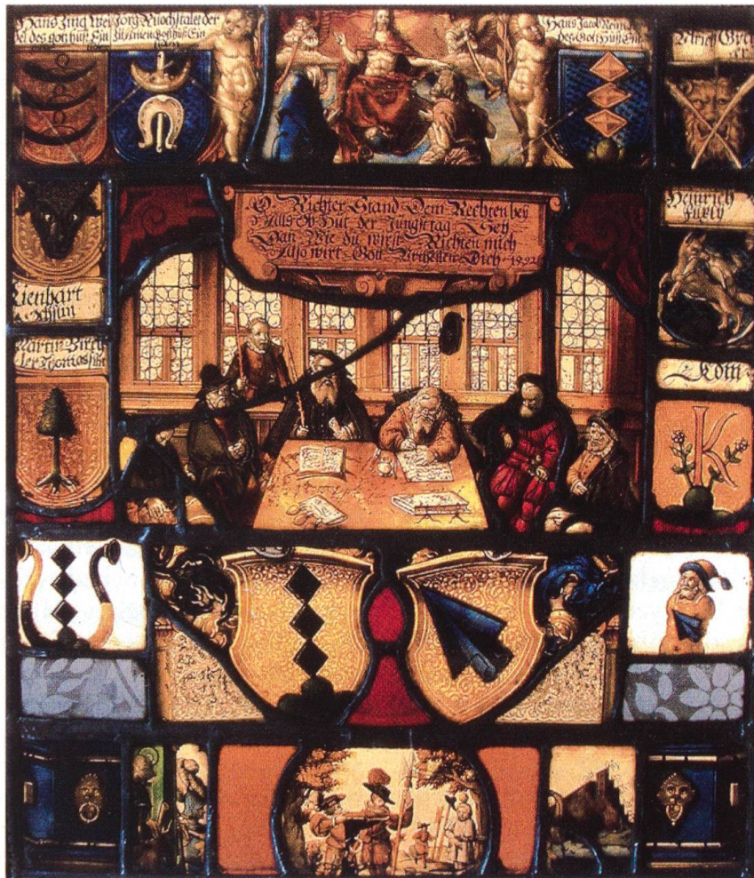
Die Einsiedler Gerichtsscheibe von 1592: Noch heute ist sie Bestandteil der klösterlichen Kunstsammlung des Benediktinerstiftes Einsiedeln.

Schon im Jahre 1376 hatte Peter von Wolhusen, Konventuale des Klosters Einsiedeln und Propst zu St. Gerold im österreichischen Vorarlberg, nachweisbar eine dem Kloster Einsiedeln gehörende Kapelle «verglazen lassen».