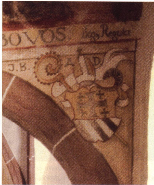
Bild 3 Wappen des Abtes Jakob Bundi in der alten St. Benediktskapelle.