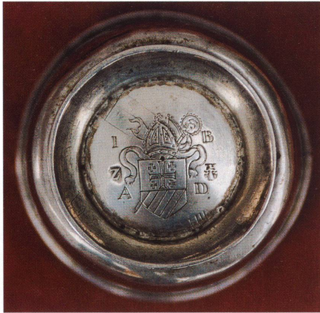
Bild 4 Silberbecher mit dem eingravierten Wappen des Abtes Jakob Bundi.