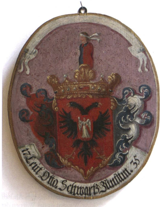
Bild 47: Wappen des Leutnants und Zunftmeisters Otto Schwarz. Das hier abgebildete Wappen ist das Wappen der jüngeren Linie von Chur und stellt das vermehrte Wappen dar.

Leutnant Otto Schwarz, Zunftmeister 1735