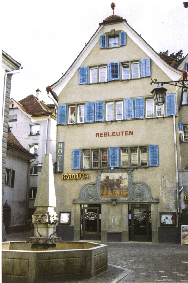
Zunftthaus zu den Rebleuten Im Jahr 1483 kauften die Rebleute zwei Privathäuser und gestalteten diese zu einem Zunftthaus um. Nach der Zunftauflösung 1839 gelangte das Haus in Privatbesitz. 1914–16 wurde es umgebaut, erhöht und in ein Hotel umgewandelt. Die prachtvolle Zunftstube im Obergeschoss, die sich über die ganze Breite des Gebäudes erstreckt, ist erhalten geblieben. Das Fassadengemälde stammt vom Umbau 1915. 7 (Aufnahme März 2007)