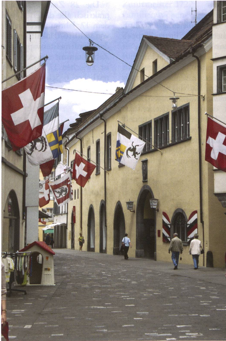
Das Churer Rathaus 2007