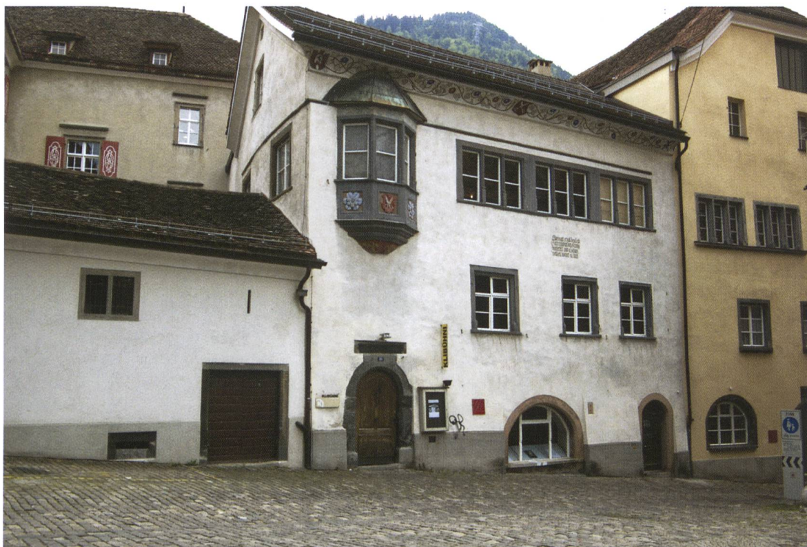
Zunftthaus der Schneider. Das ehemalige Zunftthaus weist im Inneren einen grossen, mit Laubengängen versehenen Innenhof auf. Über einen überwölbten Treppenlauf gelangt man zur grossen Zunftstube im 2. Stock. Das Gebäude wurde nach dem Stadtbrand von 1464 auf einem Vorgängerbau errichtet und 1602 bis zur heutigen Firstlinie ausgebaut. Seit 1974 ist hier das Theater Klibübbni untergebracht, das seither für neues Leben im alten Gemäuer sorgt. (Aufnahme Mai 2007)

Die Oberzunftmeister hatten als Vorsteher ihrer Zunft das Recht, diese einzuberufen und die anstehenden Abstimmungen durchzuführen. Sie nahmen alljährlich die Klagen ihrer Zunftbrüder auf und legten sie als Klagepunkte der Obrigkeit vor. Zusammen mit den Zunftvorgesetzten richtete der Oberzunftmeister über zunftinterne Angelegenheiten wie Handwerksstreitigkeiten oder Verstösse gegen Handwerksbestimmungen. In der Praxis dienten Oberzunftmeister und Oberzunftmeister als Bindeglied zwischen den Zünften und dem Rat. Einerseits gehörten sie Rat und Gericht an, die oft als erweiterter Kleiner Rat tagten, andererseits vertraten sie die Interessen ihrer Zunft. 9