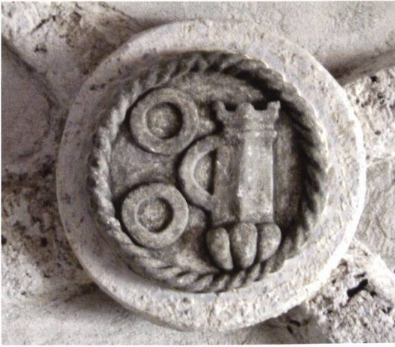
Ill. 12. Schlussstein mit der Wappenallianz Scharnachthal-Breitenlandenberg, 16. Jh..

Clef de voûte avec l'alliance Scharnachthal et Breitenlandenberg, 16 e siècle.