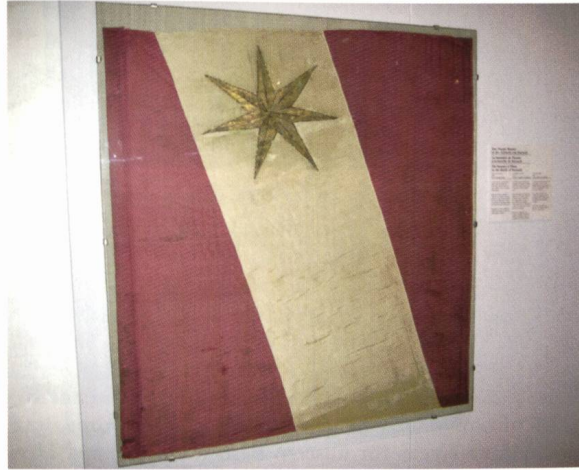
Ill. 3. Thuner Banner mit goldenem Stern, getragen 1499 in der Schlacht bei Dornach. Bannière de Thoune avec étoile d'or portée à la bataille de Dornach en 1499.