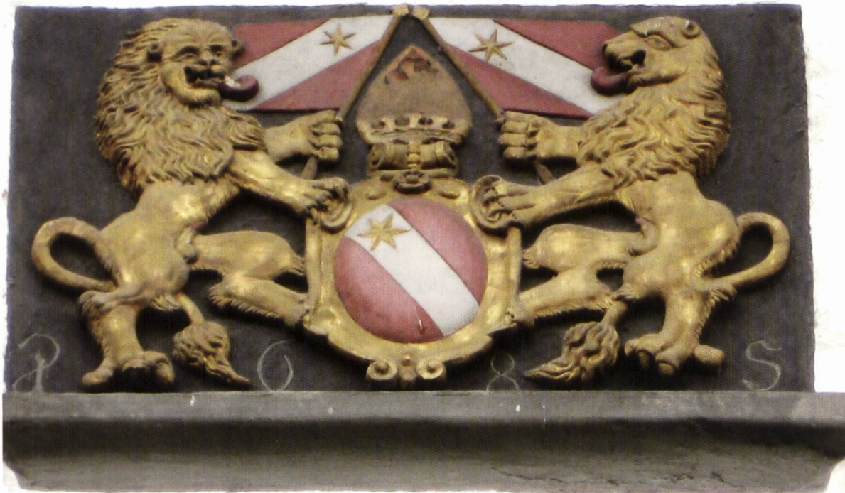
Ill. 4. Bemaltes Steinwappen von 1685 am Thuner Rathaus. Grands armoiries de Thoune en pierre peinte de 1685 à la façade de l'hôtel de ville.