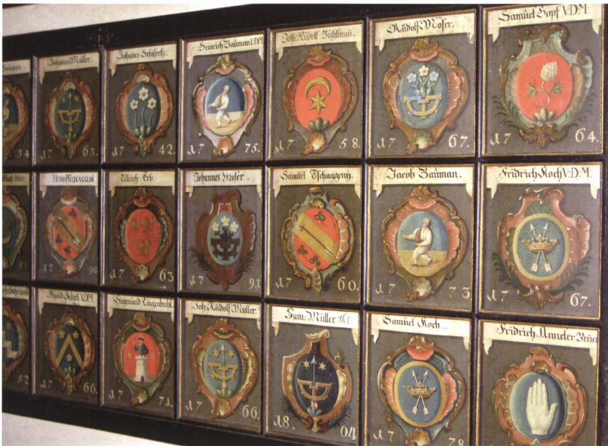
Ill. 6. Wappentafeln der Thuner Zunftmitglieder. / Tables armoriées des membres des confrères de Thoune.