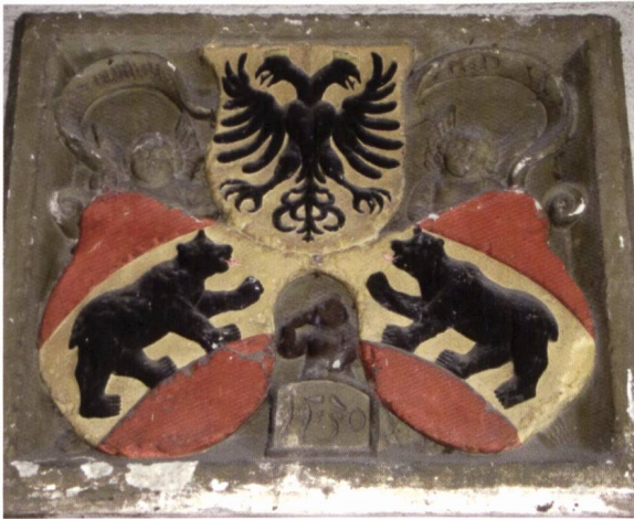
Ill. 2. Dreipass «Berner Rych» am Schlosseingang. Pyramide armoriale de l'état de Berne à l'entrée du château.

Wer sich die Mühe nahm, nach den Fahnen noch weiter unter den Dachstock zu steigen, wurde mit einem atemberaubenden Alpenpanorama belohnt, die Altstadt, die Aare und den See zu Füßen. Zu vereinbarter Zeit versammelten wir uns dann alle wieder im Untergeschoss, wo uns Herr Küffer eine eindruckliche Sammlung von Wappentafeln