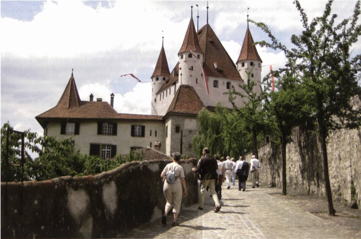
Ill. 1. Aufstieg zum Schloss Thun. / Montée au château de Thoune.

Trotz herrlichem Alpenpanorama, interessantem Programm mit Schifffahrt und schönem Wetter nahmen nur gerade 26 Mitglieder (darunter alle 11 Vorstandsmitglieder) sowie 14 Begleitpersonen an der Jahrestagung in der Hauptstadt des Berner Oberlandes teil.