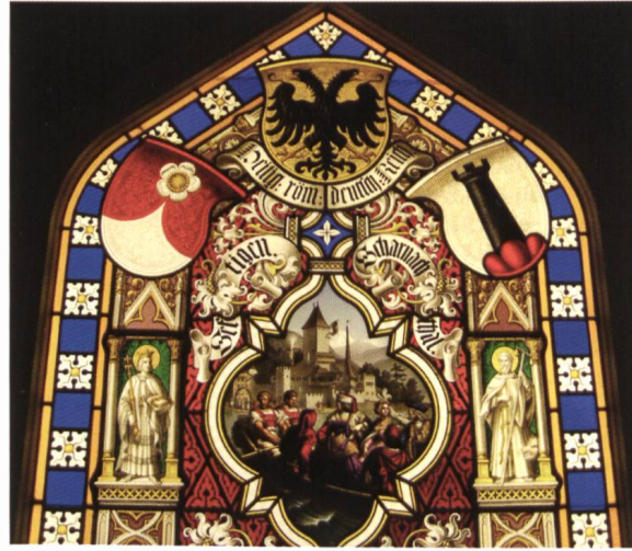
Ill. 14. Glasgemälde aus dem 19. Jh. mit dem Reichswappen und den Wappen Seftigen und Scharnachthal.

Clef de voûte avec l'alliance Scharnachthal et Breitenlandenberg, 16 e siècle.