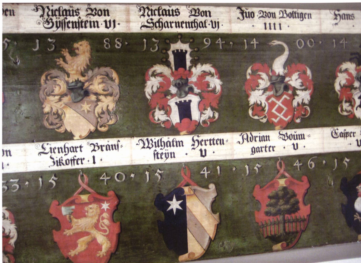
Ill. 7. Wappentafeln der Thuner Amtsrichter mit Jahreszahl ihres Amtsantritts. / Tables armoriées des juges de Thoune avec date de leur entrée en fonction.