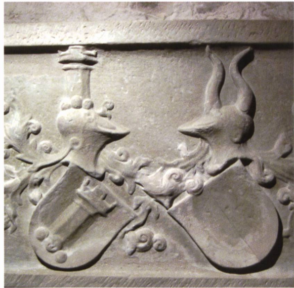
Ill. 9. Steinrelief mit dem Allianzwappen von Scharnachthal und von Heidegg, um 1430.

Motif de la carte de menu pour le banquet, dessiné par Rolf Kälin.