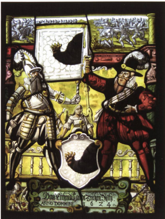
Ill. 15. Wappenscheibe des Landes Aeschi von 1624. Vitrail d'état du pays d'Aeschi datant de 1624.

Am Ende des über einstündigen Rundgangs genossen wir die Aussicht im Vorgarten des Schlosses, bevor wir den öffentlichen Bus zum Nachbarort Hilterfingen bestiegen. Dort befindet sich wenige Meter am Hang über der Bushaltestelle die Kirche Hilterfingen aus dem Jahre 1175, mit Anbauten aus dem 14., 15. und 18. Jahrhundert. Den Heraldiker interessieren darin die vielen Wappenscheiben, so eine Wappenscheibe des Ritters Conrad von Scharnachthal (1406–1472), die er kurz vor seinem Tod im Jahre 1472 vom Glasmaler Hans Noll schaf-fen liess (Ill. 16). Die Edlen von Scharnachthal, aus einem Dorf am Eingang des Kientals stammend, kamen durch Heirat des Niklaus I. mit Antonia von Seftigen, Schwester des Schultheissen Ludwig von Seftigen, 1398 in den Besitz der Herrschaft Oberhofen. Die Wappenscheibe ist einem Enkel dieses Ehepaares gewidmet. Ritter Conrad wuchs im Schloss Oberhofen auf und begab sich als Jüngling an den savoyischen Hof, in dessen Gunst er zeitlebens blieb. Conrad bereiste fast alle Höfe der damals bekannten Welt, erhielt vom König von Zypern, Johann von Lusignan, einen Orden, auch vom König von Kastilien und Leon bekam er später den Orden des königlichen Halsbandes und in England verdiente er sich den «SS collar» des Hosenbandordens.