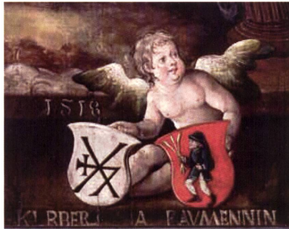
Wappen und Namen der Auftraggeber

Ebenso konnte das Wappen im oberen Bildteil bis jetzt nicht bestimmt werden. Vielleicht handelt es sich um das des Malers Heinrich Vogtherr des Ä. (1490–1556). Die Rückseite der Tafel ist mit Blumen- und Früchteornamenten reich geschmückt. Diese