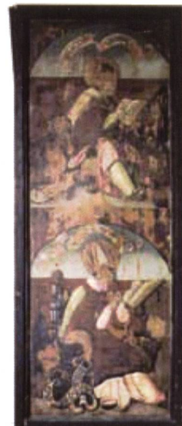
Altarflügel verso Württembergischen Landesmuseum, Stuttgart

Im Jahr 2005 reiste die Verfasserin erneut zur Evangelischen Stadtkirche in Wimpfen, in der Vogtherr von 1522 bis 1525 tätig war.