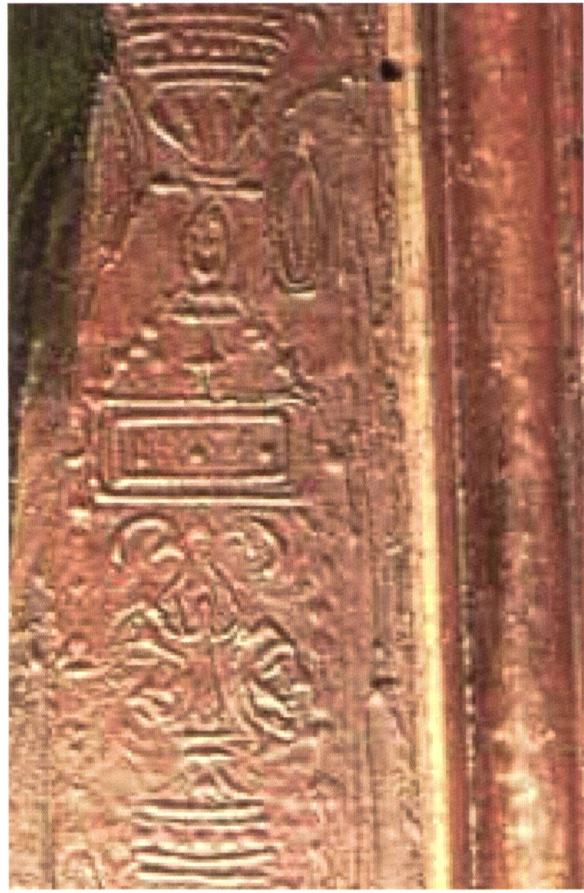
Monogramm «H.V.» Heinrich Vogtherr

verlagerte sich die Untersuchung auf zwei andere Werke, von denen man mittlerweile mit Sicherheit weiss, dass sie ebenfalls von Vogtherr d. Ä. stammen.