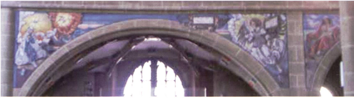
Zweiteilige Wandgemälde «Mariae Verkündigung»