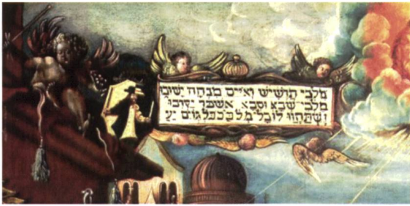
Wappen des Malers

und Schwarz, belegt mit einem halben Mann mit Hut in gewechselten Farben, der in seinen Händen je einen Stab nach oben hält. Es liegt nahe, in diesem Schild das Wappen des Malers zu vermuten.