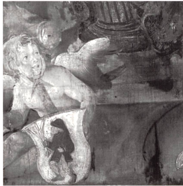
Infrarotreflectogramm Unterzeichnung Engelsgesicht Korrektur Kopfkontur