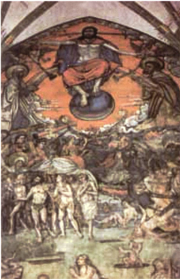
Wimpfen a. B. Evangelische Pfarrkirche. Jüngstes Gericht, Wandgemälde.