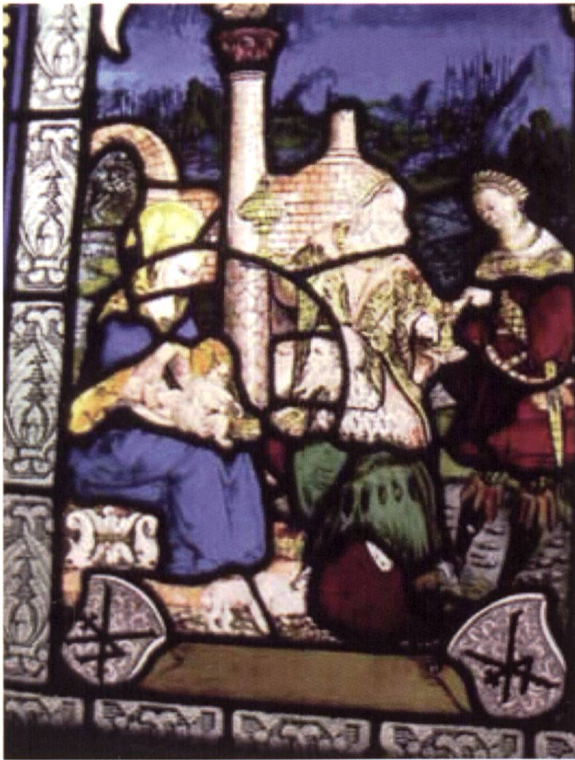
Glasfenster, datiert 1522, Anbetung der Könige, Stadtkirche Bad Wimpfen (eine Stiftung des Konrad Korbeir/Kober und seiner Ehefrau Agatha Bameni/Baumann).

gründlich durchleuchtet. So wurden beispielsweise die Unterzeichnungen, mit denen der Künstler das Gemälde vorbereitet hatte, mit Infrarotstrahlen (mit unterschiedlichen Wellenlängen durch die Inframetrix IR-Kamera und den digitalen Phase-1-Fotohintergrund) sichtbar gemacht.