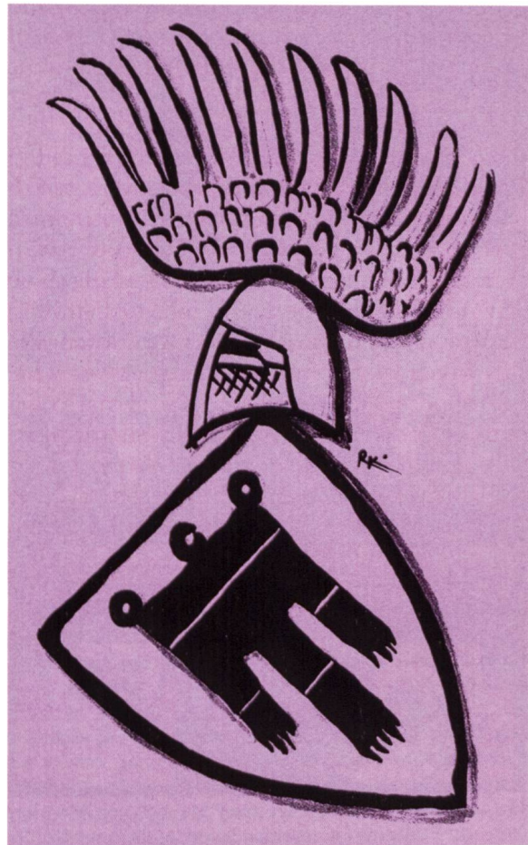
Ill. 16: Das Werdenberger Wappen auf der Menükarte für das Bankett, fecit Rolf Kälin Carte de menu avec les armoiries de Werdenberg, dessin de Rolf Kälin

Abteilungsleiter im Archiv der Stadt Feldkirch, zu einer Stadtführung. Nach und nach hatten sich alle Teilnehmer am Besammlungsort eingefunden und die Führung konnte beginnen.