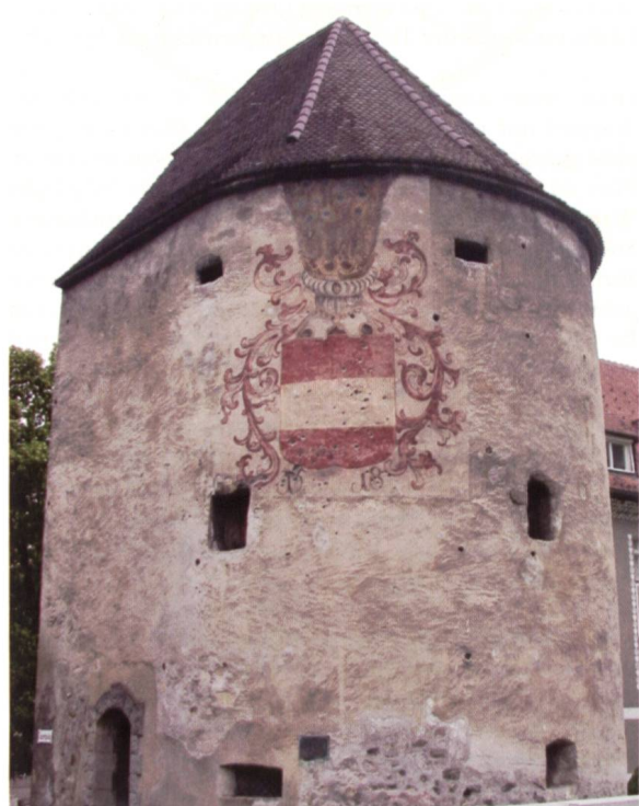
Ill. 20: Wasserturm an der Ill, welcher als Verstärkung für die Stadtmauer erbaut wurde La «tour de l'eau» sur l'III, construite en 1482 pour renforcer les murailles de la ville

Unsere erste Station in der Altstadt war das so genannte Churerort. Vor 1270 erbaut, wurde das Churerort im Zuge der Neubefestigung der Stadt 1491 von Grund auf erneuert. Ein dem sechsgeschossigen Torturm vorgelagertes, 1591 errichtetes Vorwerk wurde bei der Einebnung der Stadtgräben nach 1826 abgetragen. Das Churerort ist heute das einzige erhalten gebliebene turmartige Stadttor im Vorarlberg.