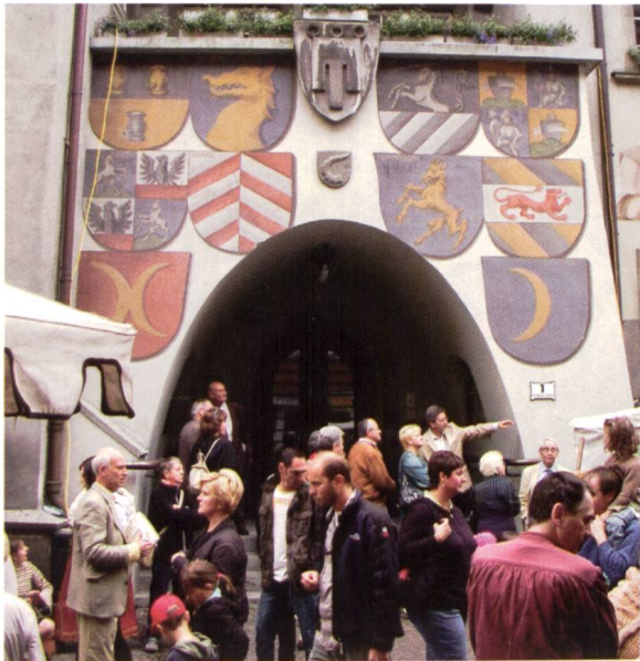
Ill. 21: Fassade des Feldkircher Rathauses mit Wappen von Feldkircher Familien Façade de l'hôtel de ville de Feldkirch avec des armoiries de familles bourgeoises