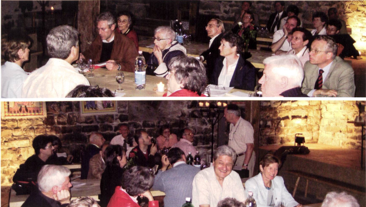
Ill.1 und 2: Generalversammlung im Kellergewölbe des Schlosses Werdenberg Pendant l'assemblée générale dans la cave du château de Werdenberg