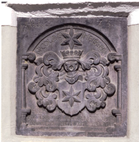
Bild 9: Steinskulptur an der Westfassade mit der Inschrift: A° 1673 NICOLAVS MEISSER ALT R LANT A ZV TISENTIS LANTSHAPT M VELTLINS VND D ER ZEIT LANT R DES LOGB