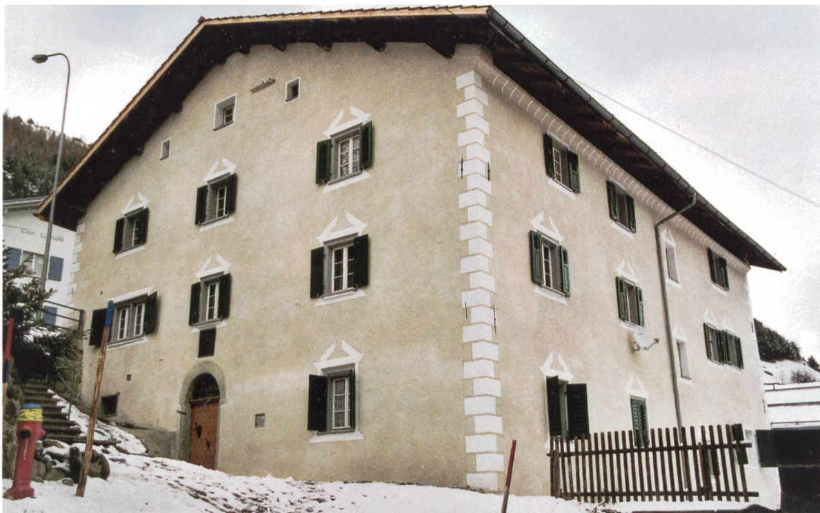
Bild 7: Casacrap, 1673 von Landrichter Nikolaus Maissen gebaut. Ansicht der West- und der Südfassade. Zu beachten sind die professionell restaurierten Fassadenverzierungen.

Stuck-Hohlkehle an der Südfassade waren noch deutlich sichtbar. Die Hauptabmessungen des Gebäudes betragen: