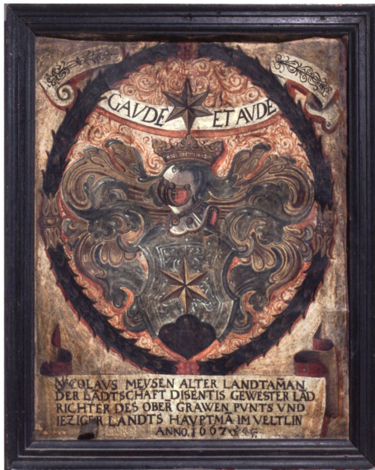
Bild 12: Wappen des Landeshauptmanns im Bernischen Historischen Museum. Dieses Ölbild entstand 1667 in Sondrio, am Ende seiner Amtszeit als Landeshauptmann des Veltlins, und trägt folgende Inschrift: NICOLAVS MEYSEN ALTER LANDTAMMAN DER LANDTSCHAFT DISENTIS GEWESTER LAND RICHTER DES OBER GRAWEN PVNTS VND IEZIGER LANDTS HAVPTMAN IM VELTLIN ANNO 1667.

Wappen Pfarrei- und Gemeindedokumente. 1639 siegelte er als Statthalter für «rath und ganze nachparschafft Sumvix» zusammen mit Fürstabt Augustin Stöcklin die Präsentation für einen neuen Pfarrer. 1630/33 war er Kirchenvogt und wurde zum eigentlichen Förderer der neuen Pfarrkirche, wofür er in einer lateinischen Urkunde höchstes Lob erhielt. Im Hochgericht Disentis bekleidete er das Amt eines Quästors oder Landessäckelmeisters. Er sass auch im Gericht.