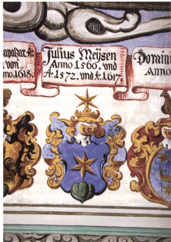
Bild 4b: Falsches Wappen des Ldrs. Gilly Maissen. Im Landrichtersaal wurde der Schild von Gilly Maissen mit demjenigen von Nikolaus Maissen verwechselt. Die richtigen heraldischen Embleme sind in den Bildern 16 bis 18 dargestellt.

Grund stets begehrt und vor der Wahl oft hart umkämpft. Seine Amtsträger sind, mit wenigen Ausnahmen, seit 1424 bekannt. Auch existieren kleinere oder grössere Biografien von zahlreichen Landrichtern, die die Geschicke des Bundes im Laufe der Zeit wesentlich beeinflusst haben. Weniger bekannt, und zwar inhaltlich wie personell, waren dagegen die übrigen vier Bundesämter, nämlich: