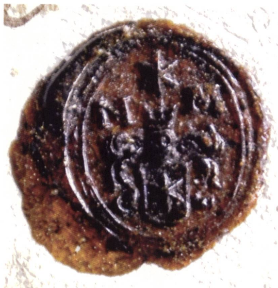
Bild 10: Siegel des Landrichters Nikolaus Maissen mit den Initialen N.M. Das Siegel steht auf einem Originaldokument vom 2./12. Juli 1663, das auf dem Bundestag der Drei Bünde in Ilanz verfasst wurde. 12