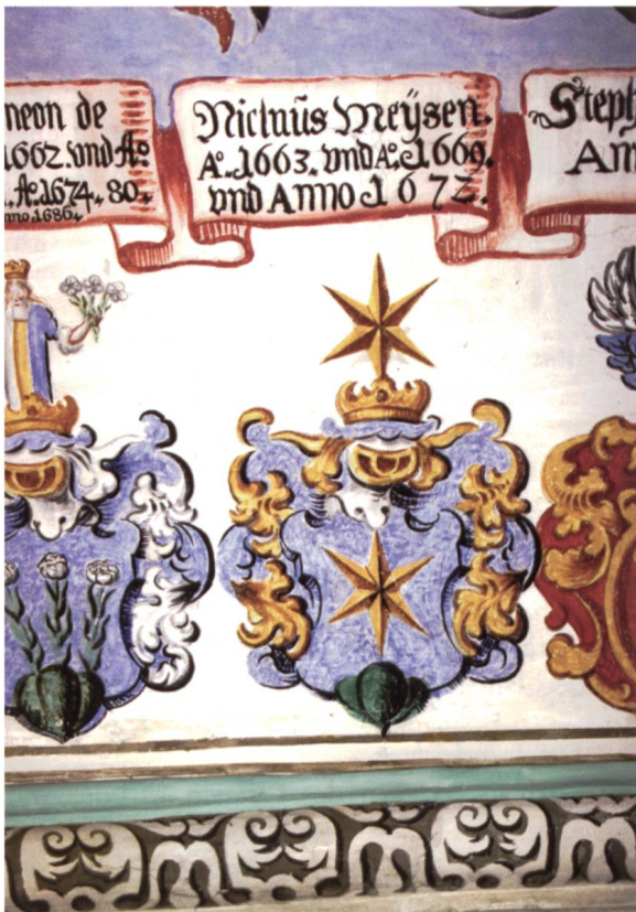
Bild 4a: Wappenfresko des Landrichters Nikolaus Maissen im Landrichtersaal. «In Blau auf grünem Dreieck ein sechsstrahliger goldener Stern. – Helmzier: Auf goldener Krone sechsstrahliger goldener Stern.»