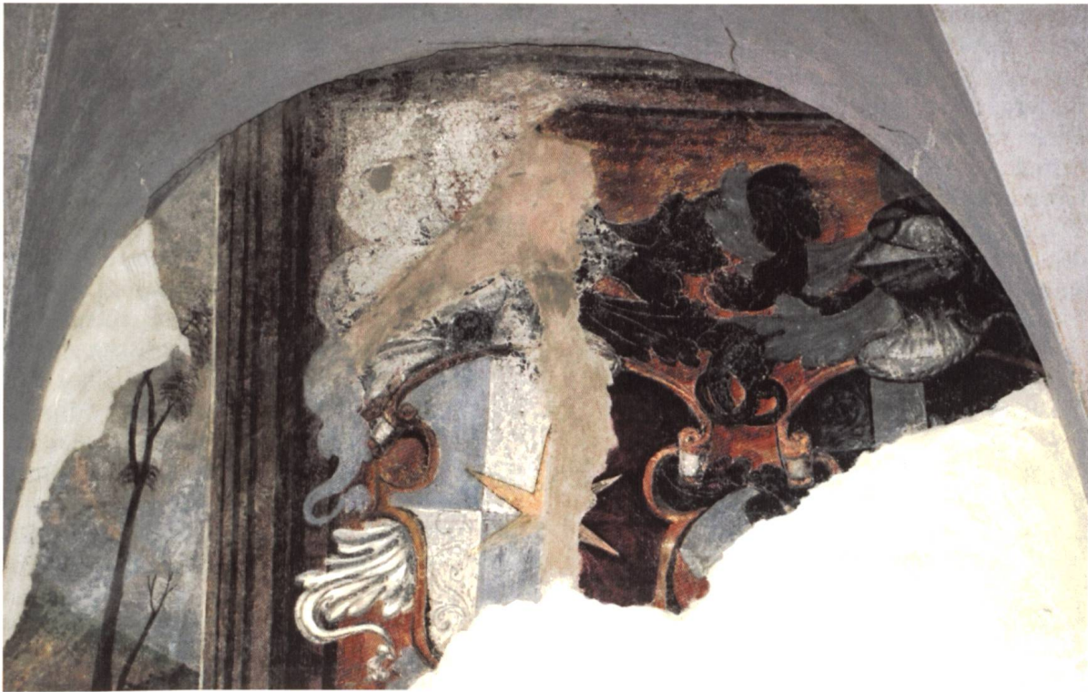
Bild 18: Wappen von Gilly Maissen in Sondrio: Gespalten, rechts geviert von Silber und Blau, links von Rot. Schildmitte belegt mit einem sechsstrahligen goldenen Stern. – Helmzier: [Sechsstrahliger goldener Stern].

Das Wappen des Oberen Bundes weist die heraldischen Embleme des ehemaligen Banners dieses Bundes auf, nämlich ein silbernes Kreuz auf rotem Grund.