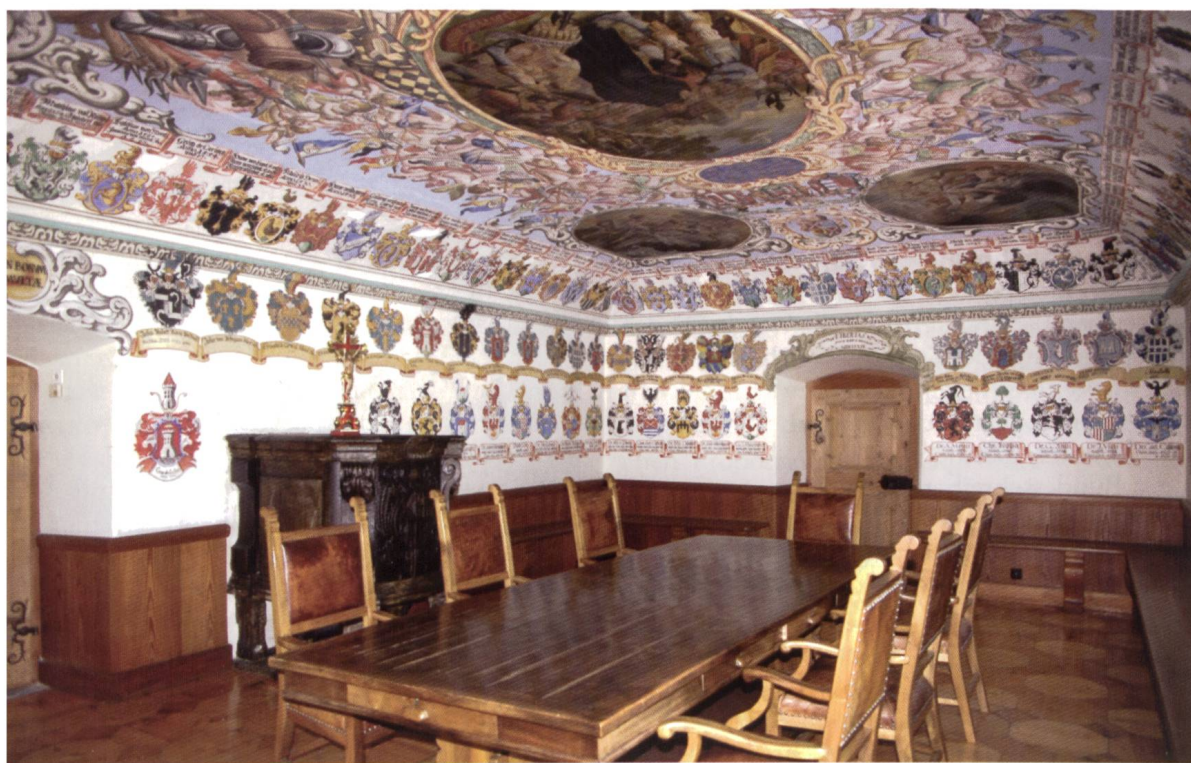
Bild 3: Der Landrichtersaal in der ehemaligen Residenz des Grauen Bundes in Trun. Die künstlerische Ausgestaltung erfolgte durch den Disentiser Mönch Fridolin Eggert um 1700 unter dem Regime von Abt Adalbert III. de Funs.

Von den Ämtern des Grauen Bundes war dasjenige des Landrichters ohne Zweifel das wichtigste. Es war das höchste Amt, das der Bund zu vergeben hatte, und aus diesem