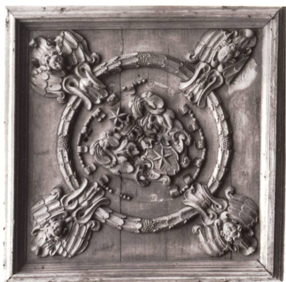
Bild 11: Kassettendecke mit geschnitztem Maissen-Wappen inmitten von Engelsköpfen. Diese Wappentafel befindet sich in der Mitte einer Holzdecke, die ursprünglich die Prunkstube der Casacrap schmückte und heute im Direktionsbüro des Bernischen Historischen Museums eingebaut ist.