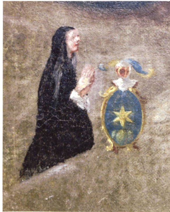
Bild 14: Das in Bild 13 erwähnte Miniaturwappen «In Blau auf grünem Dreieck ein sechsstrahliger goldener Stern. – Helmzier: Gold/blau Schleife.»