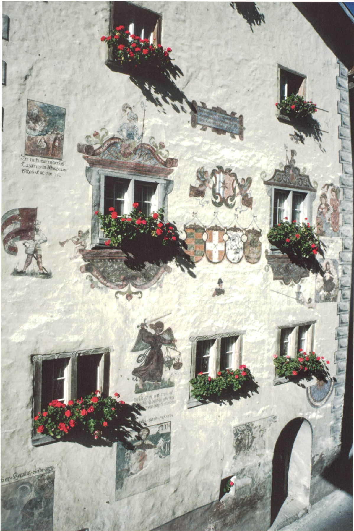
Bild 16: Haus des Landrichters Gilly Maissen d. Ä., das er 1570 erstellen liess. Die Süd- und die Ostfassade sind mit Fresken bemalt. Zum 400-jährigen Bestehen wurden sie 1967/68 restauriert.