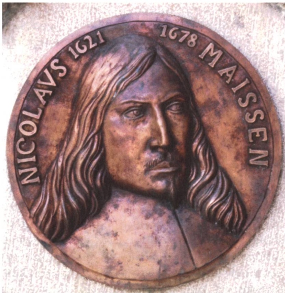
Bild 2: Landrichter Nikolaus Maissen. Bronzeskulptur von 1978 auf einer Gedenktafel in Somvix.

Von 1676 bis 1678 strengte das Kriminalgericht von Disentis unter Führung der aristokratischen Familien der Landschaft Disentis einen Prozess gegen Nikolaus Maissen an. Der bürgerliche Staatsmann war ihnen zu mächtig geworden. Durch das Endurteil vom 9. Februar 1677 n. St. wurde der Altlandrichter politisch und physisch vernichtet. Sein gesamtes Vermögen wurde konfisziert, er wurde verbannt, in die Acht erklärt und damit zum Tode verurteilt. Die Macht der Obrigkeit endete jedoch an den Grenzen der Landschaft Disentis. Bei der Verfolgung des Altlandrichters war die Obrigkeit deshalb auf die Hilfe der übrigen Gerichtsgemeinden angewiesen. Von dort kam jedoch keine Hilfe. Im Gegenteil, der Gotteshaus- und der Zehngerichtenbund ergriffen offen Partei für Landrichter Maissen. Auf dem Davoser Bundestag von 1677 setzten sie eine neutrale Expertenkommission zur Überprüfung des Prozesses ein. Deren Urteil erschien im Frühjahr 1678 und lautete günstig für den verfolgten Landrichter. Vom kommenden Bartholomäusbundestag hatte Disentis somit nichts Gutes zu erwarten. Deshalb beschloss die Obrigkeit, selber zu handeln. Sie liess den Altlandrichter am 26. Mai 1678 durch zwei gedungene Meuchelmörder in Plankis bei Chur umbringen. Die beiden Mörder, die Tavetscher Martin Beer und Christian Zein, wurden bereits einen Tag später von der Stadt Chur und der Gerichtsgemeinde Rhäzüns gefangen genommen. Sie wurden