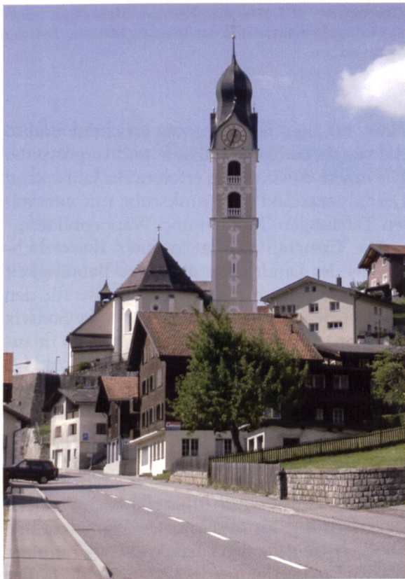
Bild 5: Somvix mit Pfarrkirche und Glockenturm. Der Bau der Kirche erfolgte 1630/33. Der Turm wurde auf Initiative von Nikolaus Maissen im Jahre 1669 errichtet.

Eine erste Kirche dürfte bereits in der zweiten Hälfte des zwölften Jahrhunderts an dieser Stelle gestanden haben, denn um 1175 wird ein erster Priester in Somvix nachgewiesen, «Johannes presbyter de Summovico,» und 1284 ein erster Pfarrer, «Mauritius plebanus de Summovico.» Um 1431 erfolgte vermutlich ein umfassender Um- oder Neubau. Zweihundert Jahre später, nämlich 1630, wurde die alte Kirche auf Anraten des Bischofs von Chur abgebrochen und durch einen Neubau ersetzt.