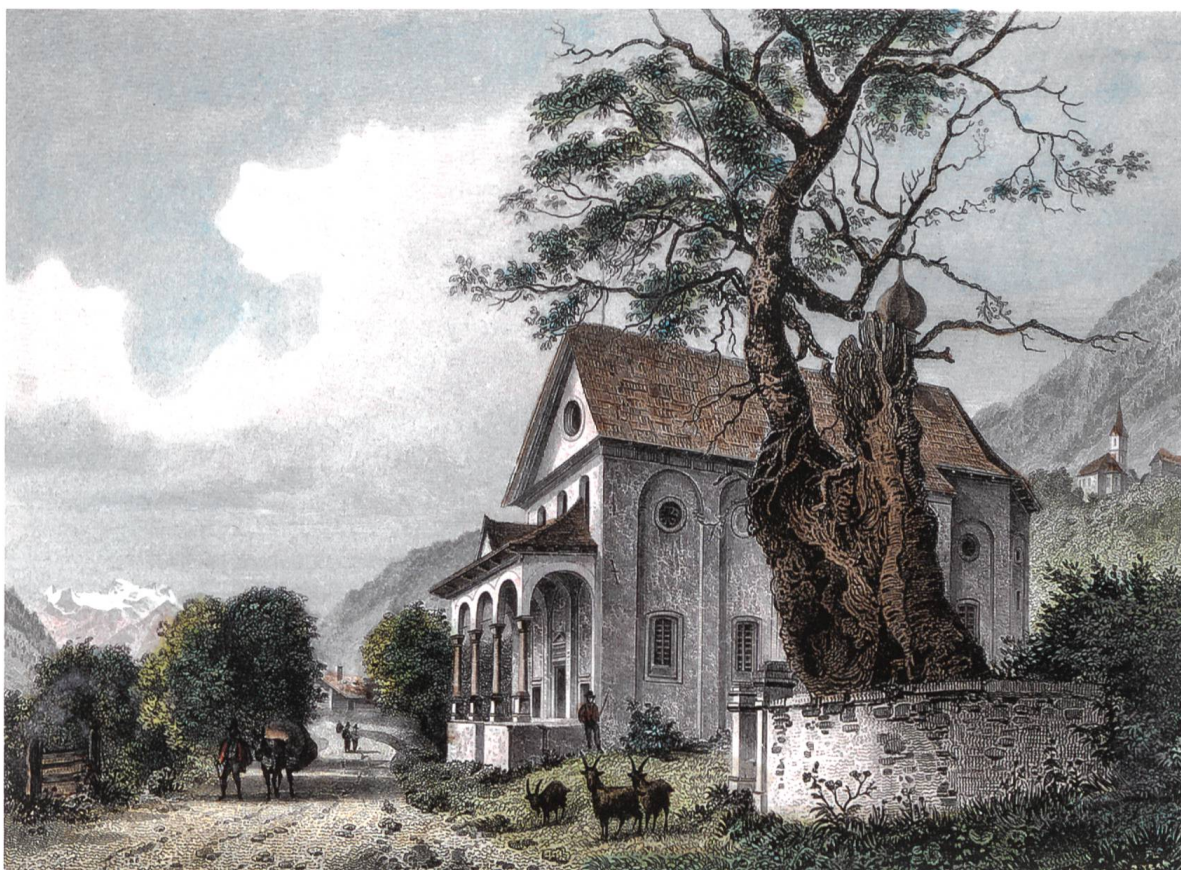
Bild 3: Kapelle Sta. Anna, Trun. Unter dem Ahorn wurde der Überlieferung nach der Graue Bund im Jahr 1424 gegründet.

Zum besseren Verständnis sollen an dieser Stelle die wichtigsten politischen Ämter der Landschaft Disentis zur Zeit der Drei Bünde bis 1799 erläutert werden: 7