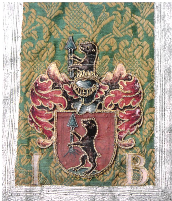
Bild 9: Textilwappen Berchter in der Benediktinerabtei Disentis, Datierung vermutlich 1697.

Das nachfolgende Bild 9 zeigt ein Textilwappen, das mit grosser Wahrscheinlichkeit dem Benediktiner P. Justus Berchter zugeordnet werden kann. Allein aufgrund der Initialen I B ist die Zuordnung allerdings nicht ohne weiteres möglich, vor allem wegen des Fehlens einer Jahreszahl. Wenn man aber die biographischen Angaben in den letzten drei