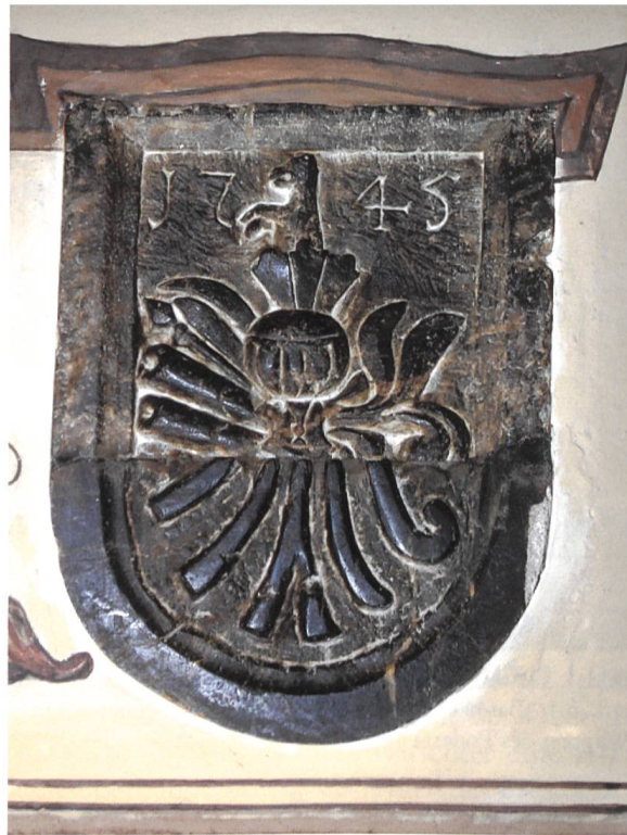
Bild 8: Wappenfragment im Hotel Della Cruna, Sedrun, datiert 1745. Sowohl die Schildemblemle als auch die Helmzier stützen berechnete Zweifel, ob es sich hier um ein Wappen Berther handelt.