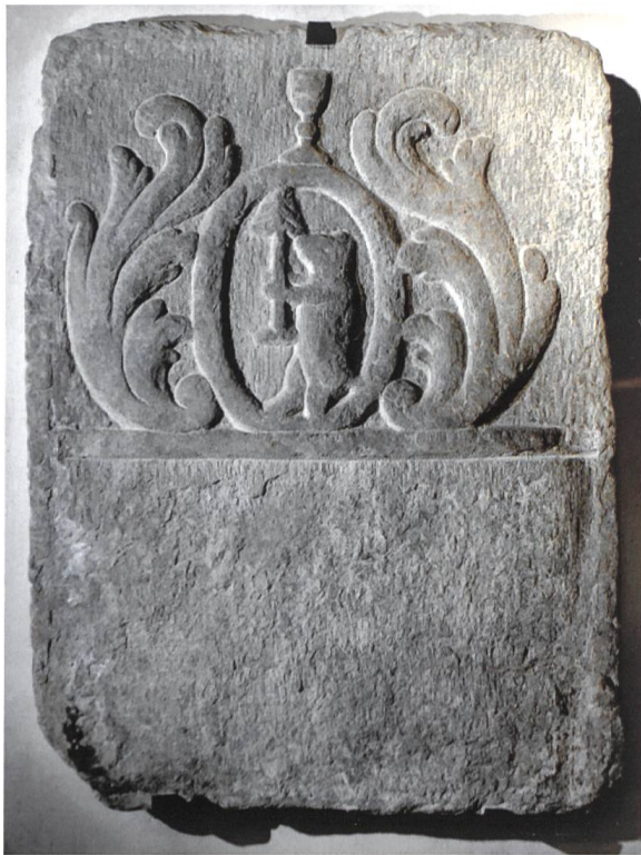
Bild 7: Grabmal in der Antonius-Kirche in Cavardiras mit Wappen Berther. Die Inschrift im unteren Teil ist total verwittert. Der Kelch an der Stelle der Helmzier lässt vermuten, dass es sich um das Grabmal eines Geistlichen handelt. Dat. um 1700/1750.