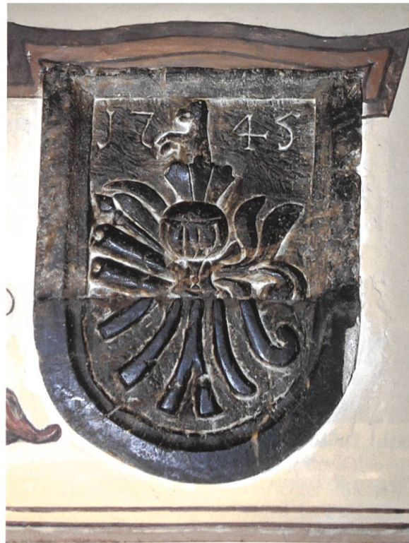
Bild 8: Wappenfragment im Hotel Della Cruna, Sedrun, datiert 1745. Sowohl die Schildemblemle als auch die Helmzier stützen berechnete Zweifel, ob es sich hier um ein Wappen Berther handelt.