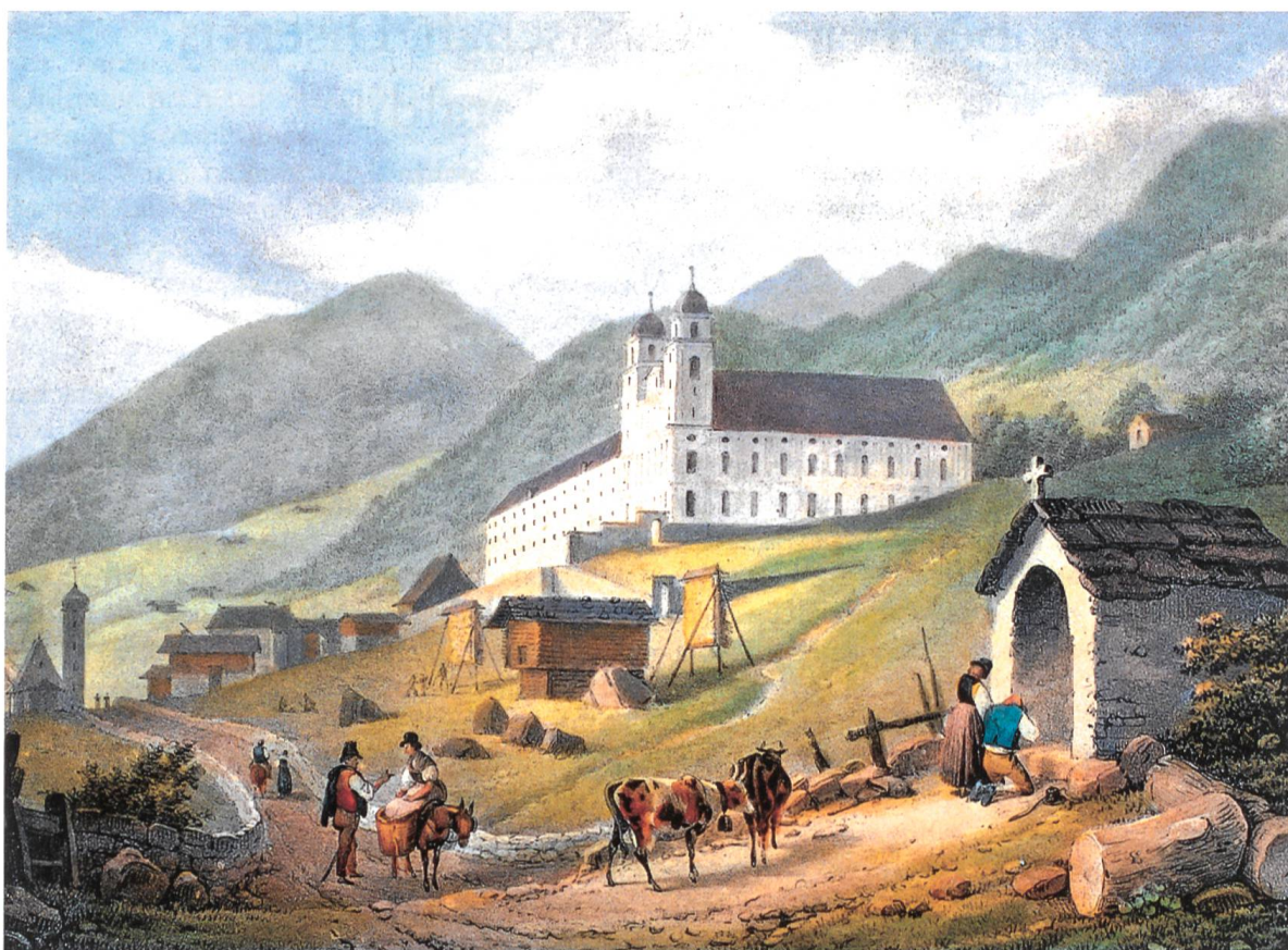
Bild 2: Das Klosterdorf Disentis um 1827. Auf der Landsgemeinde, die vor den Klostermauern tagte, wurden der Landammann, der Seckelmeister, der Landschreiber und die Delegierten an den Bundestag des Grauen Bundes gewählt.