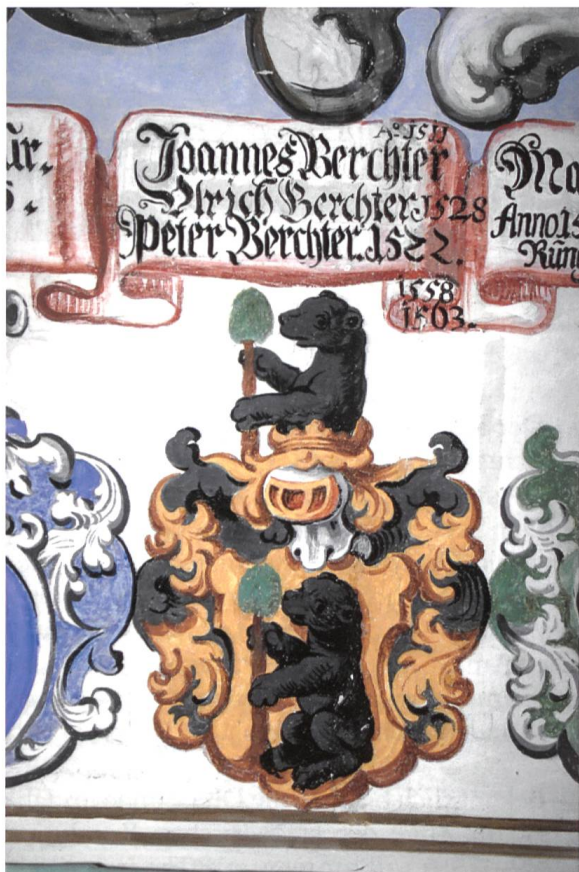
Bild 4: Wappenfresko Berchter im Landrichtersaal, um 1700. Die Angaben in der oberen Inschrift sind ungenau. Bei den Jahreszahlen stimmt nur 1528 und einen Landrichter namens Johannes Berchter gab es überhaupt nicht. Das Fresko entstand bei der Innenausstattung der Cuort Ligia Grischa um 1700.

Peter Berchter , 1549/50 und 1561/62. Für die Amtsperiode 1549/50 hatte der Bundestag Gaudenz v. Lumbrins aus Trun/Zignau zum Landrichter gewählt. Dieser starb jedoch im Amt (durch Ertrinken). Im September 1549 wurde Peter Berchter zu seinem Nachfolger bestimmt.