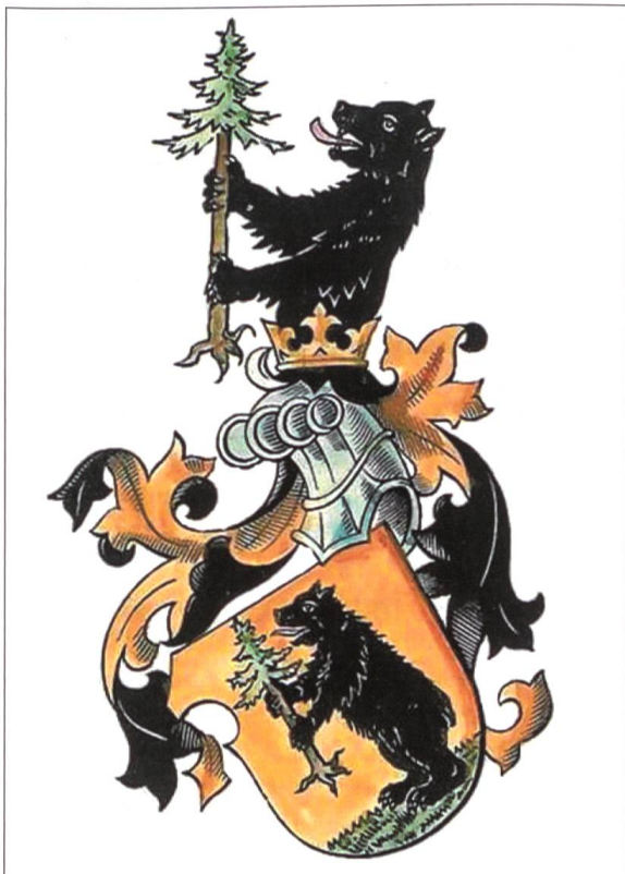
Bild 1: Wappen Berther nach Gieri Casura, 1937. Kolorierung nachträglich ausgeführt.

Berther ist ein Bündner Familienname der Landschaft Disentis. Der Name wird bereits im 14. Jahrhundert als Cha Berchta in Tavetsch/Tujetsch erwähnt, deutsch auch Bertold. Bereits 1397 existierte der Familienname Ca Bertold im Lugnezertal. Die Linie aus Tavetsch stellte 1425 den ersten einer langen Reihe von Landammännern der Cadi. Politisch einflussreich war die Linie Berchter/Berther nur im 16. und im 17. Jahrhundert. Die verschiedenen Zweige aus Tavetsch, Disentis, Somvix und Trun stellten damals 12 ihrer insgesamt 16 Landammänner. Dreimal vertraten sie die Drei Bünde als Amtsleute im Veltlin bzw. in den Grafschaften Chiavenna und Bormio.