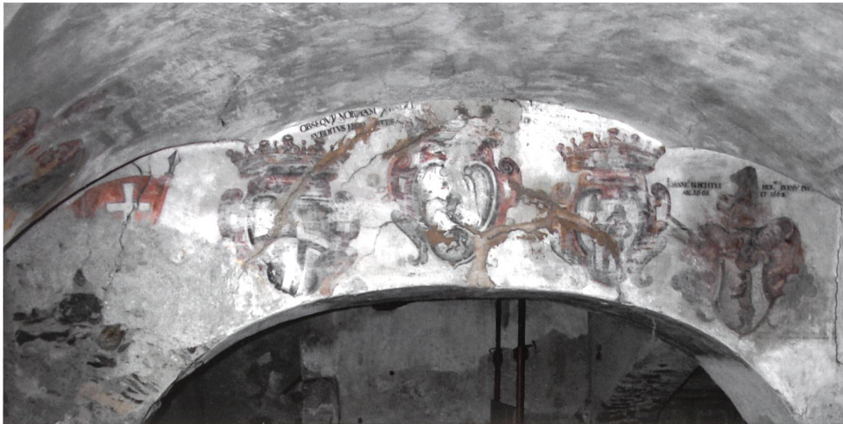
Bild 5: Gewölbe im Erdgeschoss der Casa Podestare in der Via Pedranzini in Bormio. Wappenfresken am Mauerbogen, v. l. n. r.: Banner des Oberen Bundes, Wappen der Drei Bünde (Oberer Bund, Gotteshausbund, Zehngerichtenbund), Wappen des Podestà Johann Berchter aus Disentis. Datierung des Wappens Berchter: 1663.