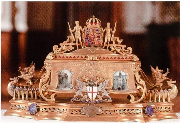
7. Staatsbesuch in England König Christians X. und der Königin Alexandrine, 1914. Schrein mit dem dänischen Königswappen und dem Wappen von London geschenkt von der City of London.

den Pavillon im Park am Schloss Fredensborg in Nordseeland der Königin Louise zu Ehren wiederaufbauen. Beide Herren waren 1888 Grosskreuzritter des Dannebrogordens geworden. Jetzt gaben sie etwas zurück.