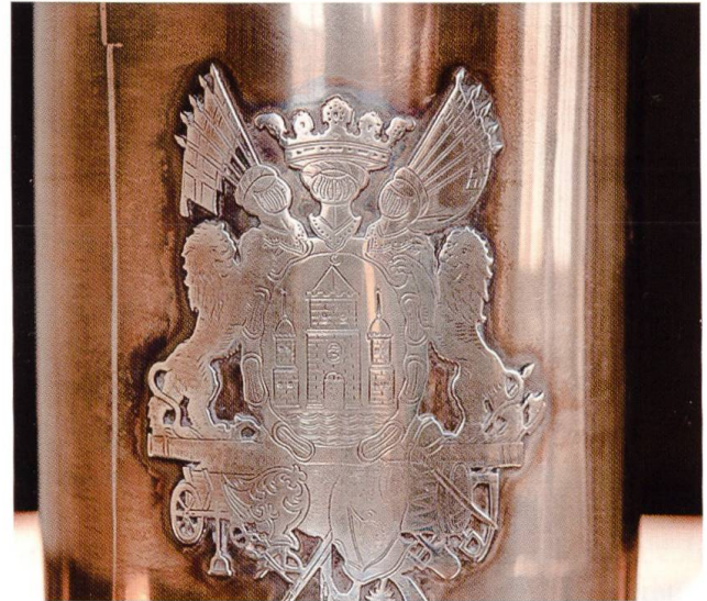
10. 25-jähriges Regierungsjubiläum König Christians X., 1937. Kopie des Caritas-Springbrunnens mit dem Kopenhagener Wappen geschenkt von der Stadt Kopenhagen.