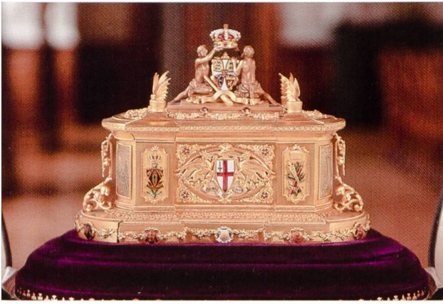
5. Staatsbesuch in England König Christians IX. und der Königin Louise, 1893. Schrein mit dem dänischen Königswappen, dem Wappen von London u. a. m. geschenkt von der City of London.