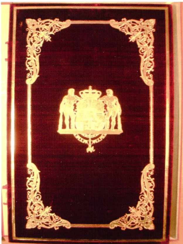
1c. Grussadresse mit dem Königswappen und Bändern des Dannebrogordens als Verschluss.

Zeit waren die Geber preussische Untertanen, weil der dänische König nach dem Krieg 1864 die Herzogtümer Schleswig, Holstein und Lauenburg hatte abtreten müssen. Somit war diese Gabe ein Ausdruck einer nationalen Gesinnung der vielen, besonders nord-schleswigschen, Einwohner, die Dänemark gegenüber loyal blieben. Auf dem Fusstück sind das dänische Wappen und das schwedisch-norwegische Wappen dargestellt – letzteres mit einer ungewöhnlichen Teilung. Am Rand des Fusstücks kommen die Wappen von vier Schleswiger Städten zum Vorschein: Flensburg / Flensborg, Sonderburg / Sønderborg, Apenrade / Aabenraa, Hadersleben / Haderslev (Ill. 2a und 2b).