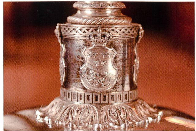
2a-b. Hochzeit des Kronprinzen Frederik (VIII.) und der Kronprinzessin Louise, 1869. Tafelaufsatz geschenkt von dänischgesinnten Nordschleswigern. Fusstück mit dem dänischen Wappen und dem schwedisch-norwegischen Wappen.