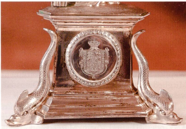
1b. Fusstück mit dem dänischen Königswappen.