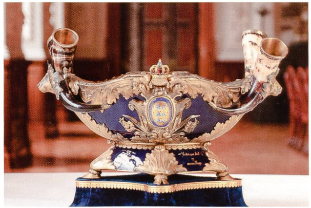
4. 25-jähriges Regierungsjubiläum König Christians IX., 1888. Terrine mit dem dänischen Wappen geschenkt von der Kopenhagener Metzgerzunft.

Aus Anlass des 25-jährigen Regierungsjubiläums König Christians IX. 1888 schenkte die Kopenhagener Metzgerzunft eine Terrine aus Porzellan und Bronze, die von der Königlichen Kopenhagener Porzellan-Manufaktur hergestellt war. Der Beruf der Spender kommt in der Komposition deutlich zum Ausdruck: Stierköpfe, Stierhörner und Stierklauen. In der Mitte der Terrine erscheint das dänische Wappen (Ill. 4).