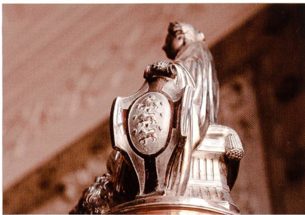
3a-b. Hochzeit des Kronprinzen Frederik (VIII.) und der Kronprinzessin Louise, 1869. Tafelaufsatz geschenkt von der im Königreich wohnenden Bevölkerung. Mutter Dänemark mit Kreuz und Wappen.

Handel, Schifffahrt, Industrie etc. symbolisieren. Ein Silber- und Goldwarenfabrikant, Vilhelm Christesen, hat das ganze Stück kreiert. Um die Säule sind das dänische Wappen und das schwedisch-norwegische Wappen dargestellt (Ill. 3a und 3b).