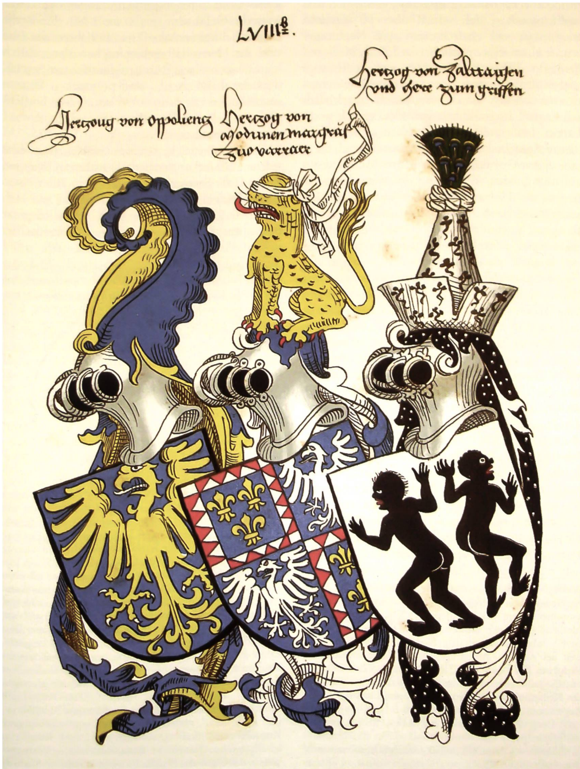
Abb. 1: Das Wappen der Familie d'Este (Mitte) in «Des Conrad Grünenberg [ ] Wappenbuch» (vollendet 1483) nach dem «Amorial Grünenberg», Tafelband (wie Anm. 66), Tafel 57 b.