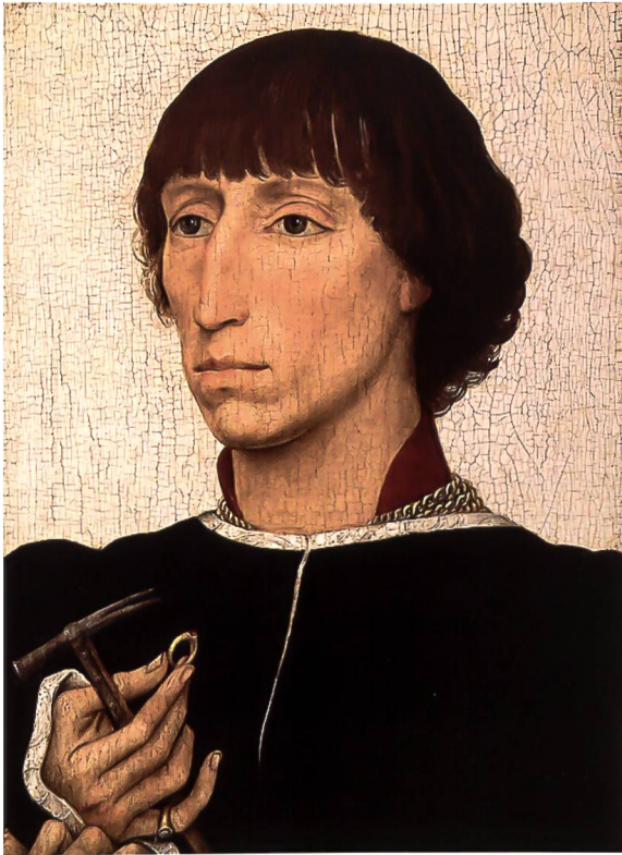
Rogier van der Weyden: Francesco d'Este, um 1460, nach de Vos (wie Anm. 50), S. 303.

Bündnis mit Rom und Venedig setzten sich die Markgrafen durch und brachen nach einem von 1205 bis 1240 andauernden Krieg alle Widerstände. In einer planmäßig gelenkten Volksversammlung ließ sich Markgraf Obizzo II. 1264 zum Herrn von Ferrara ausrufen und gründete damit die erste formal legitimierte Familienherrschaft, «Signoria». 1288 und 1290 wurde Obizzo II. auch Herr über die Reichslehen Modena und Reggio (nell'Emilia). Im Krieg gegen Bologna und Parma gingen diese 1305 allerdings verloren und wurden erst 1336 und 1409 wieder zurück gewonnen. 1312 wurden die Este sogar aus Ferrara vertrieben, konnten aber 1317 zurückkehren und mit dem Wiederaufbau ihrer Herrschaft beginnen, freilich nur als Vikare des Papstes. 1354 ernannte König Karl IV. (1347–1378) aus dem Hause Luxemburg 20 auf seinem ersten Italienzug, bei dem er 1355 die Kaiserwürde erlangte, die Este zu Reichsvikaren über Modena und Reggio. Im Namen der beiden höchsten Autoritäten der damaligen lateinischen Welt konnten sie allerdings nach eigenem Gutdünken handeln