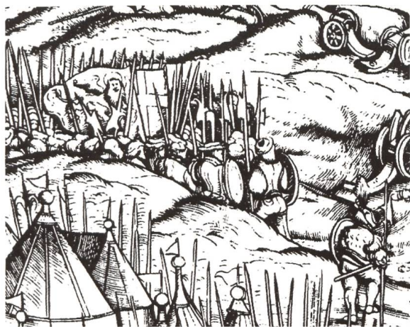
Fig. 6 Der Weiß Kunig , Bataille de Gradisca (détail), Vienne, Nationalbibliothek.

d'or passant est représenté sur champ rouge et la croix d'or tenue verticalement par la patte droite de l'animal (fig. 5) 13 .