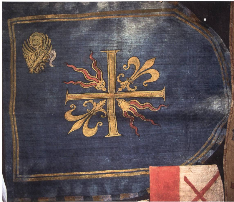
Fig. 2 Drapeau du marquis del Monte Santa Maria.

l'affrontement, coupèrent les rênes des chevaux ennemis, lesquels, désormais hors de contrôle, mirent le désordre dans leurs propres rangs, entraînant la défaite aragonaise 4 .