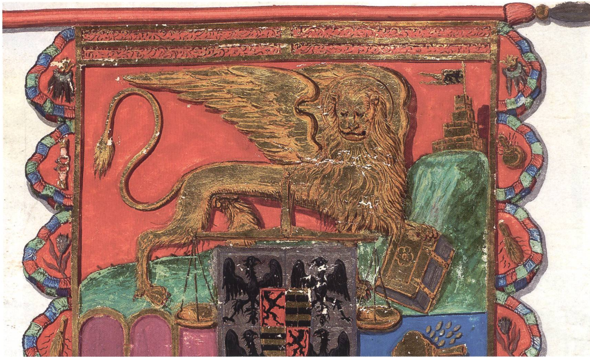
Fig. 7 Bannière de Venise 11/9, dans le «Livres des Drapeaux», Pierre Crolot, 1648. Archives d'Etat de Fribourg.

de Venise dut affronter une coalition dirigée par le pape Jules II et à laquelle avaient adhéré Louis XII, roi de France, Maximilien I er , empereur du Saint Empire Romain germanique, Ferdinand II d'Aragon, roi d'Espagne, ainsi que les ducs de Ferrare et de Mantoue.