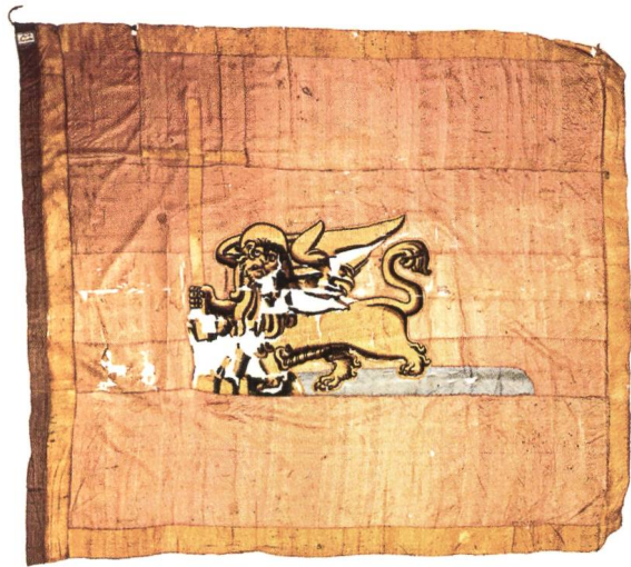
Fig. 5 Drapeau du navire de Capodistria (Koper) à la bataille de Lépante (Aldrighetti, L'araldica e il leone di San Marco , p. 106).