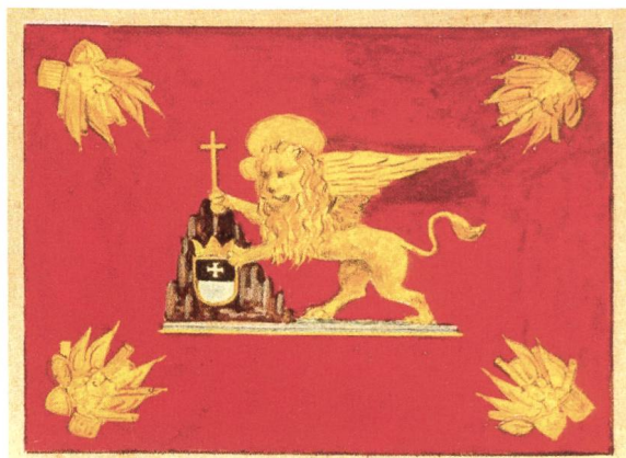
Fig. 4 Drapeau vénitien du XVII e siècle (Giorgio Aldrighetti, L'araldica e il leone di San Marco , Venise 2002, p. 99).

partie de l'héraldique des Bourbon-del Monte, mais il s'agit d'un symbole vénitien ancien, comme en témoigne la « Pala d'oro » (retable d'Or), qui représente la réception des reliques de saint Marc à Venise, chef-d'œuvre d'orfèvrerie conservé dans la basilique Saint-Marc, daté de 1000 à 1300. Les Vénitiens qui portent le cercueil contenant les restes du saint tiennent deux draps, dont l'un est bleu avec une croix alésée d'or. Toujours dans la basilique, une mosaïque du milieu du XIII e siècle, qui représente le transfert du corps de saint Isidore de l'île de Chios, montre un soldat vénitien avec un bouclier blanc orné d'une croix d'or 11 . Cette croix symbolise celle que portait l'empereur Constantin à la bataille du Pont Milvius, et dont les Vénitiens, selon Sanuto, avaient rapporté un morceau de Byzance. Il s'agit donc d'un lien symbolique avec l'Empire romain d'Orient, dont Venise dépendait jadis 12 .