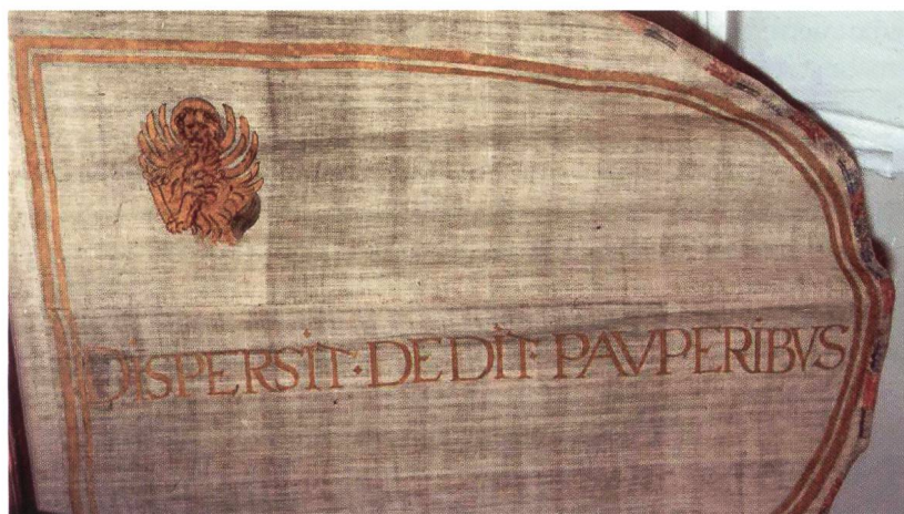
Fig. 1 Drapeau vénitien.

militaire 3 . Il s'est distingué au service de Florence, au cours de la longue guerre contre Pise, et notamment en 1498, où il battit l'armée aragonaise, commandée par Bartolomeo d'Alviano, venue au secours de Pise. Francesco Sansovino raconte que le marquis del Monte aurait remporté la victoire, même si son contingent était en infériorité numérique, en mettant au milieu de ses cavaliers de nombreux fantassins armés de vouges qui, pendant