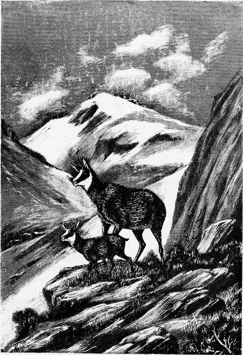
Nach einer Zeichnung von Adolf Tierstein, St. Gallen.

Dann ging's zum zweiten Mal über das Band hinunter; diesmal in beschleunigtem Tempo. Ich fühlte mich, so paradox es klingen mag — ungemein erleichtert, als ich meinen geliebten Sack wieder auf dem Rücken hatte.