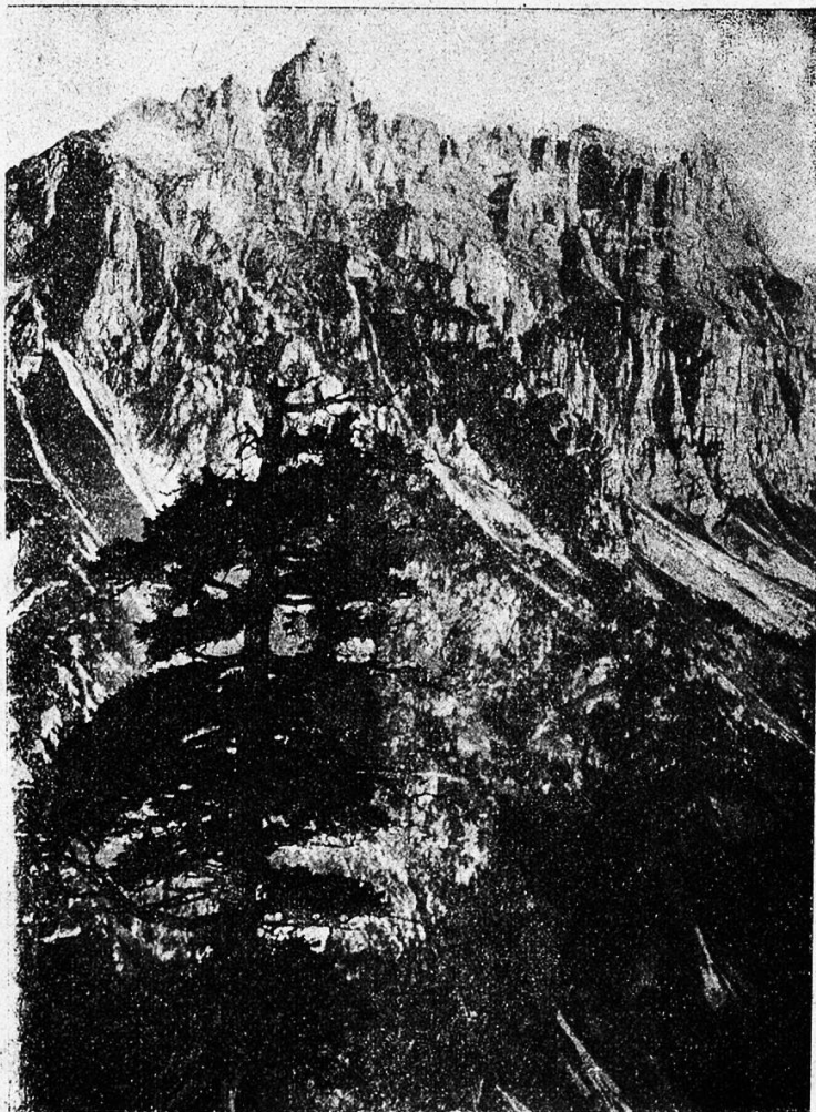
Der Mürtschenstock.

Mein Gipfelpfeifchen schmauchend und in den Eisenhutkräutern behaglich hin und her watend, genoß ich con amore die Rundsicht. Hoffentlich wird der Leser nicht erwarten, daß ich ihm diese schildern werde. Ich habe — durch den eigenartigen Reiz des Sujets verführt — schon mehrere Male das Kurfürstenpanorama kurz zu skizziren versucht und noch jedesmal ist es mir mißlungen. Bergrundsichten durch das Mittel der Sprache so darzustellen, daß der Leser ein anschauliches, malerisches Bild bekommt — das brachte bis jetzt eigentlich nur unser unvergesslicher