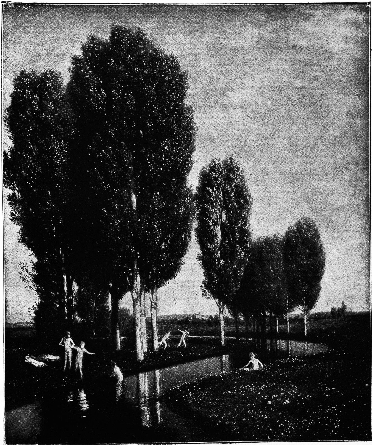
Ein Sommertag. Nach dem Gemälde von Arnold Böcklin.